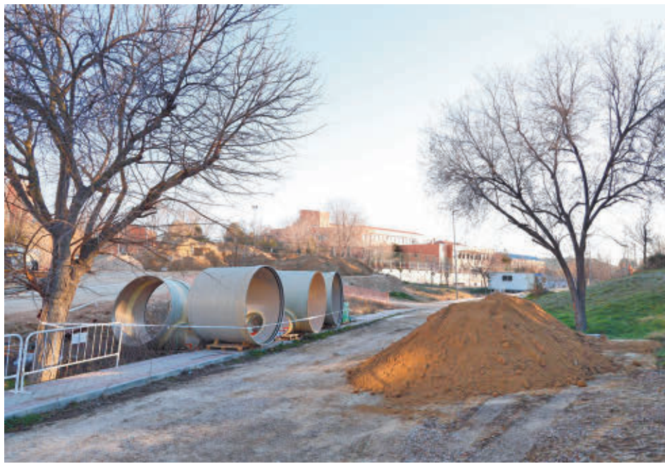
El Canal procedió a realizar obras en avenida de la Hispanidad AYUNTAMIENTO DE FUENLABRADA

La ZBE de Fuenlabrada tiene una superficie aproximada de un kilómetro cuadrado y limita con la calle Málaga, la