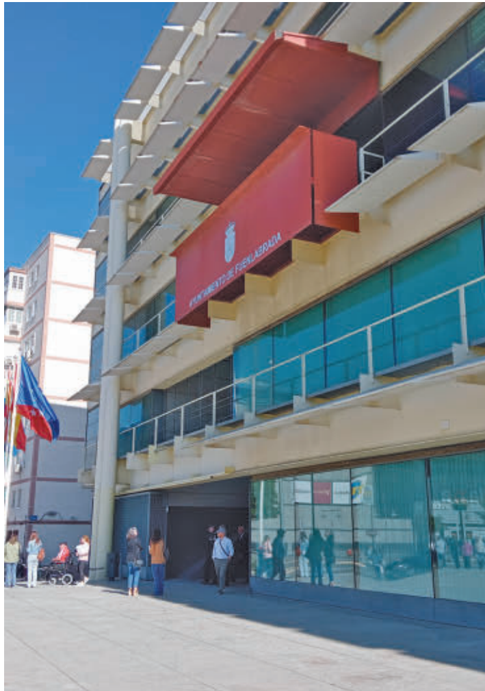
Quieren una canción que refleje el "orgullo fuenlabreño"

EL PLAZO PARA REALIZAR LA INSCRIPCIÓN FINALIZARÁ EL 27 DE OCTUBRE