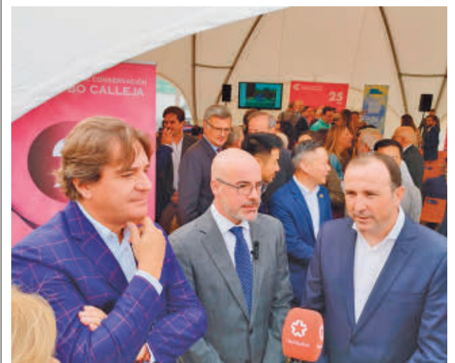
El Consistorio muestra su disconformidad con el centro EP

den, según dice, fomentar su participación activa en el ámbito musical, lo que a su vez "contribuye a una sociedad más inclusiva y diversa".