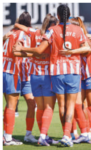
El Atlético goleó en Valencia

Por su parte, el Real Madrid afronta una salida complicada al campo del Akeki Tenerife, un equipo que ha dado algún disgusto a los grandes en las últimas temporadas. El partido se disputará este domingo (19 horas).