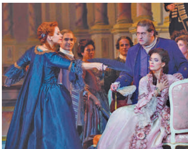
La obra será retransmitida en directo

mana arranca la sesión inaugural de ópera del Teatro Real. De esta forma, la obra 'Adriana Lecouvreur', con la que El Real abrirá la temporada, será retransmitida en directo este sábado 28 de septiembre por la tarde en la pantalla exterior del centro cultural Tomás y Valiente. "Un estreno del que se podrá disfrutar sin salir de la ciudad", han dicho fuentes municipales.