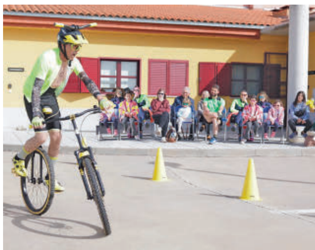
El Circlista, para público familiar CHIMICHURRI CIRCO EVENTOS

que durará tres días, 27, 28 y 29 de septiembre, para reivindicar la calle. Entre la multitud de propuestas, este viernes arranca con un taller de pintura y un pasacalles ‘Sant Louis Jazz Band’, también con el espectáculo El Circlista, para público familiar. Un día después se celebrará el VII Encuentro de Peñas y Asociaciones Flamencas de la Comunidad de Madrid.