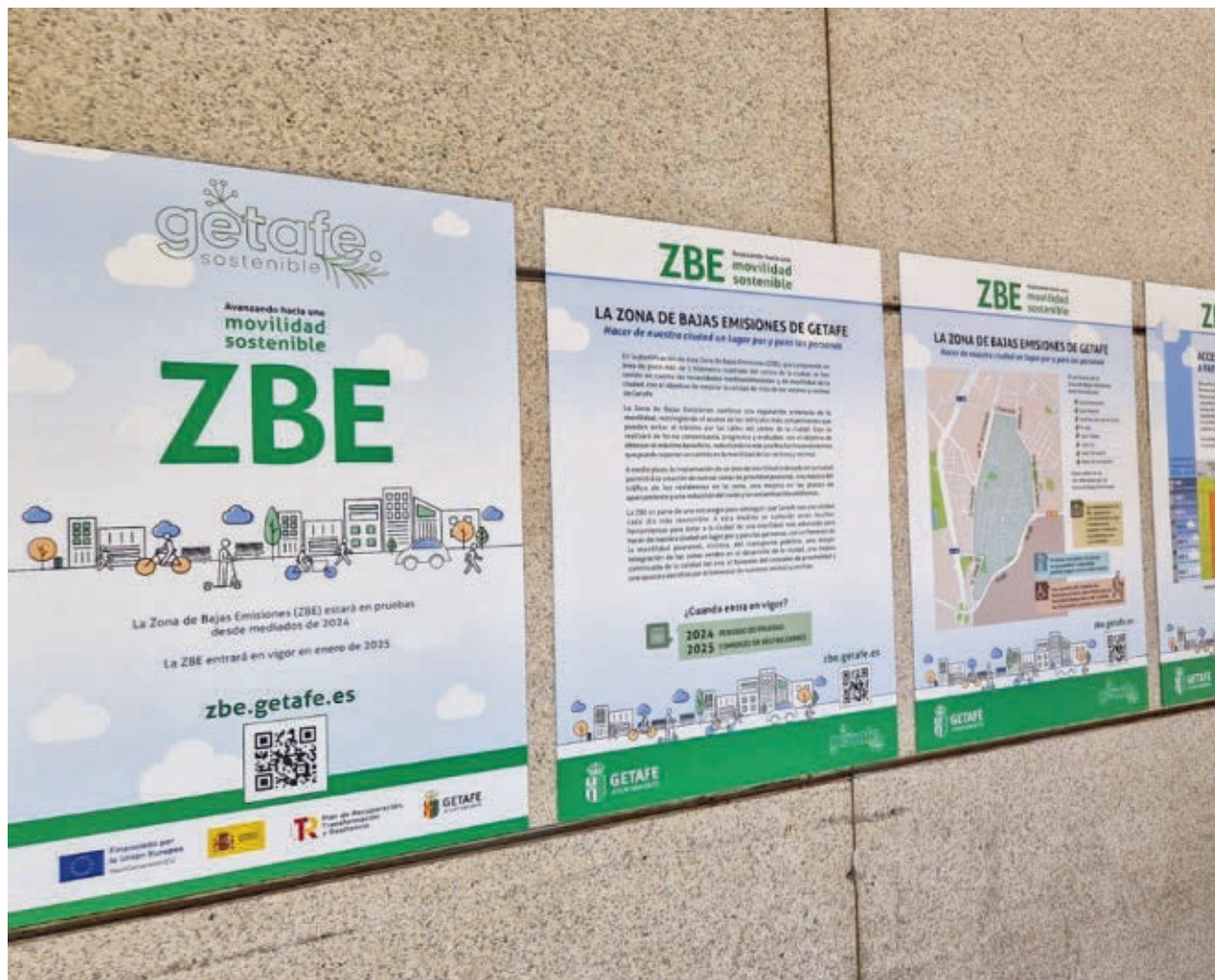
AYTO DE GETAFE