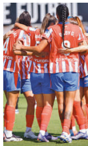
El Atlético goleó en Valencia

Por su parte, el Real Madrid afronta una salida complicada al campo del Akeki Tenerife, un equipo que ha dado algún disgusto a los grandes en las últimas temporadas. El partido se disputará este domingo (19 horas).