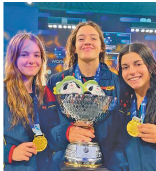
Las tres jugadoras posan con sus medallas y el trofeo

También tendrá que viajar el Sernova Renovables Real Canoe, en su caso, a la pista del Estepona Jardín Costa del Sol. El objetivo del club madrileño será amarrar cuanto antes la permanencia para no pasar apuros y, por qué no, acercarse a los puestos de 'play-off' de ascenso.