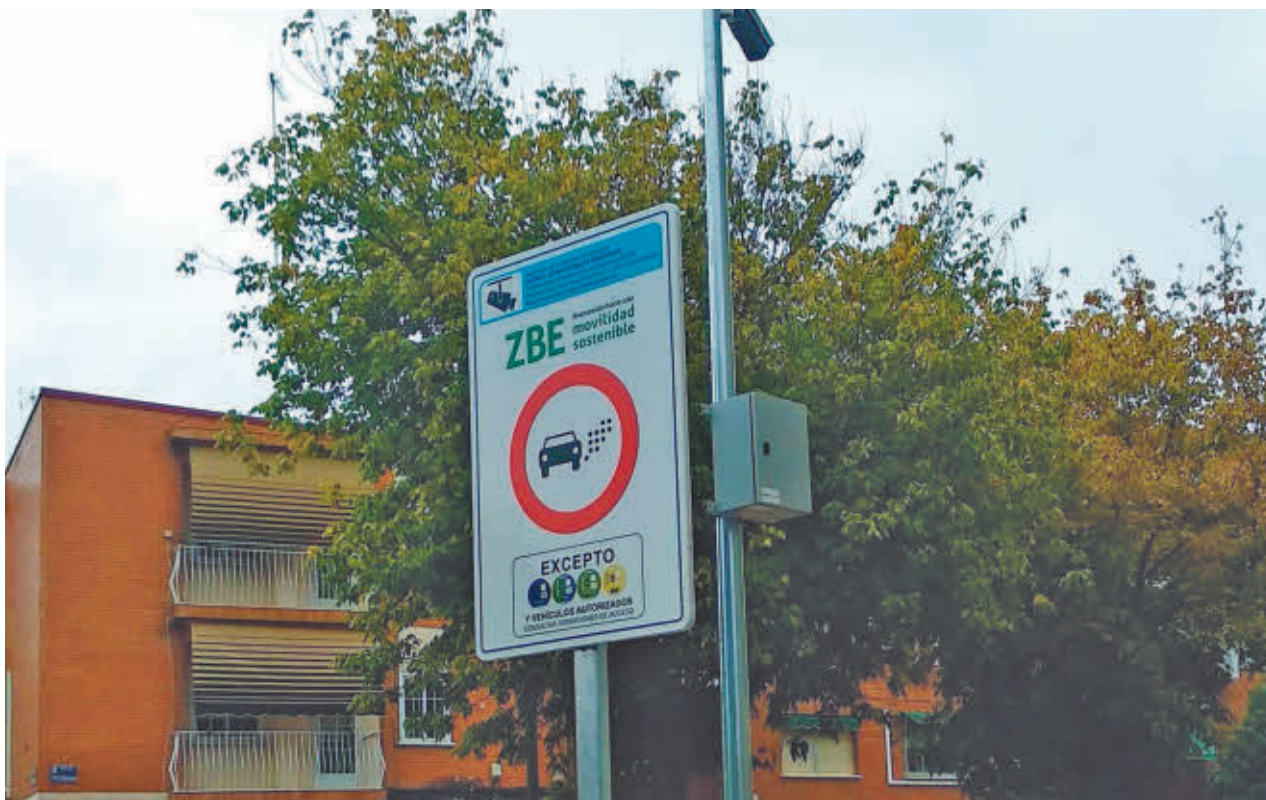
La Zona de Bajas Emisiones está actualmente en pruebas EP