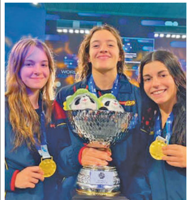
Las tres jugadoras posan con sus medallas y el trofeo

También tendrá que viajar el Sernova Renovables Real Canoe, en su caso, a la pista del Estepona Jardín Costa del Sol. El objetivo del club madrileño será amarrar cuanto antes la permanencia para no pasar apuros y, por qué no, acercarse a los puestos de 'play-off' de ascenso.