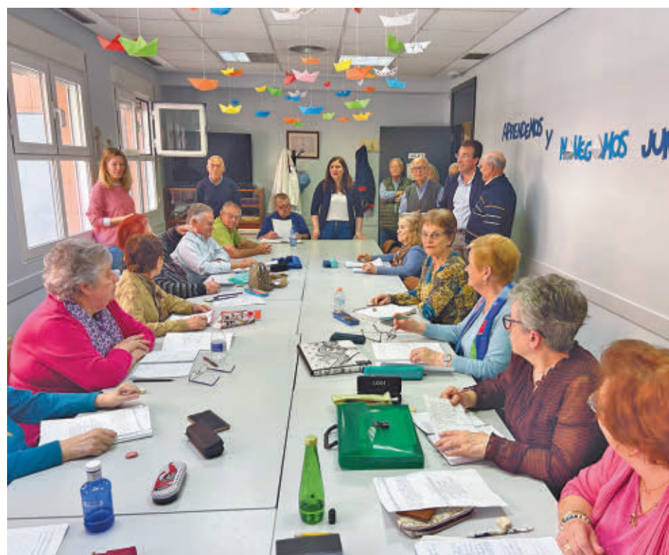
Una de las actividades para mayores en Leganés

El alcalde, Miguel Ángel Recuenco, invitó a vecinos y visitantes "a que puedan revivir de primera mano este enfrentamiento entre el Duque de Montpensier y el infante Don Enrique".