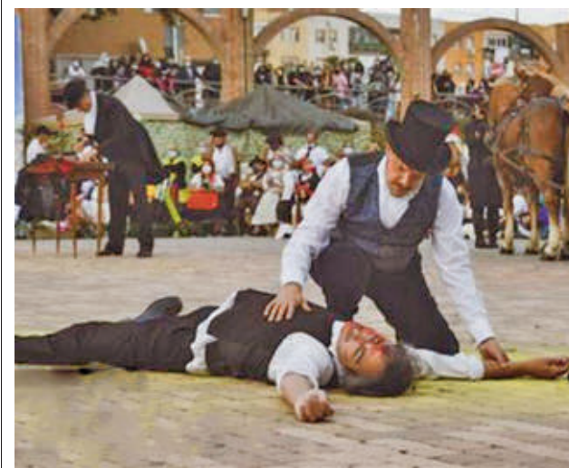
Recreación del pasado año

gentedigital.es Toda la actualidad de Leganés, en nuestra página web