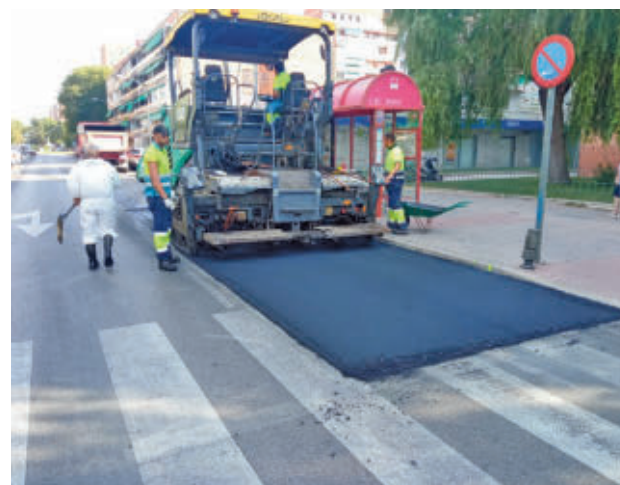
Una de las paradas de autobuses

Las ocho paradas se encuentran ubicadas a lo largo del anillo que forman las calles de La Rioja y Monegros. La calzada junto a estas paradas de autobuses había sufrido, al