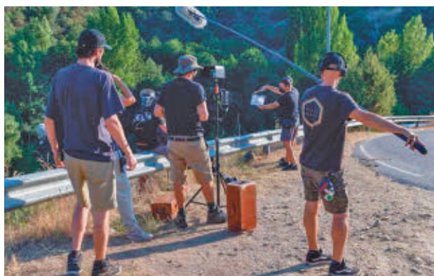
Un rodaje audiovisual en Madrid

Entrando al detalle de los datos publicados, han con-