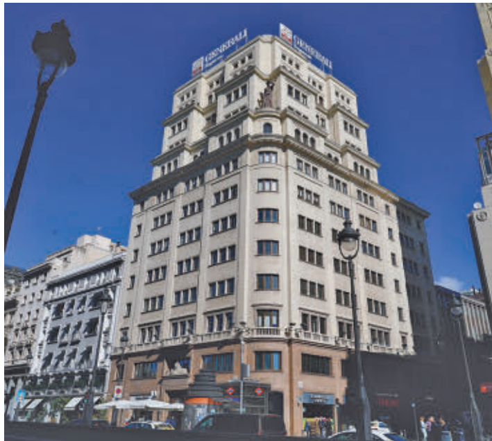
El inmueble tiene 13 plantas, locales comerciales y oficinas

El inmueble, una vez renovado, albergará también áreas de restauración y reu-