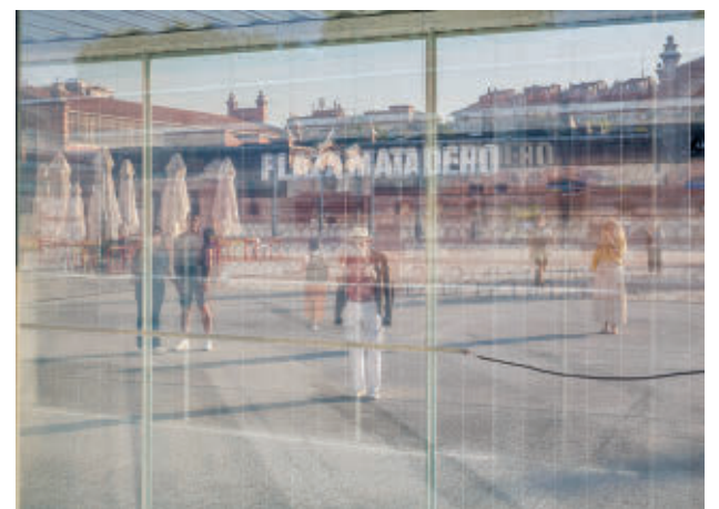
Una de las propuestas del festival

Además, se eliminará el impacto negativo de la maquinaria instalada en la cubierta, mediante la colocación de las máquinas de climatización y aerotermia en el interior. El proyecto incorpora un ascensor entre los dos ya existentes en uno de los patios con acceso directo a la escalera central. La entrada al inmueble será la actual, ejecutada en el año 2014.