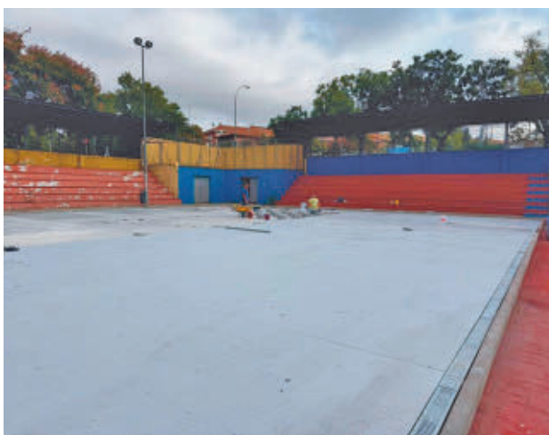
Los trabajos en la dotación deportiva de Ciudad Lineal

El proyecto contempla la instalación de vallado, pavimento, marcaje y mobiliario homologados, así como la construcción de una rampa de acceso a la actual grada para mejorar la accesibilidad a este espacio deportivo.