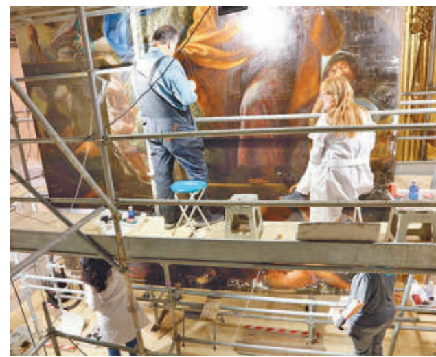
Un momento de la intervención en el templo vallecano

Por su parte, el alcalde destacó que el nuevo texto debe aumentar la oferta de vivienda y agilizar los trámites burocráticos. Además, adelantó que lo estudiarán desde el punto de vista de las competencias municipales.