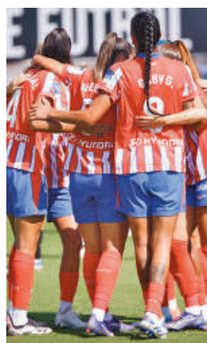
El Atlético goleó en Valencia

Por su parte, el Real Madrid afronta una salida complicada al campo del Akeki Tenerife, un equipo que ha dado algún disgusto a los grandes en las últimas temporadas. El partido se disputará este domingo (19 horas).