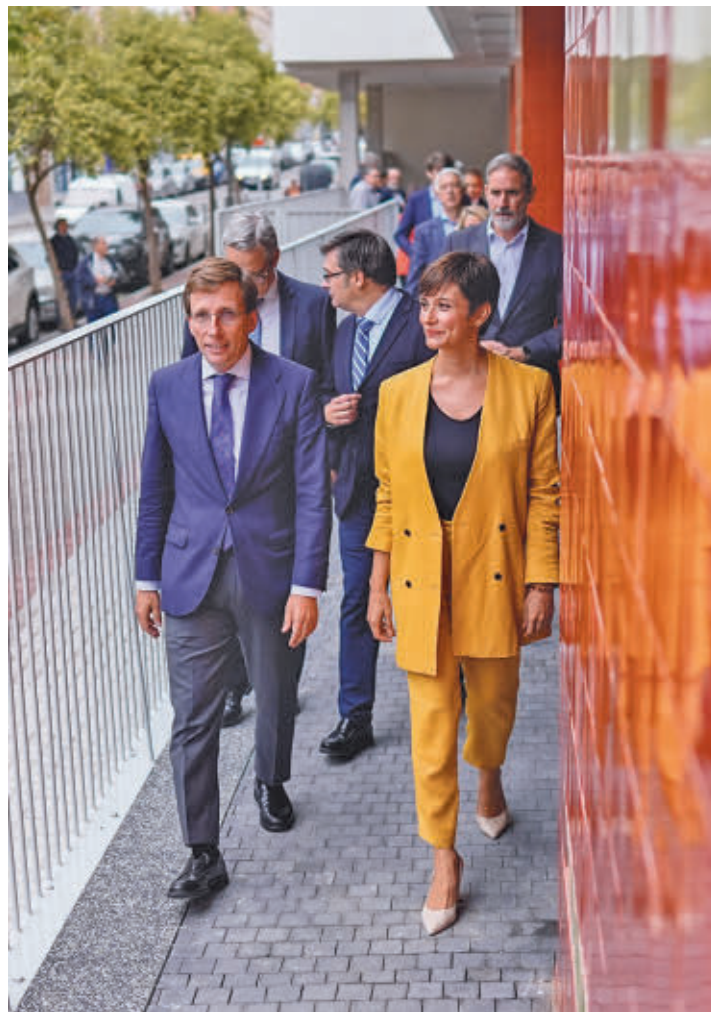
Las autoridades entran a uno de los portales de la promoción

les y San Francisco Javier, construidas entre 1956 y 1958, estará compuesta de 12 promociones, 10 ya finalizadas, y albergará 1.200 viviendas.