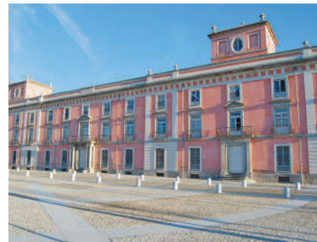
Palacio del Infante D. Luis

Majadahonda es uno de los municipios considerados ‘ciudad de los 15 minutos’ por la revista Nature Cities. El concepto se aplica a ciudades donde los vecinos tardan menos de un cuarto de hora en acceder a servicios básicos a pie, en bicicleta o utilizando el transporte público.