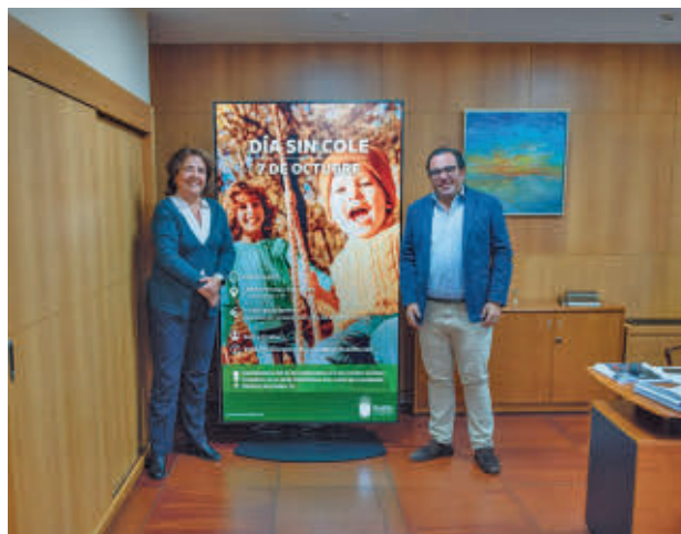
El alcalde posa con el cartel de la actividad municipal

La inscripción podrá realizarse hasta el 2 de octubre en la web municipal, en el apartado Educación, donde se podrá rellenar el formulario, realizar el pago y presentar la solicitud firmada. El precio será de seis euros por participante, con descuentos por hermanos y para niños con diversidad funcional.