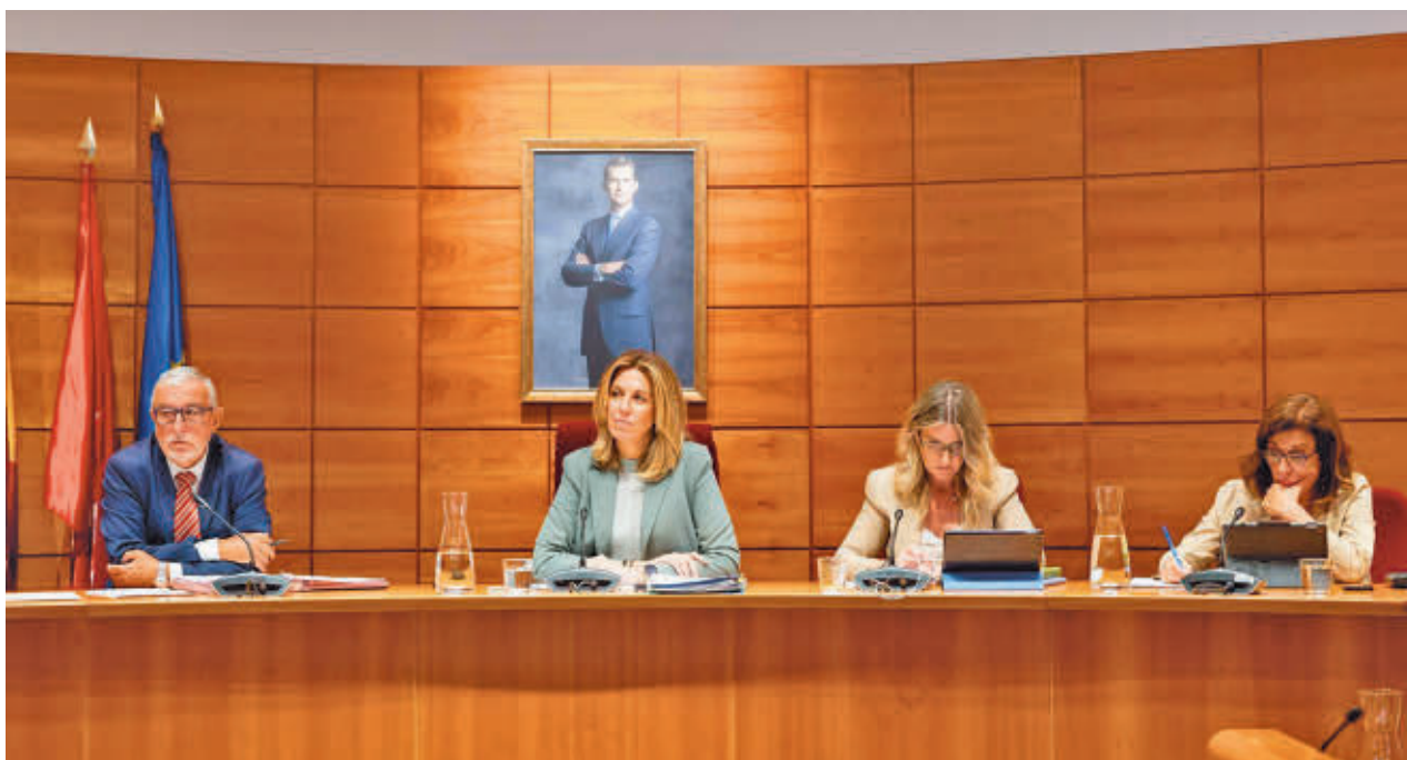
Un momento del Pleno de la localidad del pasado 19 de septiembre