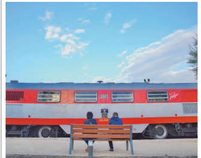
Dos personas contemplan los vehículos restaurados

Durante los meses de septiembre a noviembre y de marzo a junio, el museo abre al público de viernes a domingo, de 10 a 14 horas.