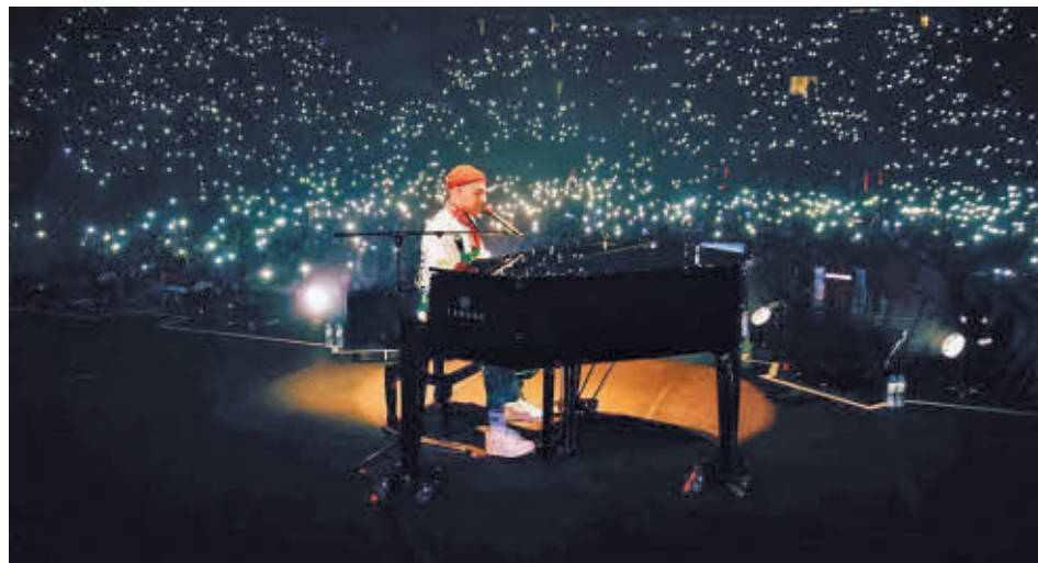
Nil Moliner será el primer artista en actuar en las fiestas