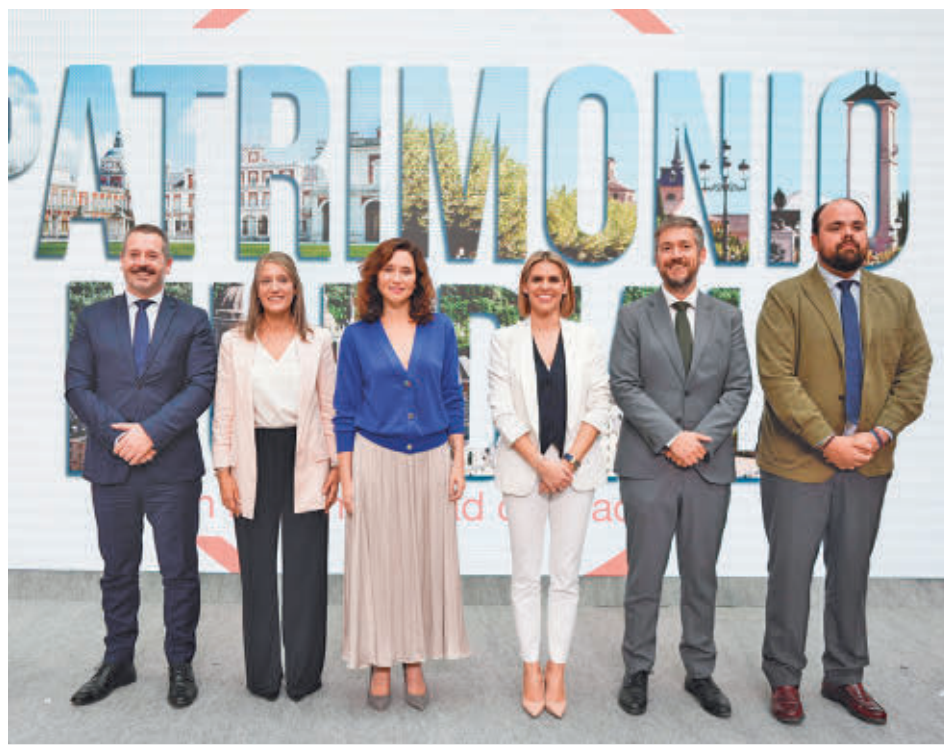
Acto de promoción del Patrimonio Mundial madrileño

“Queremos que el turismo siga creciendo, pero que lo haga de una manera equilibrada, pensando en todos los públicos, especialmente dedicados a la cultura, a las compras, los grandes eventos, la gastronomía, nuestros