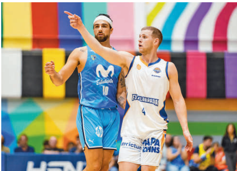
Estudiantes y Fuenlabrada se enfrentaron en la Copa de España MOVISTAR ESTUDIANTES