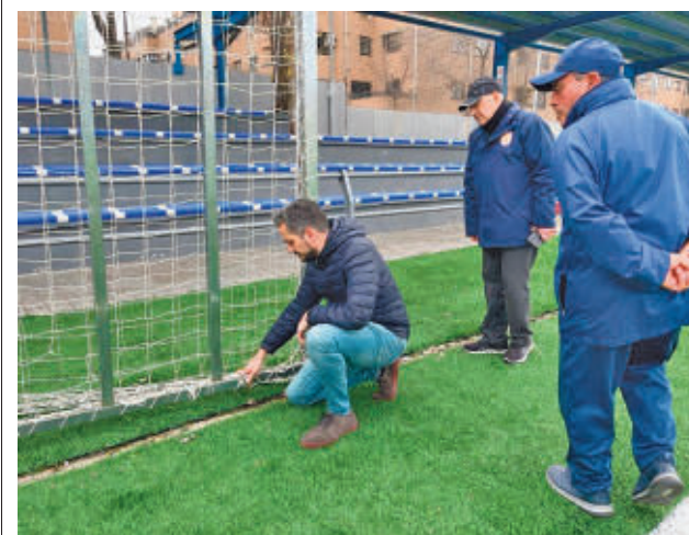
El concejal visitó las instalaciones

En un momento dado, el individuo cogió una escopeta y se atrincheró en su casa amenazando a todo el vecindario con disparar. Los agentes cortaron todos los accesos a la vivienda y negociaron con el hombre durante 11 horas, hasta que al final lograron convencerle para que abriera la puerta voluntariamente y entregara el arma. En ese momento fue detenido y puesto a disposición judicial.