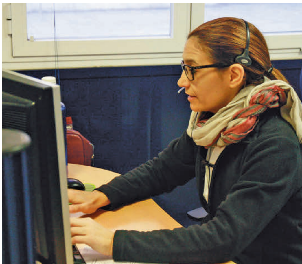
El INE ha publicado los datos relativos a los sueldos de 2022

La actividad económica con mayor remuneración anual en 2022 fue el suministro de energía eléctrica, gas, vapor y