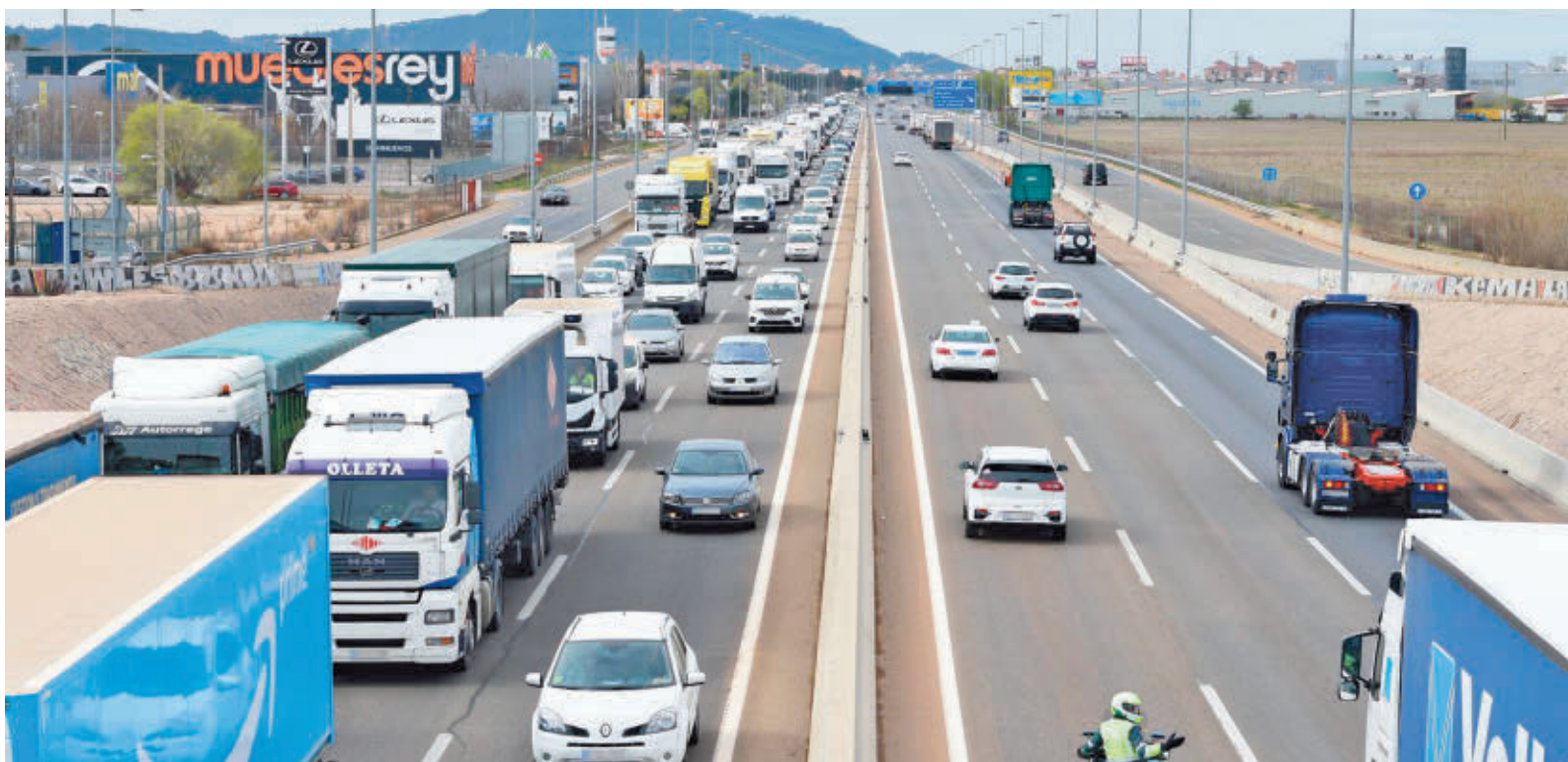
El informe de Fundación Línea Directa revela malas prácticas al volante