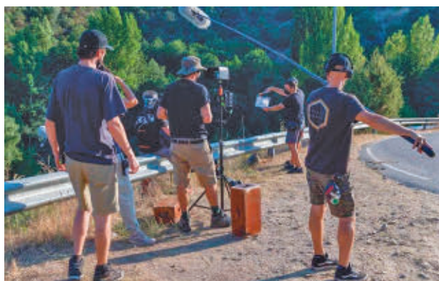
Un rodaje audiovisual en Madrid

Entrando al detalle de los datos publicados, han con-