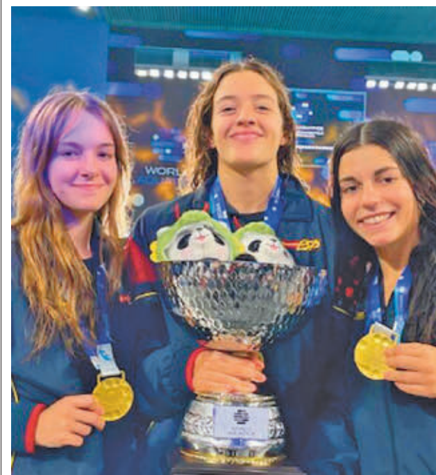
Las tres jugadoras posan con sus medallas y el trofeo

También tendrá que viajar el Sernova Renovables Real Canoe, en su caso, a la pista del Estepona Jardín Costa del Sol. El objetivo del club madrileño será amarrar cuanto antes la permanencia para no pasar apuros y, por qué no, acercarse a los puestos de 'play-off' de ascenso.