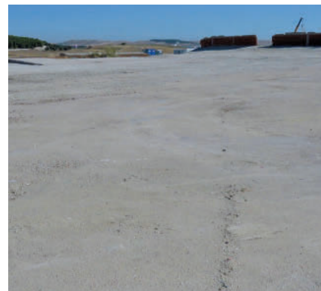
Los terrenos en estos momentos ECOLOGISTAS EN ACCIÓN

Respecto a la prevista restauración de la cubierta vege-