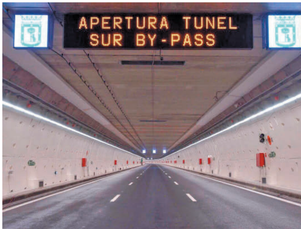
Uno de los túneles de la M-30

DARÁ SERVICIO A LOS USUARIOS DE LA APLICACIÓN WAZE Y DE GOOGLE MAPS