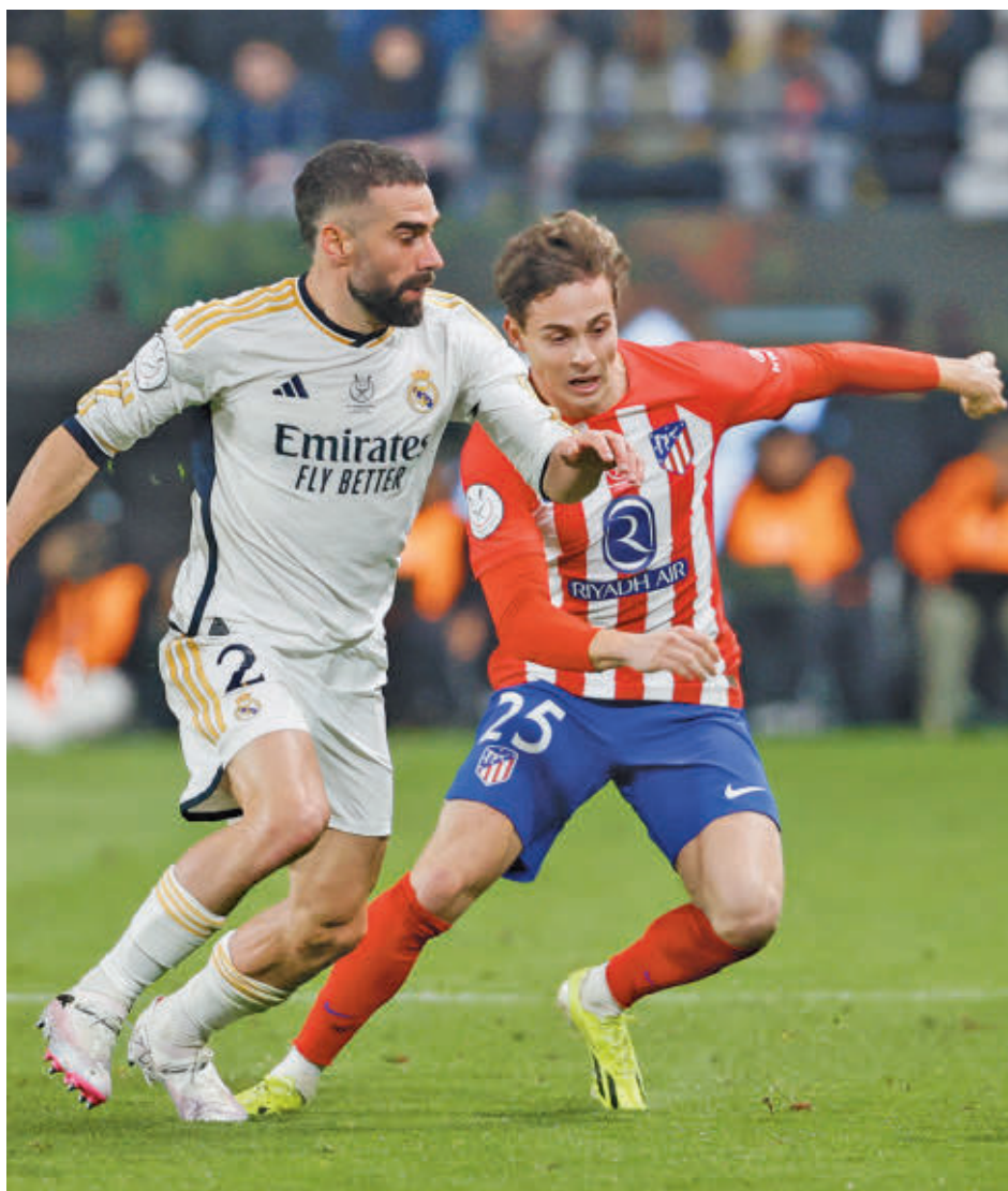
La Supercopa de España deparó otro derbi la pasada temporada

En lo estrictamente deportivo hay un aspecto a tener en cuenta: en una temporada tan exitosa como la anterior, el Real Madrid solo hincó la rodilla en dos ocasiones, ambas en el Metropolitano. En