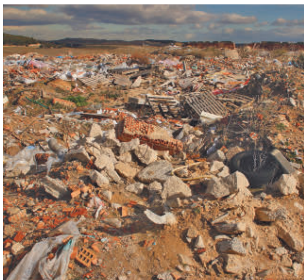
Estado que presentaba la parcela ECOLOGISTAS EN ACCIÓN

El asunto llegó hasta el punto de que la Comisión Europea incluyó Los Blancares