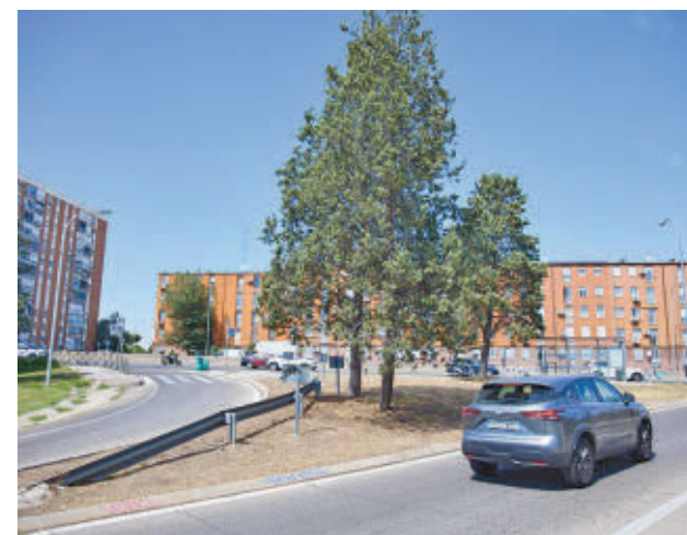
Una de las incorporaciones a la A-5

Por otro lado, destacó que se está terminando de confirmar que los edificios no tienen daños estructurales ni que sufren ningún tipo de daño durante las obras, entrando a los domicilios.