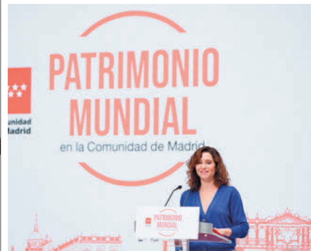
Díaz Ayuso, durante la presentación de la campaña