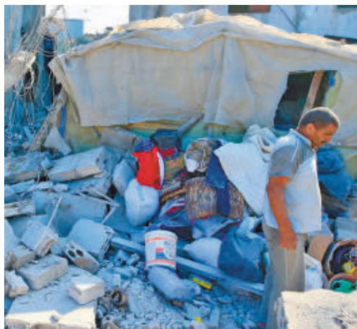
Imagen de uno de los bombardeos en Líbano

EL PERIÓDICO GENTE NO SE RESPONSABILIZA NI SE IDENTIFICA CON LAS OPINIONES QUE SUS LECTORES Y COLABORADORES EXPONGAN EN SUS CARTAS Y ARTÍCULOS