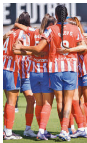
El Atlético goleó en Valencia

Por su parte, el Real Madrid afronta una salida complicada al campo del Akeki Tenerife, un equipo que ha dado algún disgusto a los grandes en las últimas temporadas. El partido se disputará este domingo (19 horas).