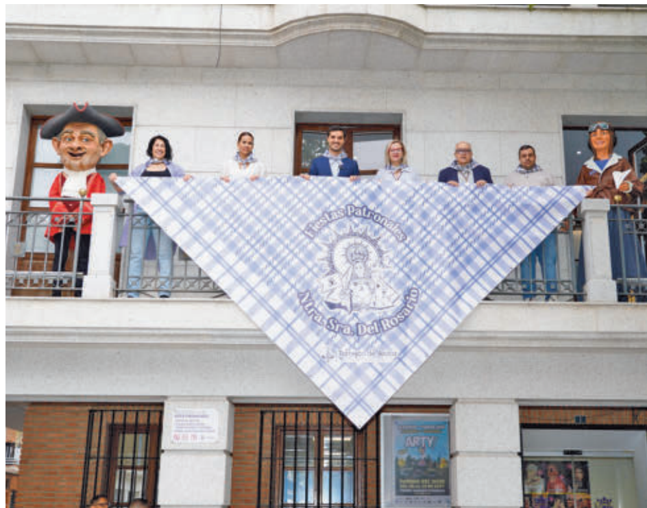
Presentación de las fiestas en el Ayuntamiento

Para complementar la oferta musical, este año se organiza una 'Moonkey Party' dirigida al público más joven