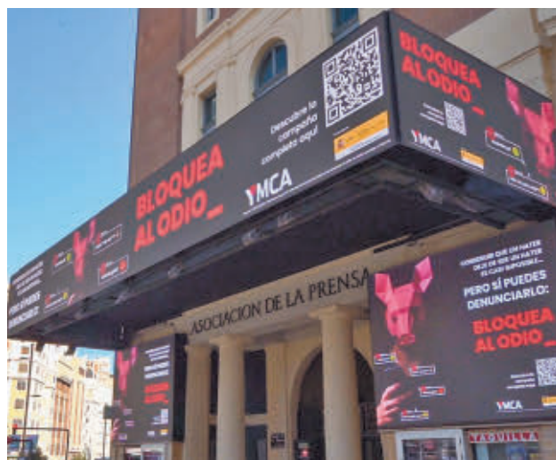
Presentación de la iniciativa