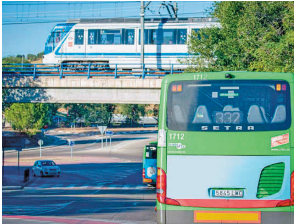
Autobús interurbano en una calle de Rivas.

COSLADA QUIERE QUE LA LÍNEA URBANA 3 SEA CIRCULAR EN AMBOS SENTIDOS