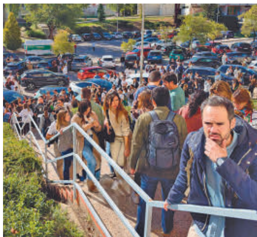
Opositores a RTVE

EL PERIÓDICO GENTE NO SE RESPONSABILIZA NI SE IDENTIFICA CON LAS OPINIONES QUE SUS LECTORES Y COLABORADORES EXPONGAN EN SUS CARTAS Y ARTÍCULOS