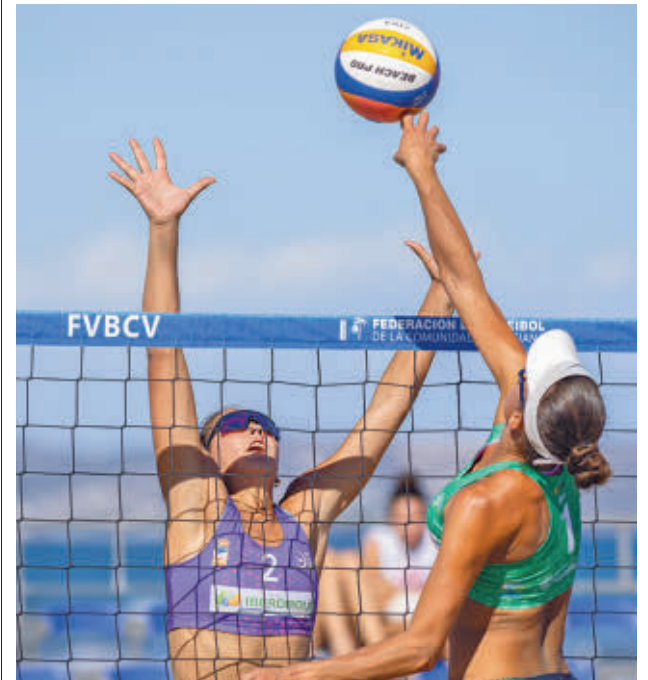
El mejor vóley playa vuelve a la capital

La Copa, que se disputará en primer lugar este fin de semana, contará con las doce mejores parejas masculinas y doce mejores femeninas, mientras que el Villa de Madrid también tendrá a las mejores duplas de la disciplina, que tratarán de cerrar el circuito de la mejor manera posible. Ambas citas tendrán lugar en el Parque Deportivo Puerta de Hierro.