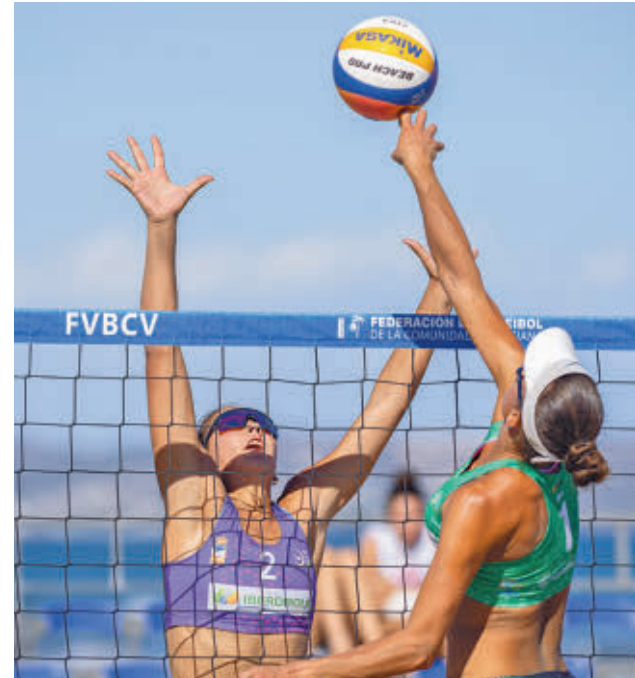
El mejor vóley playa vuelve a la capital

La Copa, que se disputará en primer lugar este fin de semana, contará con las doce mejores parejas masculinas y doce mejores femeninas, mientras que el Villa de Madrid también tendrá a las mejores duplas de la disciplina, que tratarán de cerrar el circuito de la mejor manera posible. Ambas citas tendrán lugar en el Parque Deportivo Puerta de Hierro.