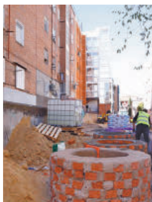
Los trabajos en la zona

Los trabajos contemplan, entre otras actuaciones, el desvío de infraestructuras y servicios soterrados, nuevas