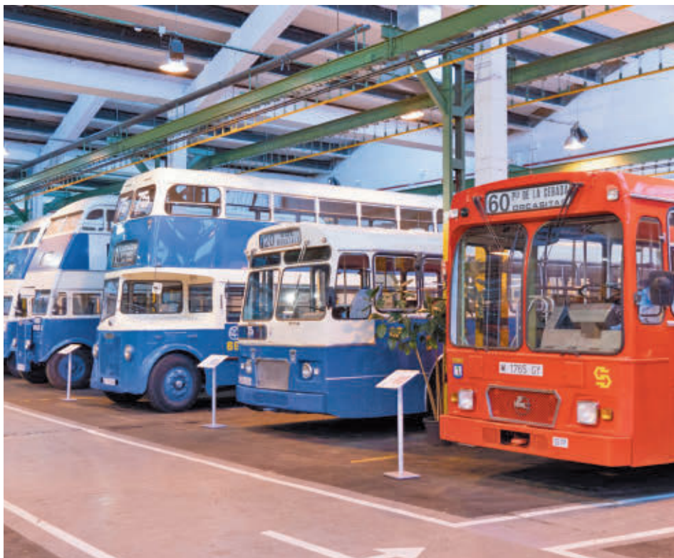
Varios de los vehículos urbanos que forman parte de la historia de la capital

ALBERGARÁ TODO EL PATRIMONIO HISTÓRICO DE LA EMPRESA