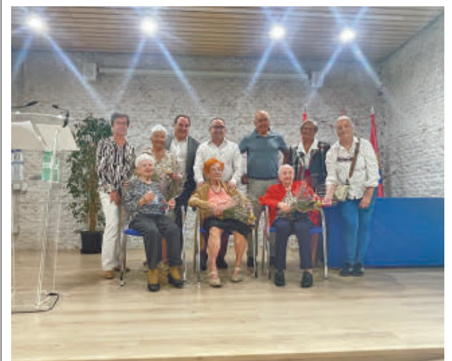
Foto de familia de los vecinos con las autoridades

Toda la actualidad de los distritos de Madrid, en nuestra web