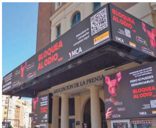
Presentación de la iniciativa