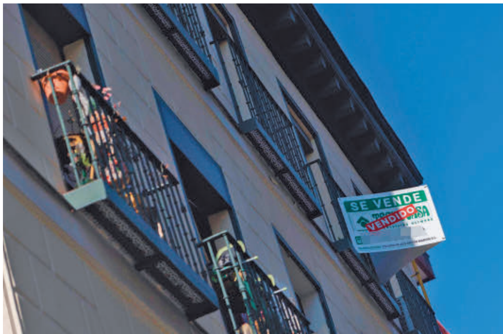
Vivienda en venta en la Comunidad de Madrid

Por comunidades autónomas, cinco de las 17 registran incrementos con respecto al mismo periodo del año pasado, siendo el aumento más destacado el de Islas Baleares, con un incremento muy próximo al 10% interanual. El