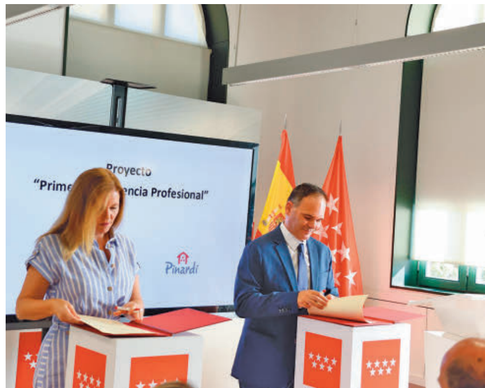
Firma del convenio entre la Comunidad y Pinardi

La Comunidad de Madrid renueva el convenio del Programa Primera Experiencia Profesional • Ofrece la posibilidad de encontrar un trabajo a jóvenes en situación vulnerable