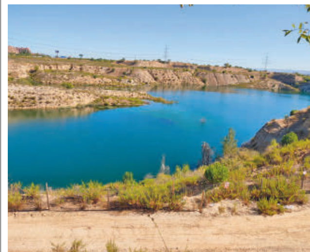
El entorno natural situado en el distrito de Vicálvaro

gentedigital.es Toda la actualidad de los distritos de Madrid, en nuestra web