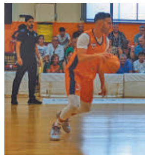
Partido en Morón

La División de Honor Oro femenina de balonmano se inicia este fin de semana con una visita del Ikasa BM Madrid a la cancha del Wise Anaitasuna. Será este domingo a las 13 horas.