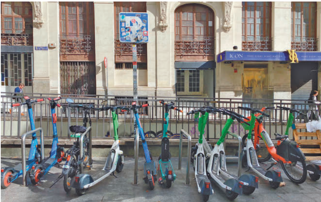
Uno de los aparcamientos de bicicletas, meses atrás, tomado por patinetes y bicis privadas de alquiler PEDALIBRE