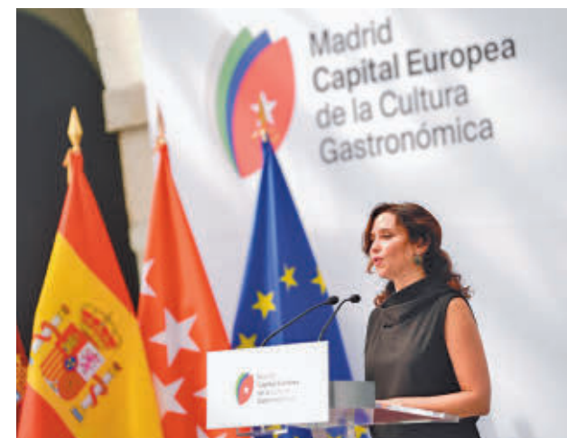
Isabel Díaz Ayuso

"No se trata de que se abra o se cierre antes ni de imponer horario alguno, sino de atender a las costumbres de turistas internacionales en la región", apuntó.