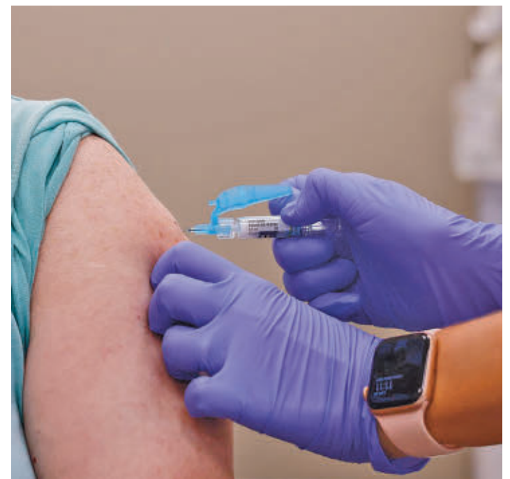
Comienza la campaña contra la gripe en Madrid

A todo ello se suma la inmunización frente al virus respiratorio sincitial (VRS),