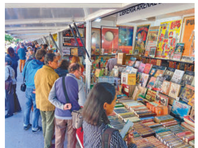
Varios visitantes en una de las casetas @FLIBROVIEJOMAD

Además, habrá un espacio donde los más pequeños podrán mostrar su creatividad, coloreando los dos últimos carteles de la feria, y ganar un regalo, previo sorteo.