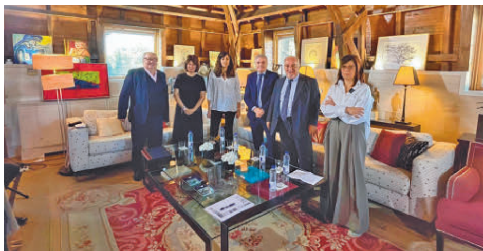
Acto en el que se realizaron las declaraciones

Navarro argumentó que, tras hacer una "medición" sobre el estado del tráfico, se constató que en "el 80% de