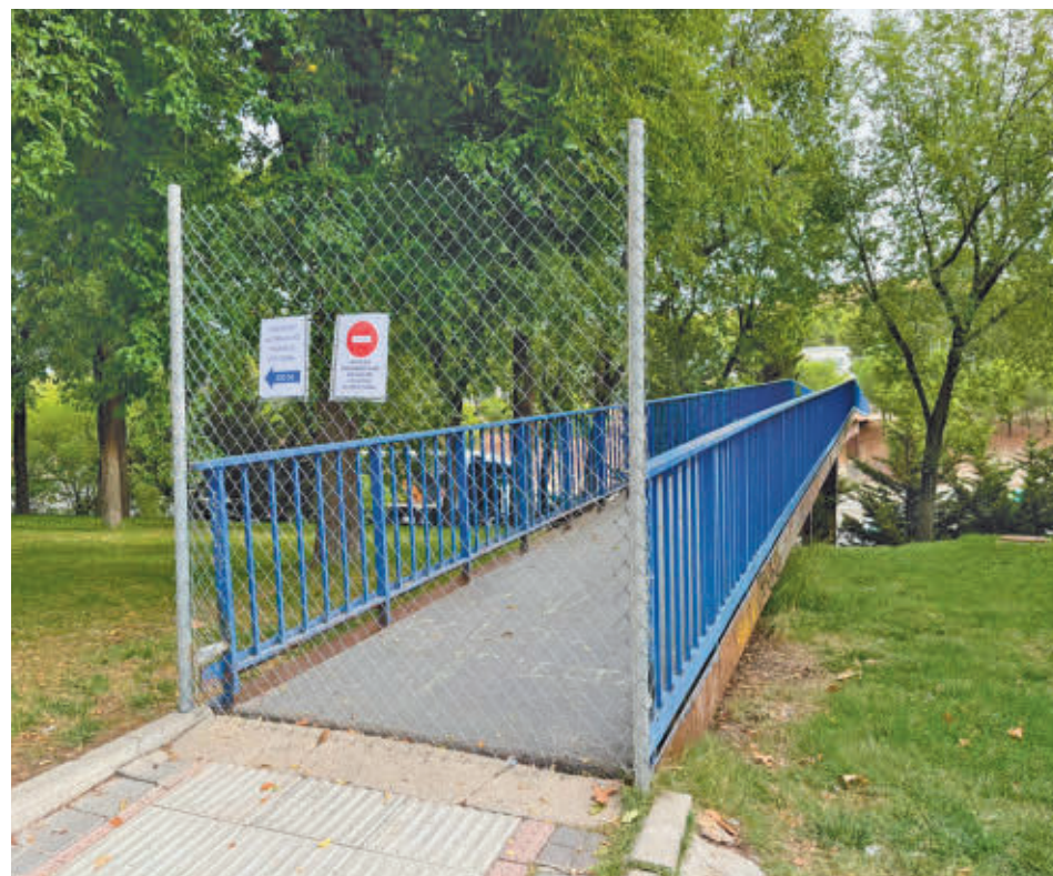
La entrada clausurada de una de las pasarelas sobre la A-3

Además, advierten que esta actividad complica la destrucción completa de los ecosistemas actuales y el vaciado de la laguna existente. “Puede provocar la emisión de gases tóxicos que afectan negativamente a la fauna local y alteran los hábitats. Además, impacta negativamente en el estado ecológico y químico de las aguas superficiales y subterráneas. La falta de controles adecuados para prevenir vertidos tóxicos representa un riesgo significativo para estos recursos”, concluyen.