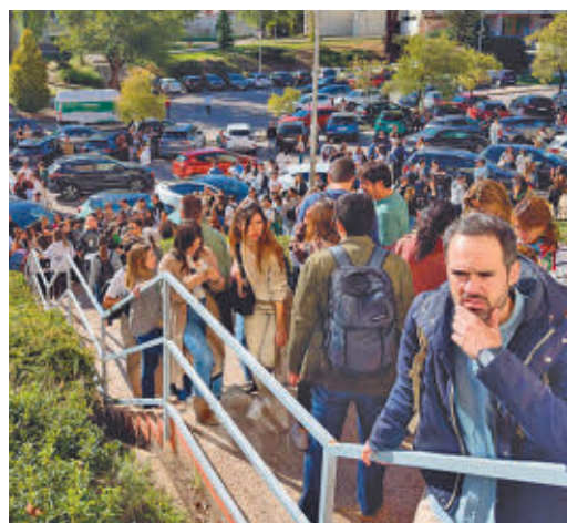
Opositores a RTVE

EL PERIÓDICO GENTE NO SE RESPONSABILIZA NI SE IDENTIFICA CON LAS OPINIONES QUE SUS LECTORES Y COLABORADORES EXPONGAN EN SUS CARTAS Y ARTÍCULOS