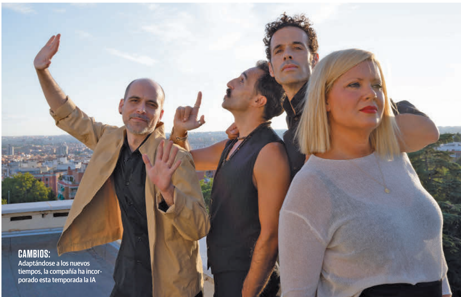
CAMBIOS: Adaptándose a los nuevos tiempos, la compañía ha incorporado esta temporada la IA

"HAY UNA PAREJA QUE VIENE TODOS LOS FINES DE SEMANA, TODOS, SIN EXCEPCIÓN"