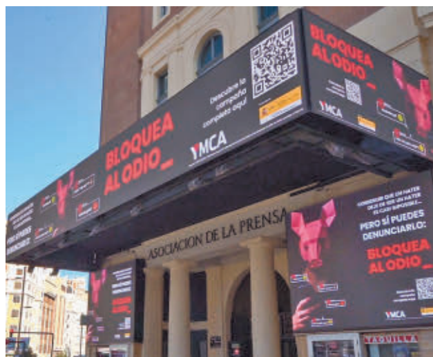
Presentación de la iniciativa