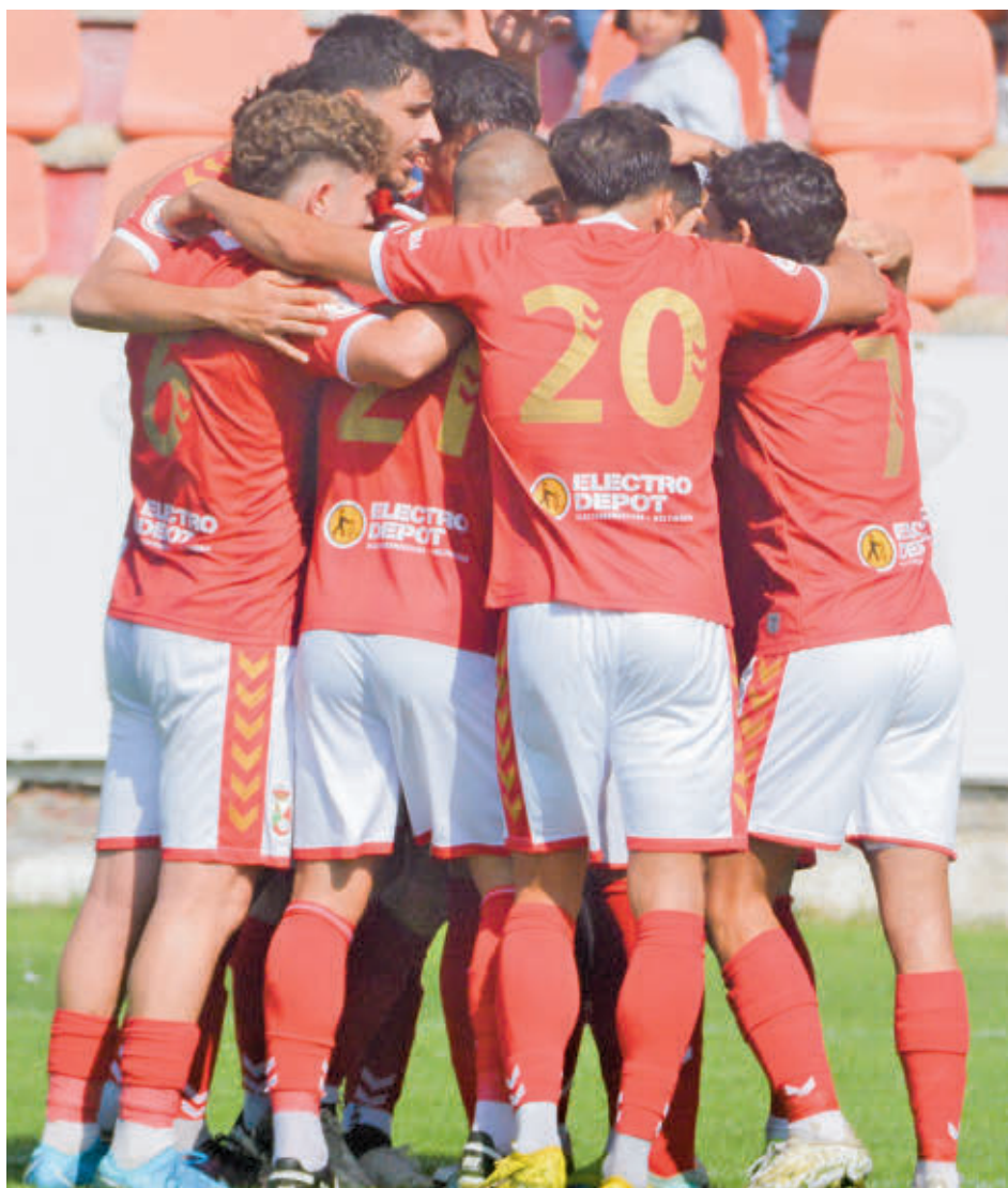
El Alcalá da a su afición motivos para ilusionarse RSD ALCALÁ

En función de lo que pase en este enfrentamiento directo la zona alta de la tabla se podría comprimir un poco más, ya que el tercero en discordia, Las Rozas, podría sacar tajada en el caso de sacar adelante su partido en Navalcarbón (domingo, 12 horas) ante un Villaverde San Andrés que está a solo dos puntos de los roceños. También con 7