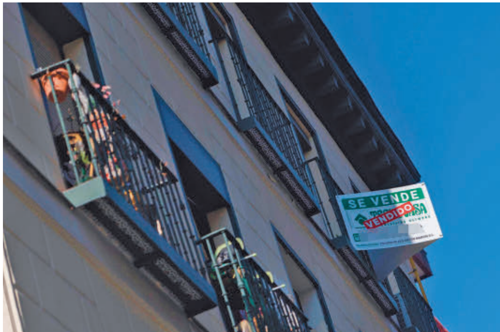
Vivienda en venta en la Comunidad de Madrid

Por comunidades autónomas, cinco de las 17 registran incrementos con respecto al mismo periodo del año pasado, siendo el aumento más destacado el de Islas Baleares, con un incremento muy próximo al 10% interanual. El