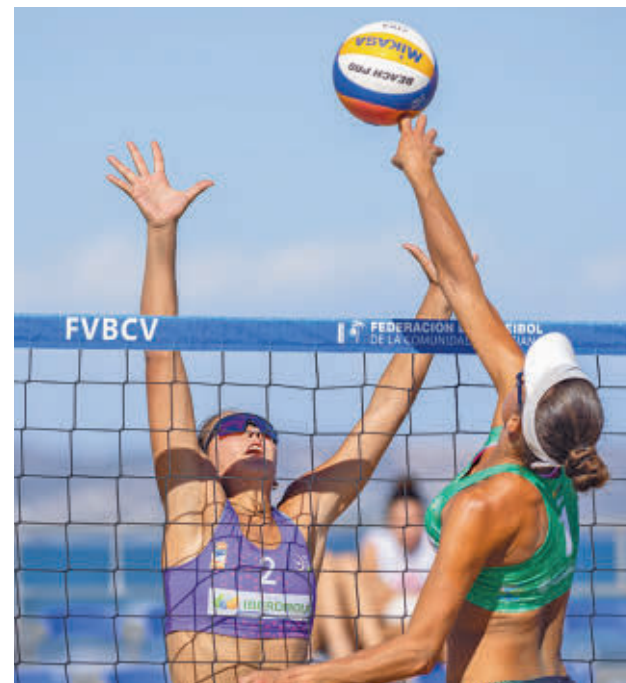
El mejor vóley playa vuelve a la capital

La Copa, que se disputará en primer lugar este fin de semana, contará con las doce mejores parejas masculinas y doce mejores femeninas, mientras que el Villa de Madrid también tendrá a las mejores duplas de la disciplina, que tratarán de cerrar el circuito de la mejor manera posible. Ambas citas tendrán lugar en el Parque Deportivo Puerta de Hierro.