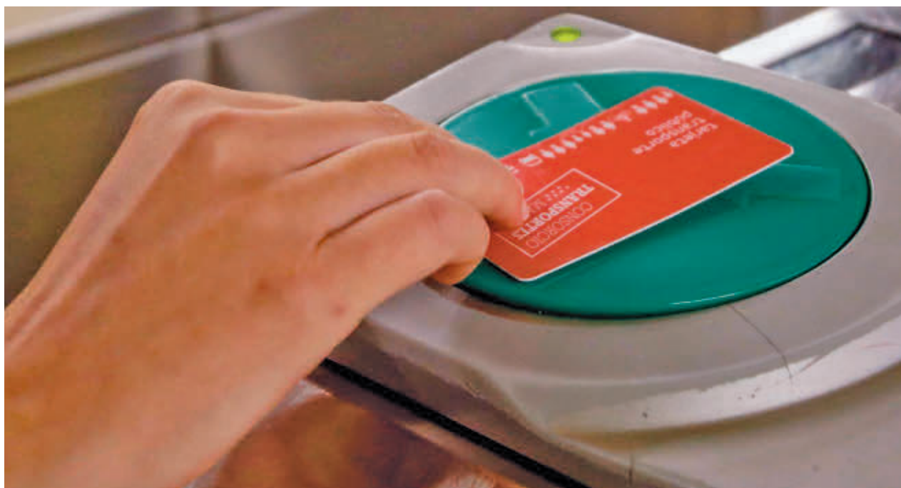
Los usuarios del transporte público han tenido ayudas en los últimos años