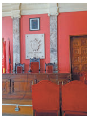
El interior del salón de Plenos

“Algo tan histórico para Vallecas como su antiguo ayuntamiento tiene que se-