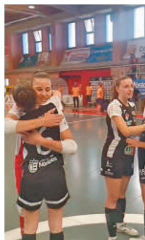
Celebración de la victoria

El MRB-FS Móstoles se impuso 0-2 al Dehesa Villalba, logrando su tercera victoria consecutiva en Segunda B. Con este triunfo, los azulones suman 9 puntos y siguen en la parte alta de la tabla.