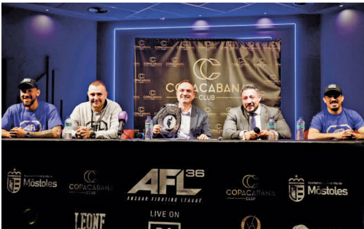
En la presentación del evento, el primer regidor estuvo acompañado de representantes y luchadores de la AFL. AYTO