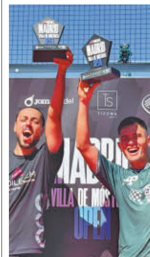
La dupla levanta el trofeo

La MMA abarca varias disciplinas, incluyendo karate, kickboxing, boxeo, muay thai, judo y otras, ofreciendo un espacio para los atletas de diversas trayectorias.