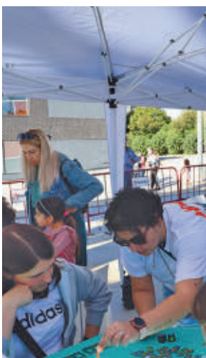
Juegos de mesa del evento