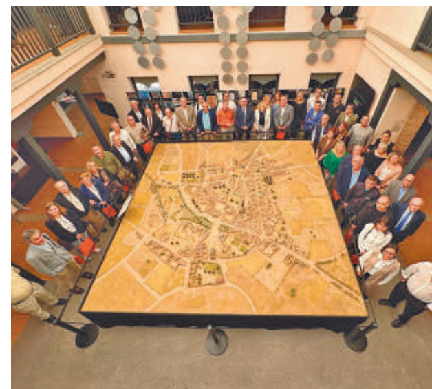
El acto se celebró en el Museo de la Ciudad