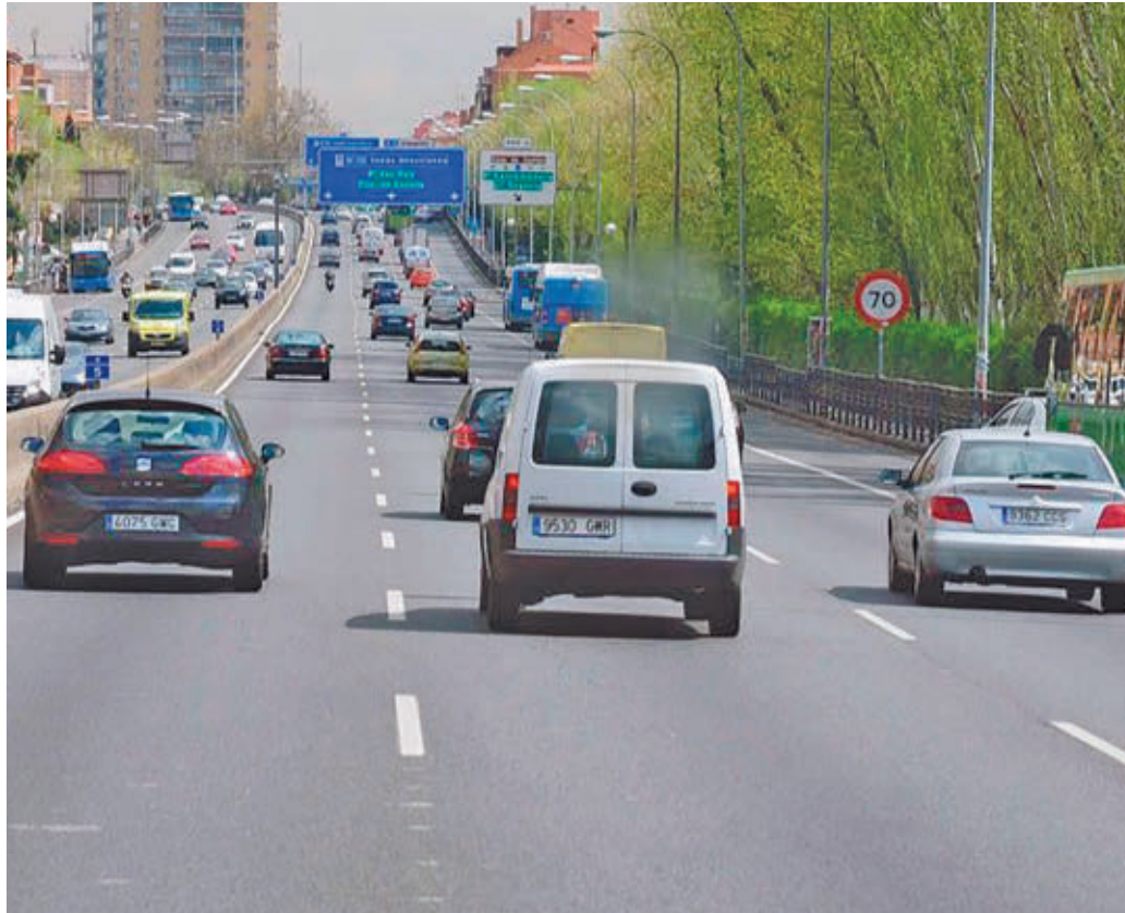
Las obras de soterramiento de la A-5 dejarán dos carriles abiertos por sentido

“Empezamos por Móstoles, tenemos la reunión, y, desde luego, nosotros estamos dispuestos a mantener reuniones con cualquier alcalde y cualquier ayunta-