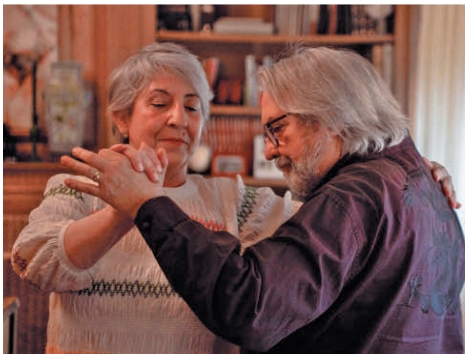
La obra 'Los que bailaban' de Amaya Galeote nació al ver a sus padres bailando

También el sábado, la compañía de teatro Noviempre, dirigida por Eduardo Vasco, presentará 'Las locuras por el veraneo' a las 20 horas