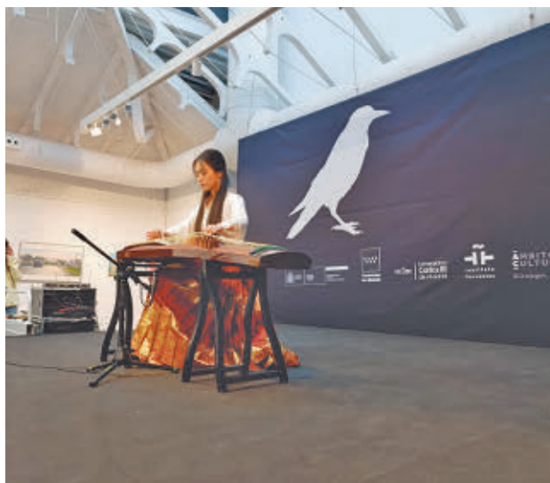
China será este año el país invitado a la XVII edición GENTE

ciativas relacionadas con la temática. El municipio se convierte así en la principal sede del género, aunque alguna actividad se celebrará en Madrid capital. Este año, el festival de "vocación internacional e integradora", celebra ya su decimoséptima edición en la que la gran protagonista será la novela china, recuperando el concepto de la