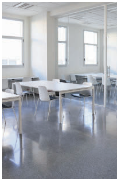
Contar  con al menos 50 plazas

Los estudiantes getafenses contar n con una nueva sala de estudio, con unas 50 plazas, en el entorno de la biblioteca Jorge Luis Borges de Sector III. En concreto, el Ayuntamiento habilitar  los espacios que hasta ahora utilizaba la biblioteca C sar Navarro, que est  siendo trasladada a su nueva 'Casa Museo'. "Un proyecto a trav s del cual se quiere brindar un espacio m s adecuado a aque-