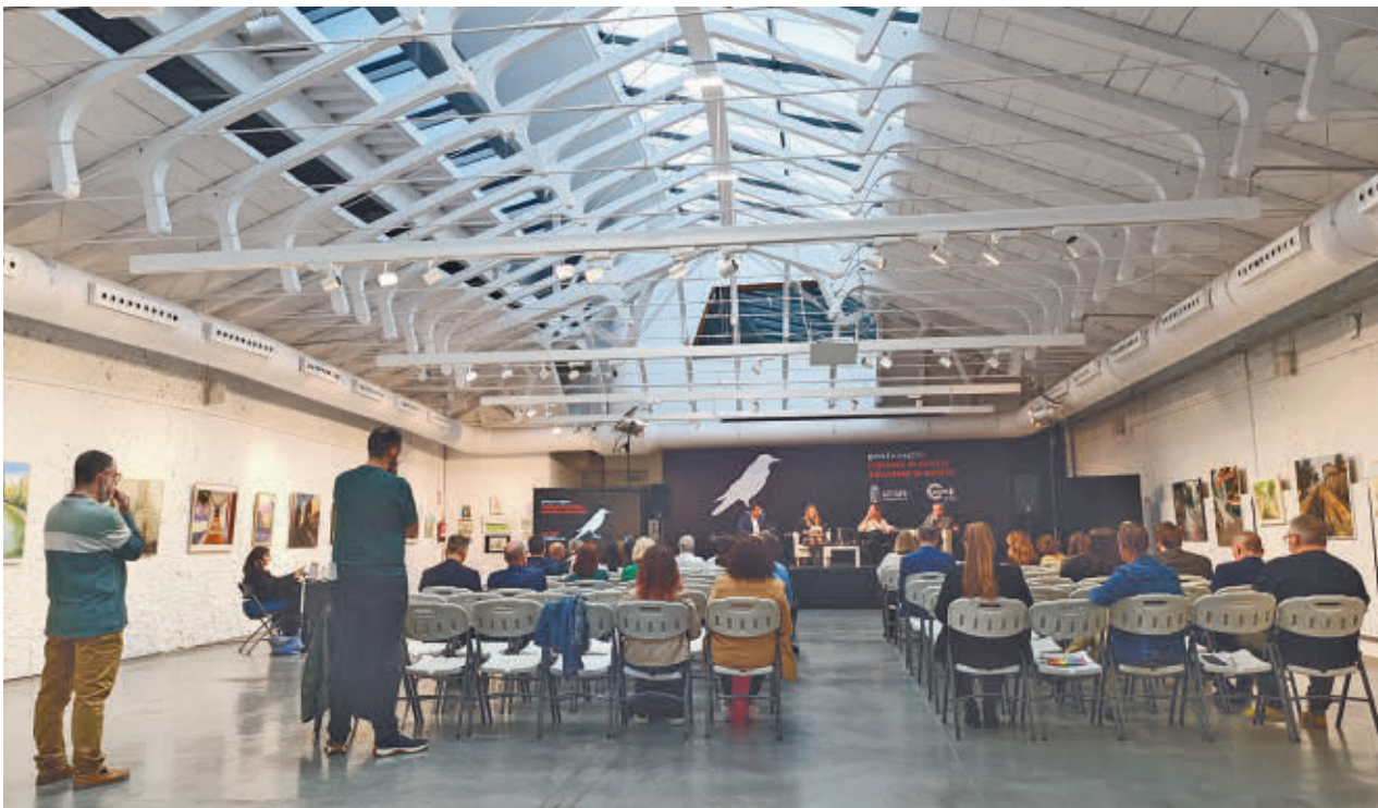
Un momento de la presentación del programa de Getafe Negro GENTE