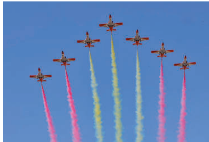
Patrulla Águila: Uno de los momentos más esperados del desfile de este sábado es el vuelo de los aviones de la Patrulla Águila, los encargados de pintar en el cielo de Madrid los colores de la bandera nacional. Esta unidad, formada por siete aviones, cumple ahora cuatro décadas de vida.

do del año pasado, a lo largo del Paseo del Prado y el Paseo de Recoletos. Se trata de un total de 1.540 metros desde la altura de la entrada principal del Jardín Botánico hasta la Plaza de Colón. La tribuna real, en la que los reyes Felipe VI y Letizia disfrutarán de la parada militar acompañados del presidente, Pedro Sánchez, y otras autoridades nacionales, autonómicas y lo-