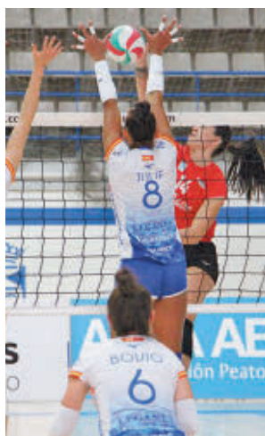
Derbi en el Pabellón Europa

cién descendido como el FEEL Alcobendas visitaba la pista del UC3M Voleibol Leganés, aspirante al ascenso. El resultado final, 3-1, dejó bien