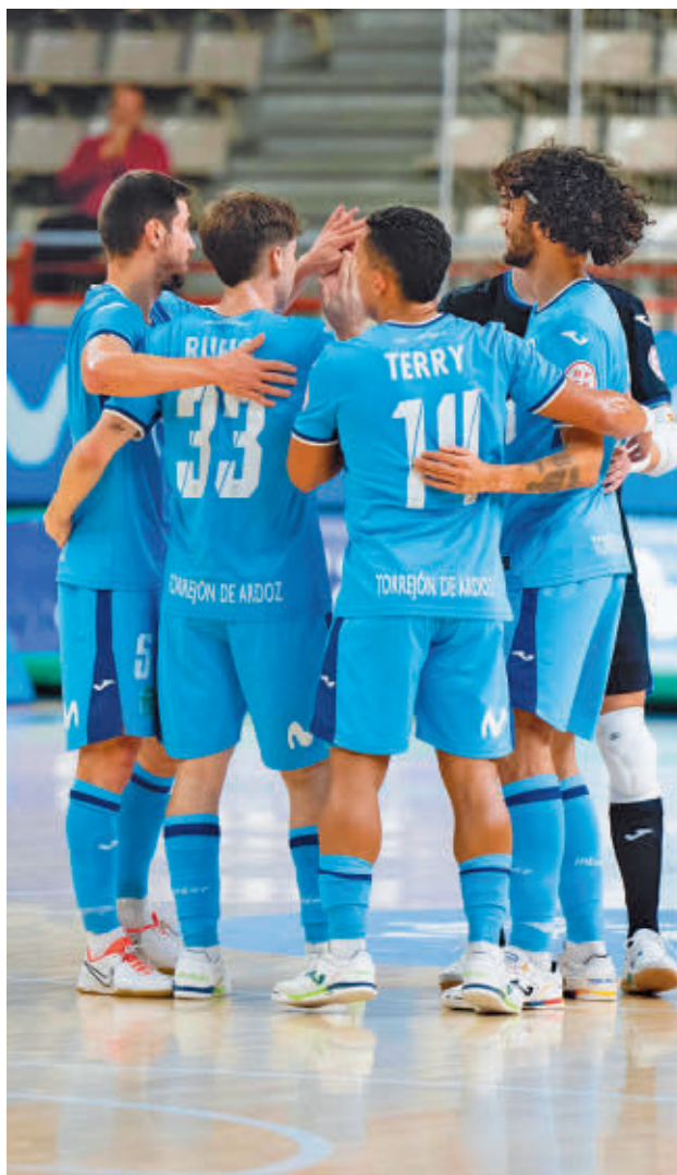
Imagen de un partido amistoso reciente MOVISTAR INTER

Dado el contexto, Movistar Inter estaba llamado a protagonizar una pequeña revo-