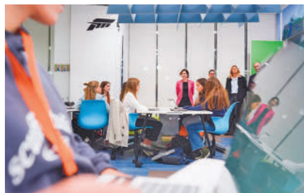
Ayuso visitó la sede de Microsoft

do este martes estos cursos en la sede de Microsoft en Pozuelo de Alarcón, donde ha destacado que Madrid será "la región europea con más personas formadas en esta tecnología". "Queremos, entre otras muchas cosas, que los jóvenes tengan las herramientas y las destrezas nece-