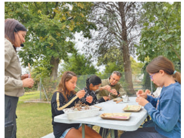
Uno de los talleres de La Isla Forestal

La parte práctica incluirá dos talleres. Uno versará sobre las técnicas para conservar muestras a largo plazo, donde los participantes podrán manejar el material de laboratorio y diferenciar cada especie. En el segundo visitarán un vivero forestal para conocer la flora madrileña y realizarán dos semillados, uno en bandejas y otro en estaquillado, replicando el trabajo profesional.