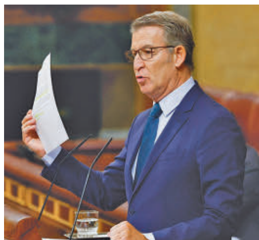
Feijóo, en una comparecencia en el Congreso

EL PERIÓDICO GENTE NO SE RESPONSABILIZA NI SE IDENTIFICA CON LAS OPINIONES QUE SUS LECTORES Y COLABORADORES EXPONGAN EN SUS CARTAS Y ARTÍCULOS