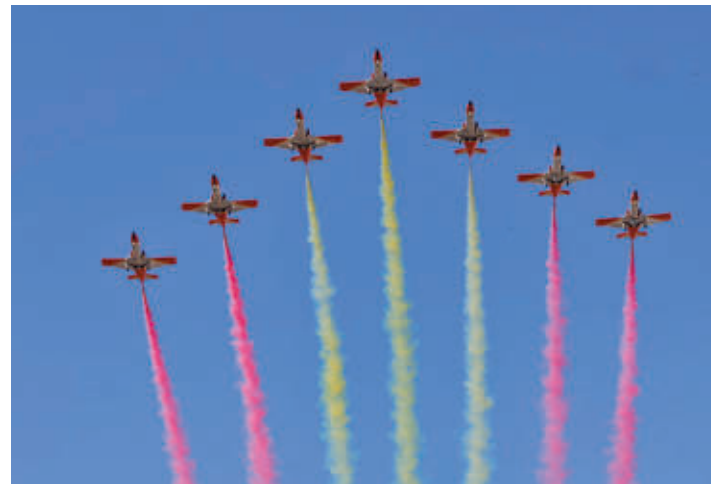
Patrulla Águila: Uno de los momentos más esperados del desfile de este sábado es el vuelo de los aviones de la Patrulla Águila, los encargados de pintar en el cielo de Madrid los colores de la bandera nacional. Esta unidad, formada por siete aviones, cumple ahora cuatro décadas de vida.

do del año pasado, a lo largo del Paseo del Prado y el Paseo de Recoletos. Se trata de un total de 1.540 metros desde la altura de la entrada principal del Jardín Botánico hasta la Plaza de Colón. La tribuna real, en la que los reyes Felipe VI y Letizia disfrutarán de la parada militar acompañados del presidente, Pedro Sánchez, y otras autoridades nacionales, autonómicas y lo-