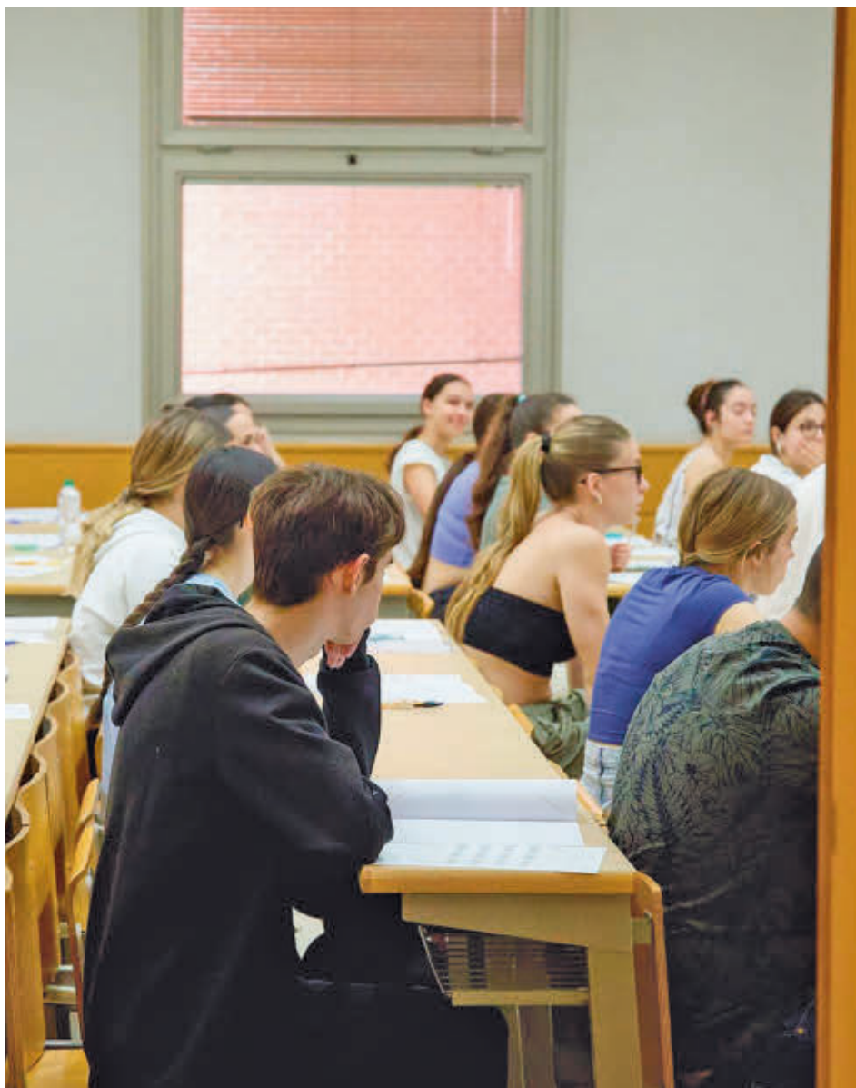
Alumnos haciendo la EVAU en Madrid

Unos días antes de conocerse la fecha de la publicación de los modelos, Sindicato de Estudiantes había convocado una huelga para este viernes 11 de octubre en Educación Secundaria Obligatoria, Bachillerato y Formación Profesional para protestar por el retraso de las administraciones. "Los alumnos de segundo de Bachillerato todavía no sabemos cómo van a ser las pruebas. A pesar de que llevamos casi un mes de curso, la única información que tenemos es que los exámenes de la PAU se celebrarán los días 3, 4 y 5 de junio", señalaron.