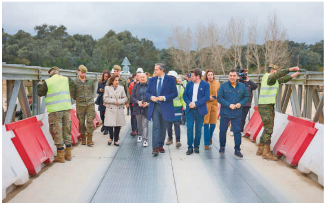
Tareas de reconstrucción de uno de los puentes

La reacción no se hizo esperar. El portavoz del Ejecutivo autonómico, Miguel Ángel García, señaló tras el Consejo de Gobierno que entregaron "toda la documentación" de las inversiones y que, "en coordinación con todos los ayuntamientos", se dio una "respuesta ágil" a todos los destrozos provocados, y ha hecho hincapié en