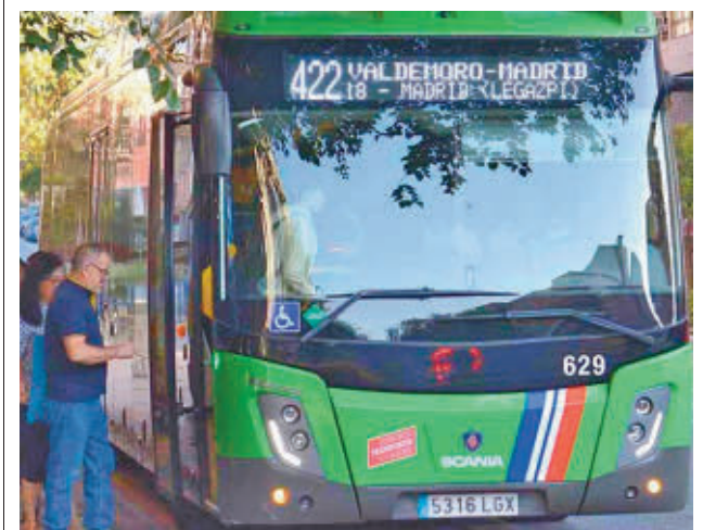
Autobús interurbano de Valdemoro

En esta iniciativa estarán presentes más de 30 expositores de diferentes lugares de España, que pondrán a la venta desde elementos clásicos de hojalata, hasta juguetes. Podrán encontrarse marcas como Rico, Payá, Gepper, Joal o Exin y juguetes como los Juegos Reunidos o el Súper Cine Exin, figuras de acción como los Geyperman o los Madelman, o un amplio repertorio de Airgamboys, clicks de famobil y Lego.