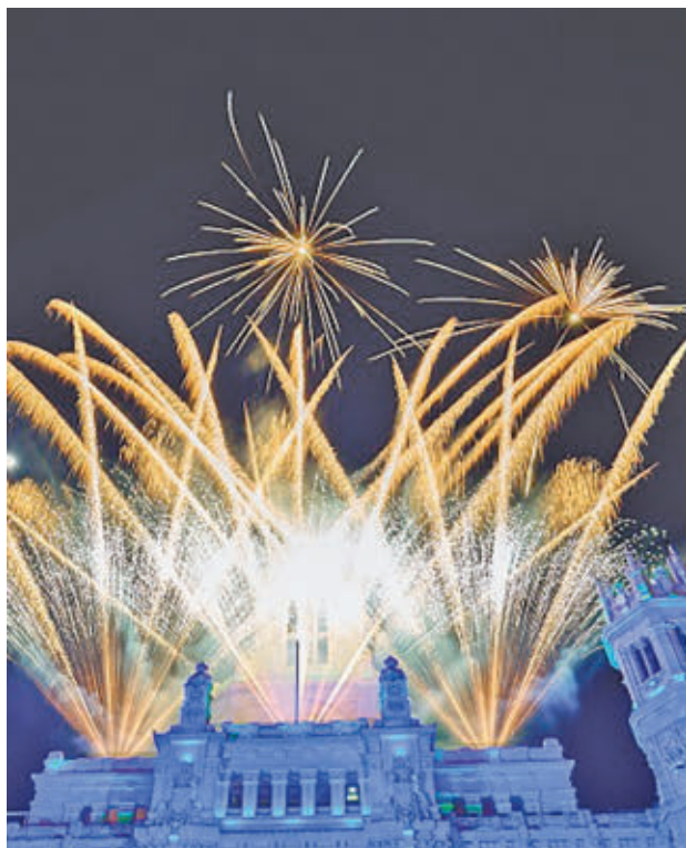
El espectáculo piromusical arrancará a las 21:10 horas

El sábado 12 de octubre será el gran día. La primera de las actuaciones correrá a cargo