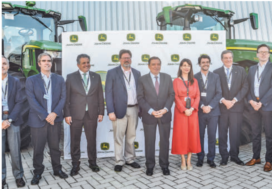
Visita del ministro Planas a John Deere en Parla

El regidor aseguró que empresas como John Deere y las que se instalarán en el futuro desarrollo empresarial serán “decisivas para el presente” del municipio parleño. “Después de varias décadas, este espacio será uno de los más importantes en la Comunidad de Madrid”, ha destacado.