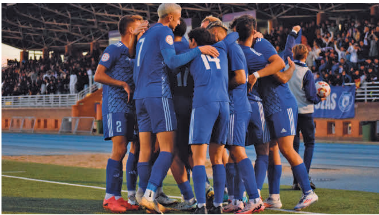
Navalcarbón vibró con su equipo en otra noche histórica para Las Rozas