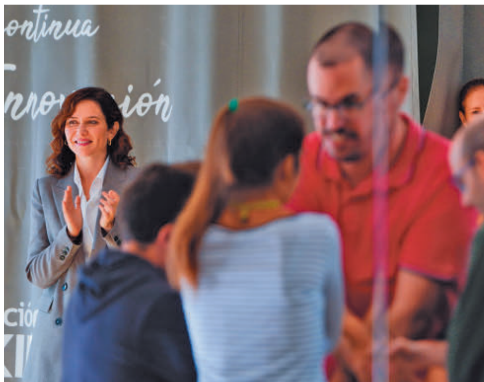
Ayuso, durante la visita a la Fundación Juan XXIII

nas con autismo que estén supervisadas por profesionales para entrenar así sus capacidades. Va a servir como una transición para después emprender una vida independiente”, ha planteado la mandataria autonómica, quien ha apostillado que el objetivo final es que puedan ser “totalmente autónomas”. También se creará un registro de voluntades para que las personas con discapacidad y sus fami-