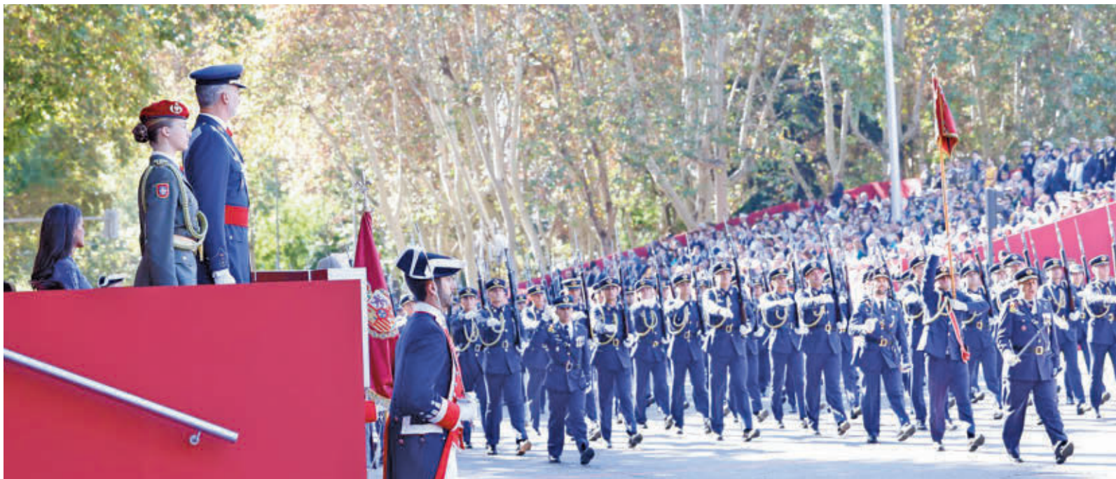
Los reyes y la princesa Leonor contemplan el desfile del año pasado