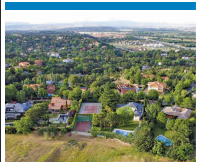
Imagen aérea de la zona donde se iba a ubicar

Los agentes, tras detectar la actividad ilícita, intervinieron rápidamente y capturaron a los responsables en plena acción. Las fotografías de los grafitis realizados han sido aportadas como prueba para formalizar las sanciones correspondientes. La realización de pintadas en la vía pública en Alcobendas tiene una sanción de 1.500 euros y además el pago de la limpieza. Por otro lado, la Policía Local ha aumentado el despliegue de controles de seguridad y de prevención de drogas y alcohol en la localidad.