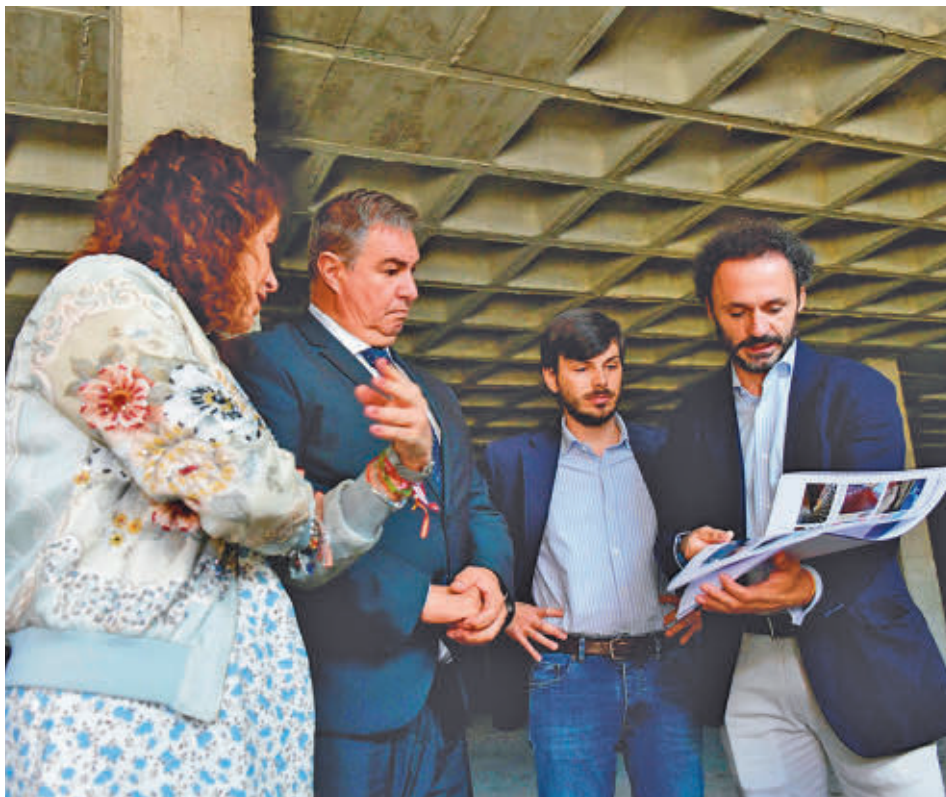
El consejero estuvo acompañado por representantes del Gobierno municipal