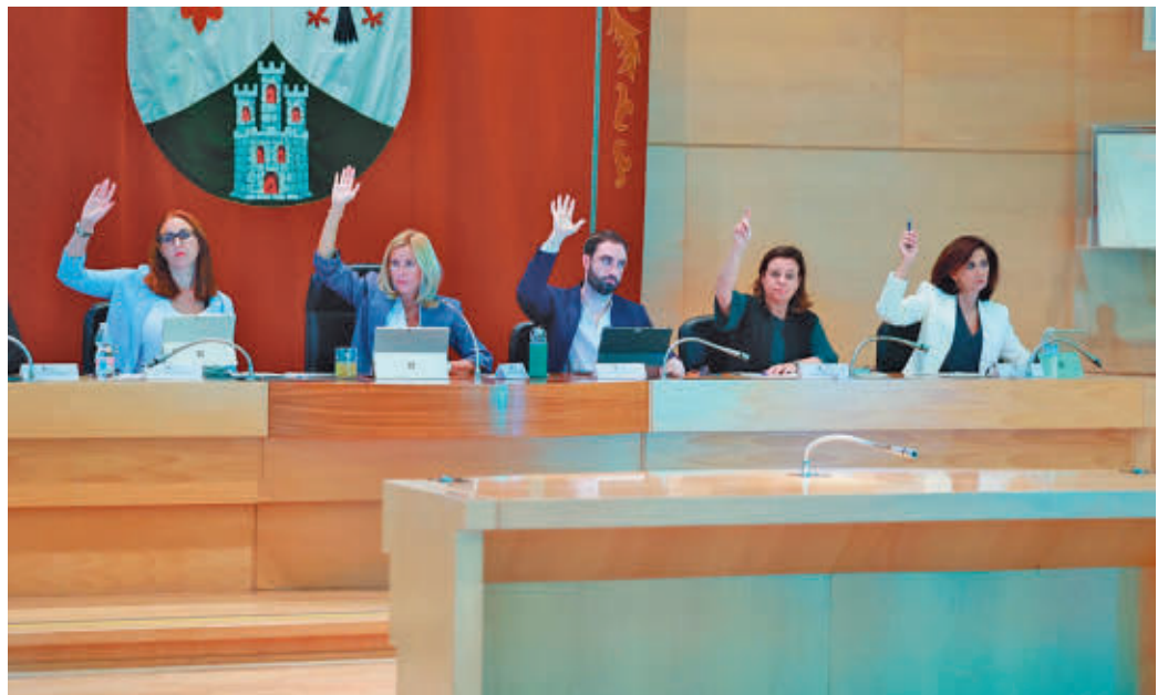
Imagen de archivo de un pleno anterior

Además, se mantiene la rebaja al 29,5% del gravamen que se aplicó para 2024 del Impuesto sobre el Incremento del Valor de los Terrenos de