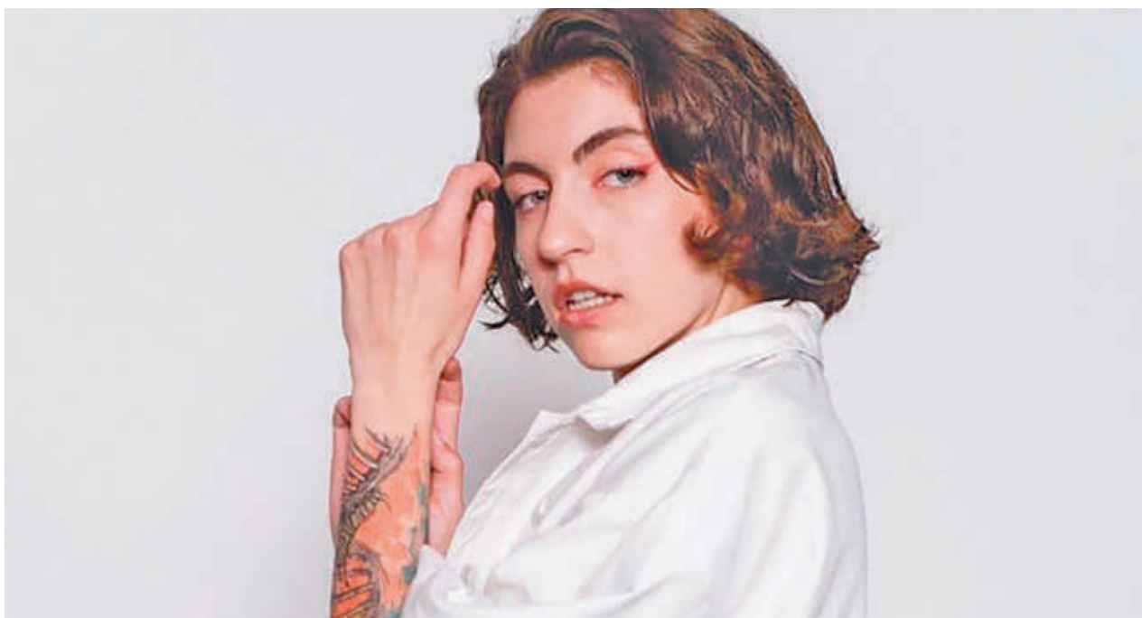
La rapera Sara Socas será una de las artistas del evento