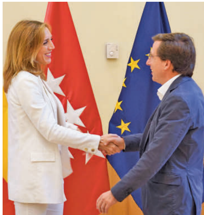
La regidora afirma que han apostado por un trabajo multifactorial

Además, la regidora alcorconera ha señalado que desde el Gobierno local están dispuestos a poner aparcamientos disuasorios a disposición