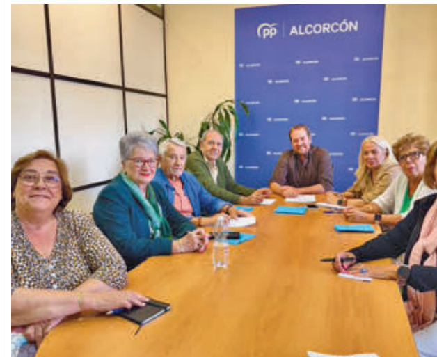
Marín insiste en que es un problema para los mayores

Por su parte, fuentes de la Concejalía de Cultura, Festejos y Mayores han dicho que los trámites para la concesión "ya están en marcha", para que "en la mayor brevedad posible" estos servicios estén activos y así poder dar la mejor atención.