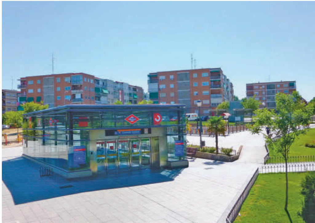
Estación de Metro de Coslada Central

"La situación del tramo del túnel de la línea 7B a su paso por Coslada nada tiene que ver con el tramo de San Fernando de Henares. En Coslada nunca ha sido necesario realizar actuaciones de consolidación del terreno en superficie, ya que nunca se han presentado ningún tipo de deficiencias ni de grietas", recalzó el consejero, que ha insistido en que se trata de "actuaciones programadas de conservación y mantenimiento, igual que las que se ha-