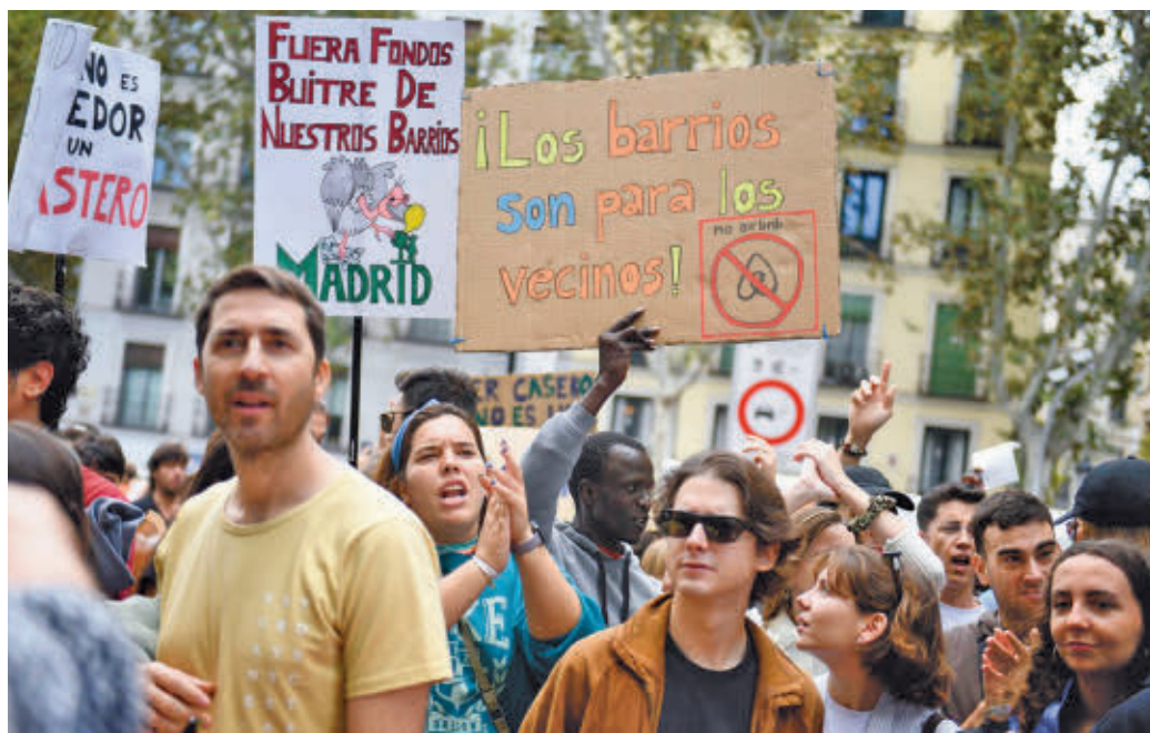
Algunas de las consignas que se pudieron ver en la manifestación

El objetivo de la huelga, según expresa Racu, es bajar los alquileres al 50%. Para ello, piden que la acción se repita en todos los barrios de España,