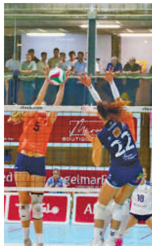
Derrota en Menorca

complicada cancha del Avarca Menorca. El resultado final de 3-1 debe servir, sin embargo, como refuerzo moral para un equipo que porta la eti-