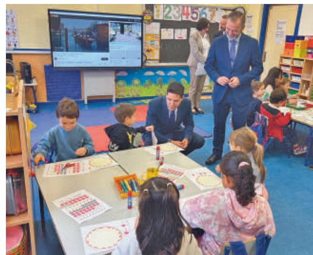
El consejero de Educación visitó un centro