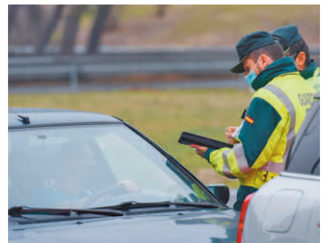
Control de la Guardia Civil

"El alcohol afecta de manera importante a las capacidades psicofísicas y los comportamientos: tiempo de reacción, visión, percepción, coordinación, comisión de infracciones, aumento de las distracciones, la somnolencia y la fatiga, aparte de disminuir gravemente la percepción del riesgo y alterar la toma de decisiones", destaca la iniciativa.