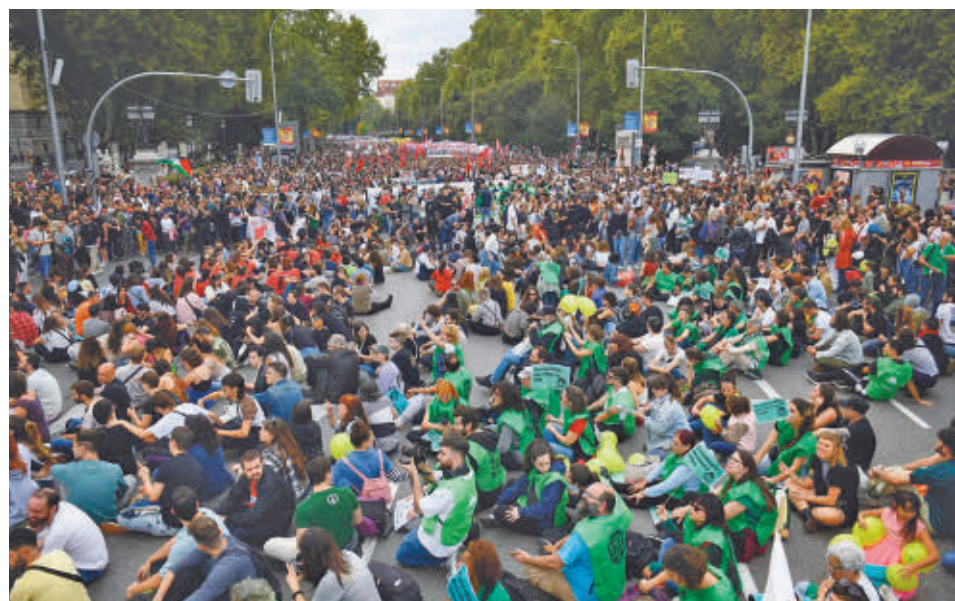
La convocatoria de Madrid fue multitudinaria EUROPA PRESS

animando a organizarse desde esta semana.