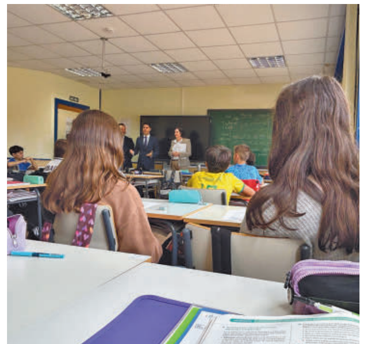
Visita de Viciano a un colegio de Daganzo

Viciano explicó que “hay muchos estudios que avalan esta decisión” y que “es muy beneficioso para el alumnado” poder continuar esos dos años más en el mismo centro. “Otro motivo importante es proteger a los niños, que pasan a los institutos a una edad