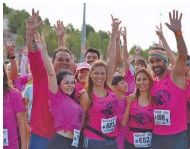
Edición del año pasado

El precio de inscripción es de 15 euros para todas las modalidades, menos la infantil, que solo cuesta 5 euros.