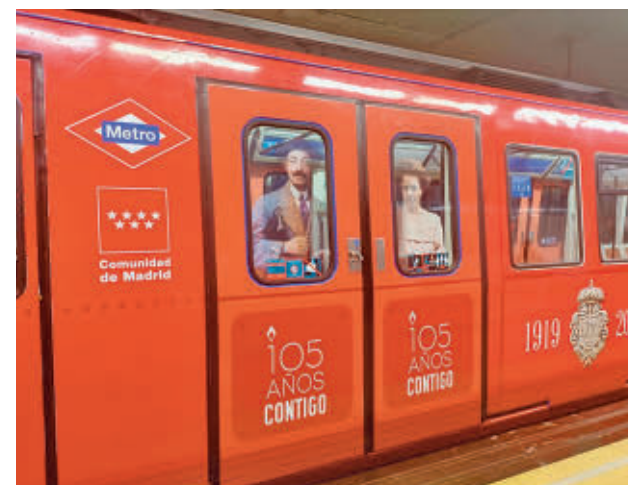
Tren vinilado de la Línea 1

El tren vinilado en su exterior con imágenes de los vagones originales del siglo XX circulará por la Línea 1 (Pinar de Chamartín-Valdecarros) hasta final de año con el objetivo de que todos los madrileños puedan celebrar este importante aniversario para la historia del transporte y la movilidad en la región, con una red de casi 300 kilómetros que conecta 12 municipios madrileños.