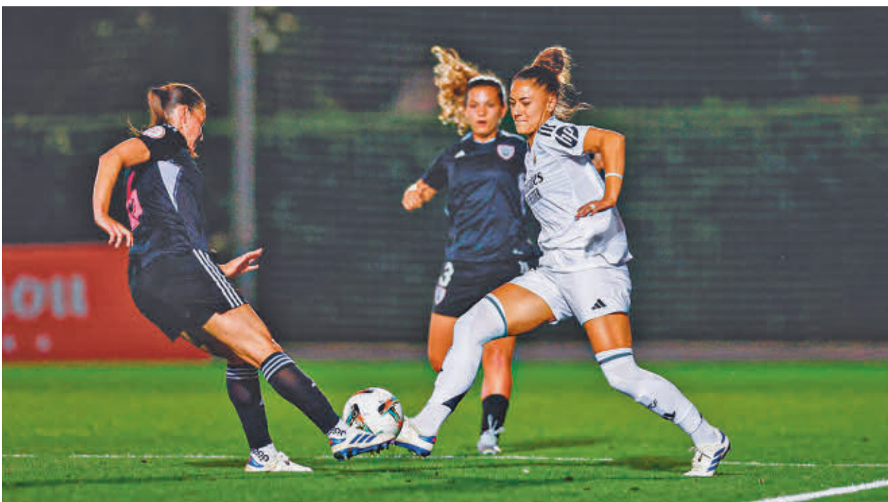
Ambos equipos ya se vieron las caras en un amistoso de la reciente pretemporada, con resultado final de 1-1