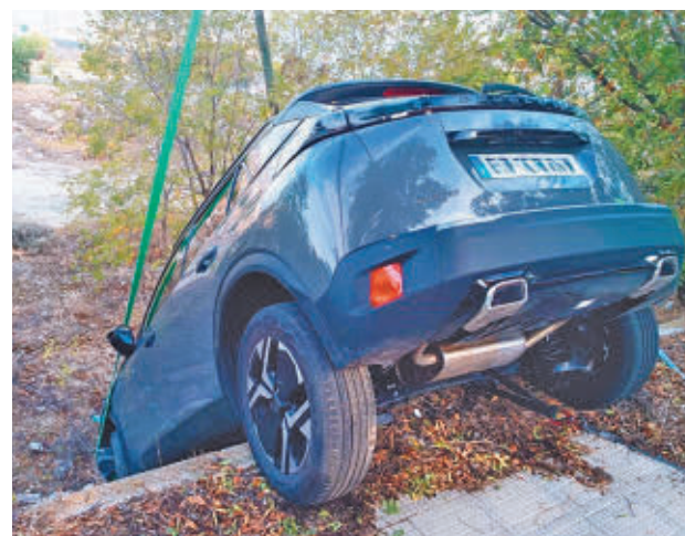
Uno de los vehículos siniestrados

El segundo accidente tuvo lugar en la calle Salustiano Martínez. Un conductor quiso aparcar pero, quizá por un error en los pedales, acabó precipitándose por un terraplén. El único ocupante del vehículo también resultó ileso. "Aunque afortunadamente nadie ha resultado herido, no siempre se tiene la misma suerte. Tu atención salva vidas", ha añadido la Policía Local en sus redes sociales,