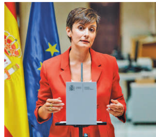
La ministra de Vivienda, Isabel Rodríguez E.P.

Tanto los sindicatos de inquilinos como varios partidos políticos han puesto en duda la eficacia de estas ayudas para paliar el problema de la vivienda. Aseguran que estos bonos solo benefician a los propietarios de las viviendas y que no rebajan el precio de los alquileres.