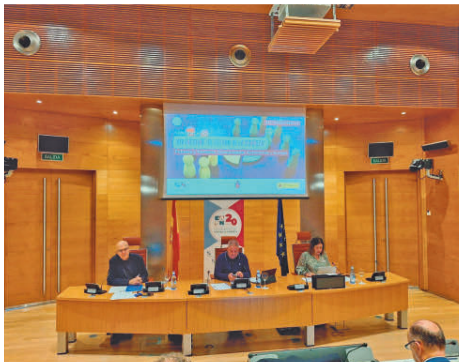
Presentación del informe esta semana en el Senado

La posición de la Comunidad de Madrid es relativamente favorable si se compara con el resto de autonomías, ya que es la tercera con una tasa AROPE más baja, solo por detrás del País Vasco, con un 15,5%, y de Navarra, con un 17,2%. La media nacional se