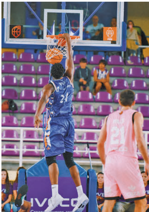
El 'Fuenla' no dio opción al Valladolid FEB

Por su parte, el Movistar Estudiantes estrenó su casillero