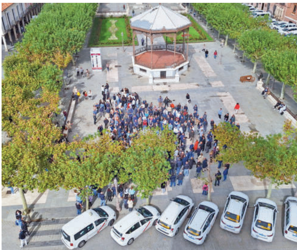
Un momento de la concentración de este jueves 17 en Alcalá de Henares