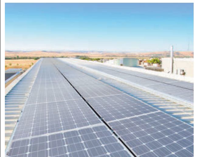
Nuevos paneles solares instalados

gentedigital.es Toda la actualidad de la zona Este, en nuestra página web