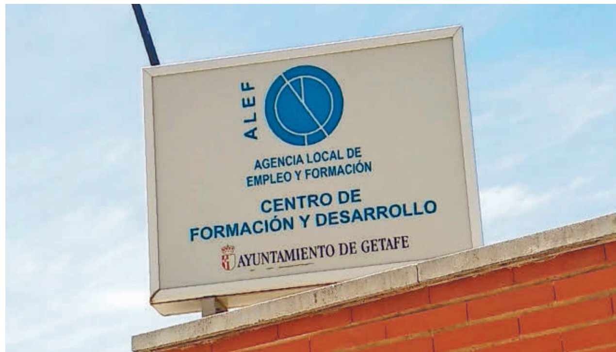
Las cuentas contemplan el incremento de 900.000 de euros para la Agencia Local de Empleo y Formación E.P

gentedigital.es Toda la actualidad de Getafe, en nuestra página web.