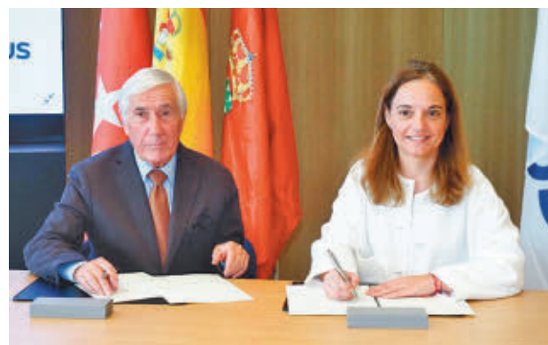
Esta semana se ha formalizado el acuerdo AYTO DE GETAFE

FIO cuenta con 43 aeronaves de 32 modelos diferentes, algunas de las cuales como 'la Bücker', el Súper Saeta o la I-11B fueron fabricadas por Construcciones Aeronáuticas SA (CASA), Hispano Aviación y Aeronáutica Industrial S. A. (AISA), empresas aeronáuticas que marcaron el ori-