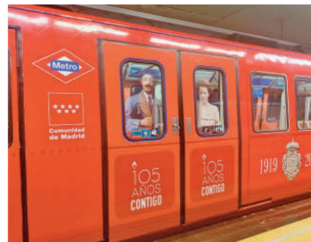
Tren vinilado de la Línea 1

El tren vinilado en su exterior con imágenes de los vagones originales del siglo XX circulará por la Línea 1 (Pinar de Chamartín-Valdecarros) hasta final de año con el objetivo de que todos los madrileños puedan celebrar este importante aniversario para la historia del transporte y la movilidad en la región, con una red de casi 300 kilómetros que conecta 12 municipios madrileños.