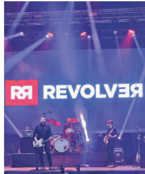
Concierto de Revólver