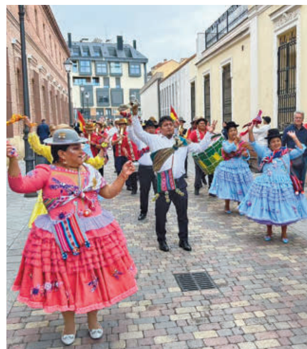
Desfile: Una de las grandes novedades fue el Desfile por el Día de la Hispanidad. Participaron más de mil personas de diferentes agrupaciones de Bolivia, Ecuador, Honduras, Nicaragua, Perú, El Salvador y Venezuela, además de las casas regionales.

“Satisfactorio” El alcalde de Leganés, Miguel Ángel Recuenco, se ha felicitado esta semana por el resultado de los festejos. “Que no haya pasado nada es lo más satisfactorio y, aunque hemos tenido algún día pasado por agua, sí he percibido que los vecinos se lo han pasado en grande con los conciertos y con las actividades de las asociaciones”, señaló el regidor.