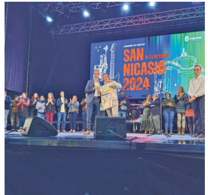
Pregón a cargo del marchador Álvaro Martín