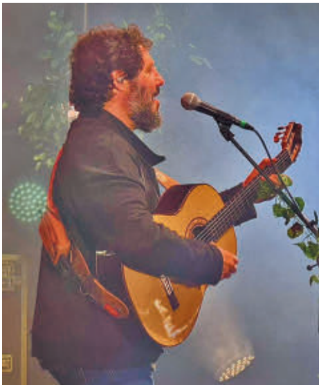
El cantautor malagueño El Kanka