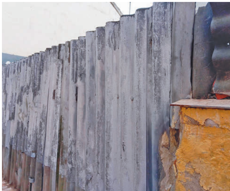
Portón de uralita situado en un solar de Leganés ASOCIACIÓN DE VECINOS BARRIO CENTRO DE LEGANÉS