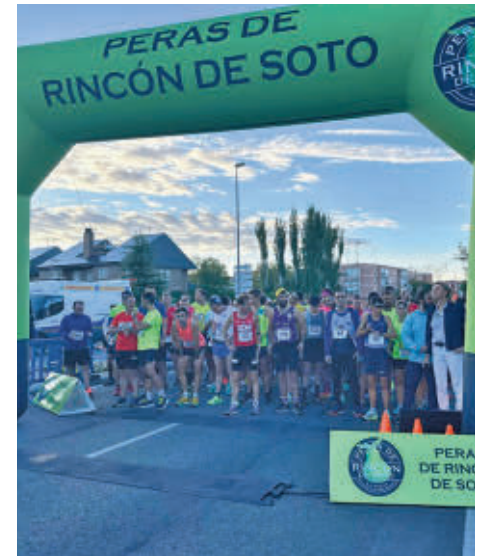
Salida de la carrera popular