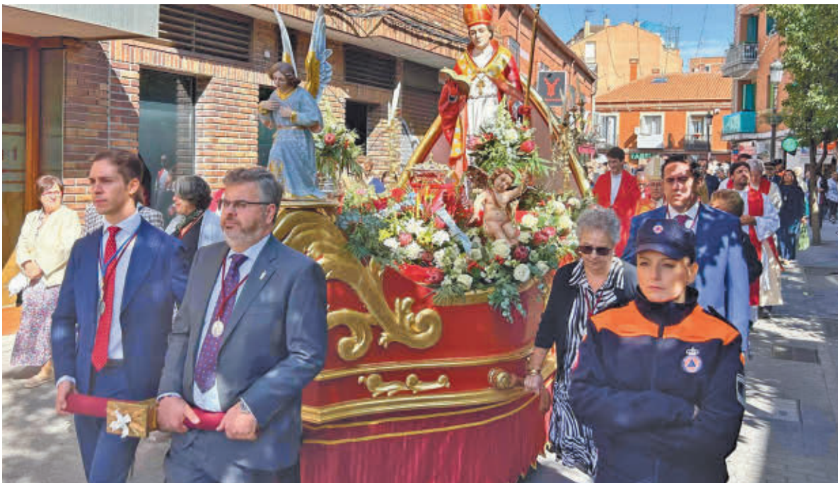
Procesión del santo por las calles del Leganés