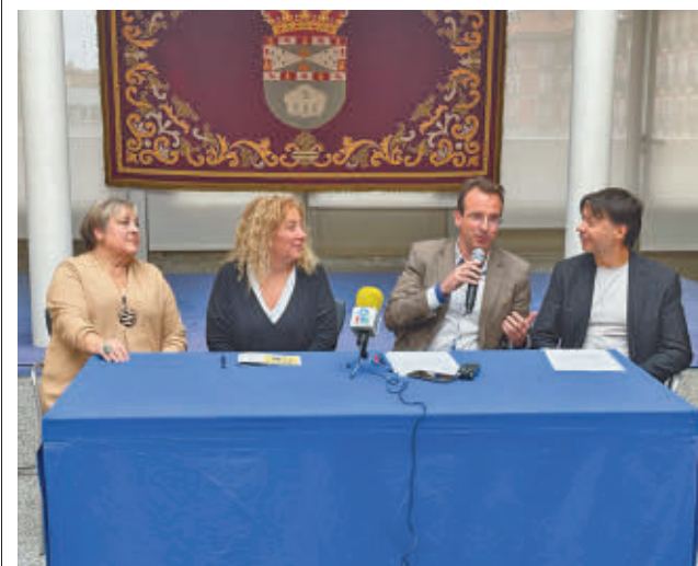
Rueda de prensa en la que se anunció el ganador

gentedigital.es Toda la actualidad de Leganés, en nuestra página web