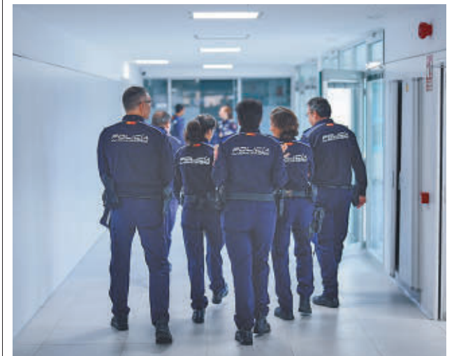
Varios agentes, en el interior de la comisaría municipal

En planta baja se ha realizado una nueva entrada principal, accesible tras eliminar forjados a distinto nivel y otras barreras arquitectónicas, con nuevos espacios de atención al público, además del acondicionamiento de zona de garaje de vehículos policiales. En el resto, se distribuyen todas las comisarías que se están instalando, una mudanza que concluirá a final de año.