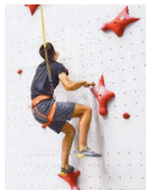
Escaladores de velocidad

Para ello se ha montado un rocódromo cubierto de 17 metros de altura por 12 metros de ancho con de cuatro vías individuales y tendrá el lema 'De Madrid al cielo'.