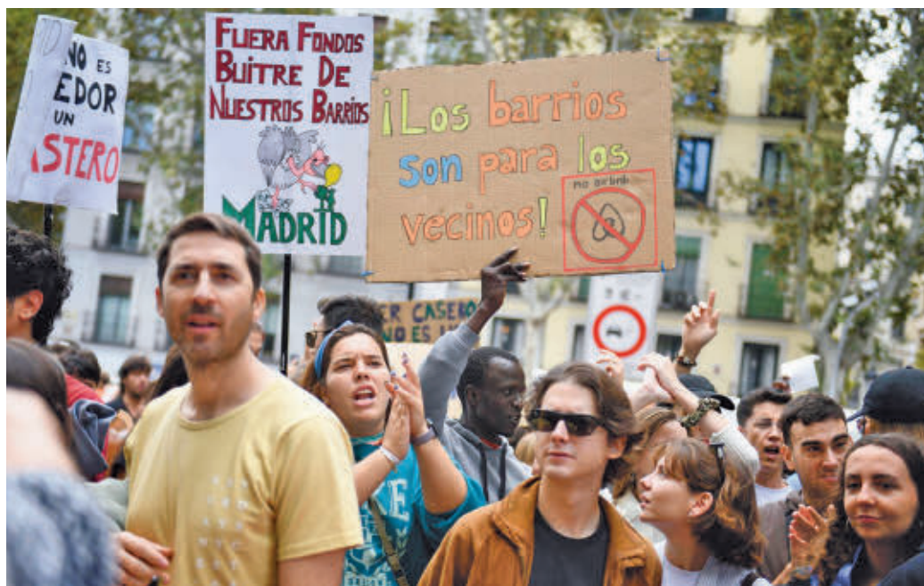
Algunas de las consignas que se pudieron ver en la manifestación

El objetivo de la huelga, según expresa Racu, es bajar los alquileres al 50%. Para ello, piden que la acción se repita en todos los barrios de España,