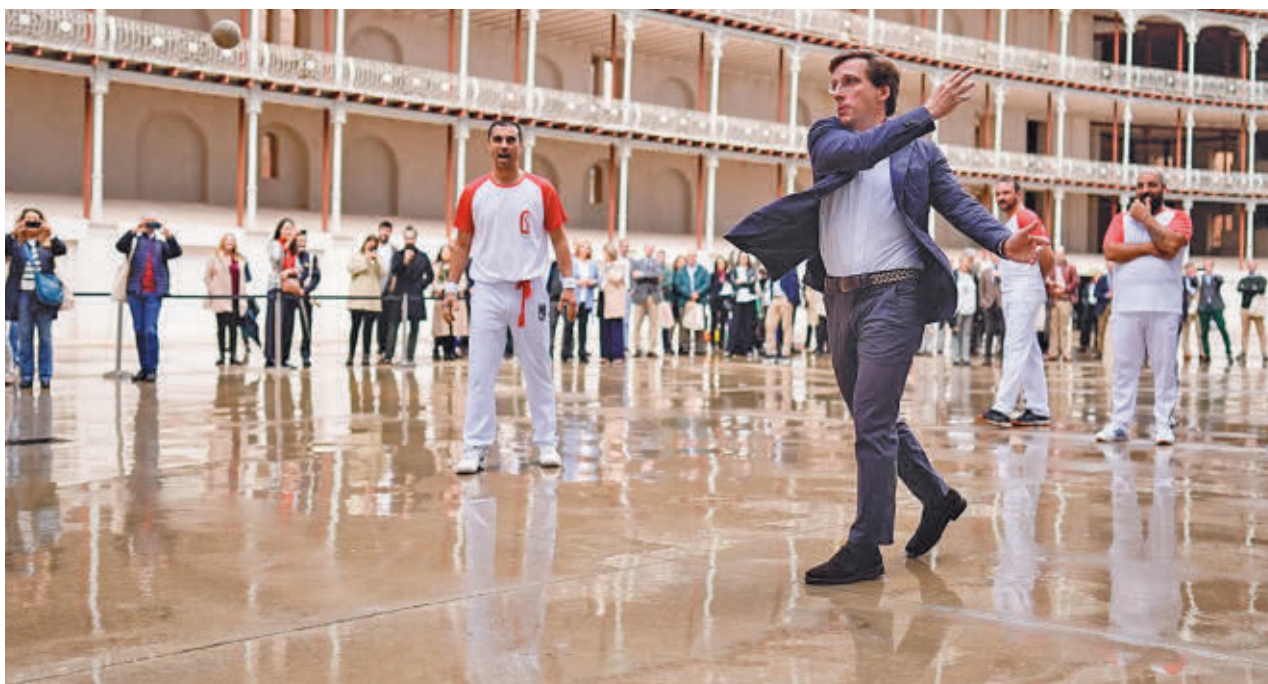
El alcalde de Madrid, José Luis Martínez-Almeida, se animó a practicar la pelota vasca en el acto de inauguración