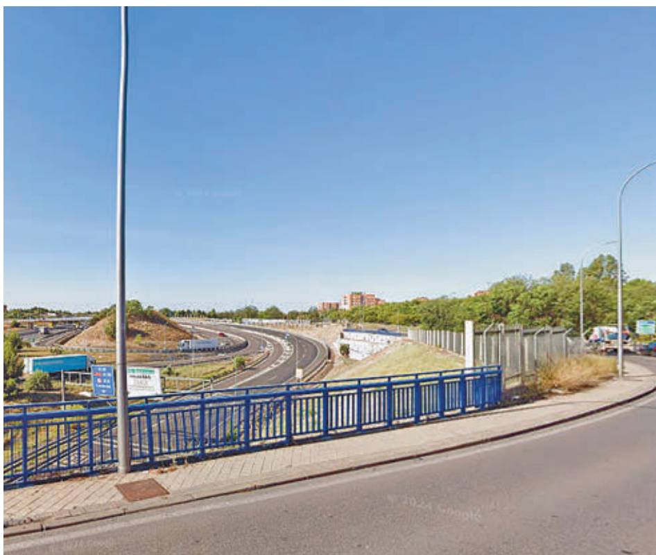
La pequeña acera del Camino del Pozo del Tío Raimundo