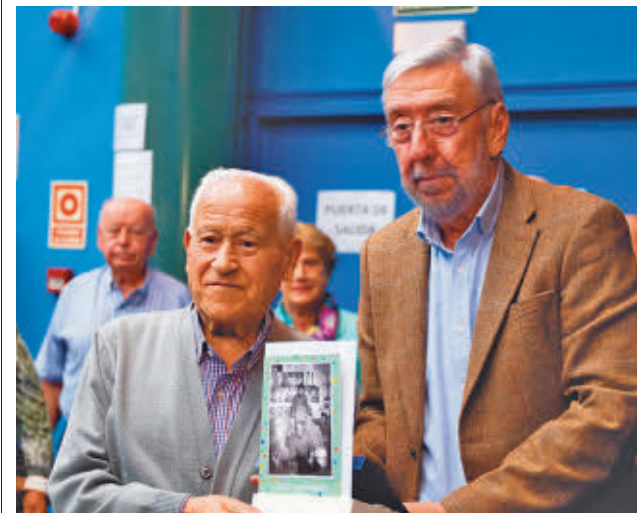
Dos de los mayores homenajeados en Villa de Vallecas

Por otro lado, el edil destacó la importancia de los servicios de los centros de mayores Santa Eugenia y Villa de Vallecas y de las actividades que se organizan, "para que sus asociados disfruten de un envejecimiento activo y mejoren su calidad de vida".