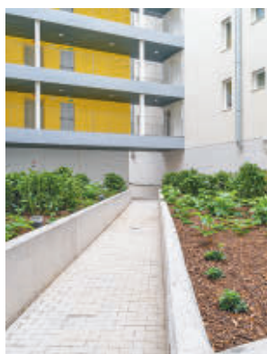
El interior del edificio

ubicada en el barrio de El Cañaveral. Fuentes municipales explican que estos nuevos pisos se prevé que serán sorteados en el primer trimestre de 2025 y permitirán ampliar la oferta de este tipo de arrendamiento, especialmente para jóvenes y familias con hijos menores. Asi-