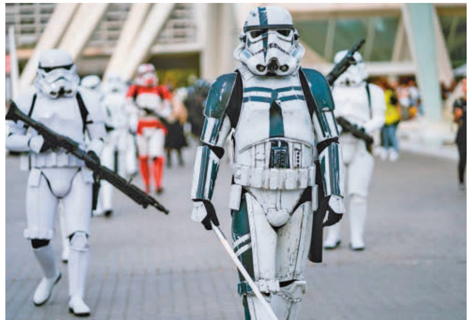
Los guardias imperiales estarán muy presentes en el desfile solidario de este sábado 19

El desfile dará comienzo a las 18 horas en el Centro Deportivo Municipal de la Cebada, en la plazuela de Lina Morgan. De ahí, transcurrirá por la calle de Toledo para pasar por plaza de Segovia Nueva, plaza de la Villa, calle Mayor, calle de Bailén, Palacio Real, calle de Arenal y Puerta del Sol, para después volver al punto de partida, donde el evento finalizará a las 20 horas. La cabecera y el final de este acto contarán