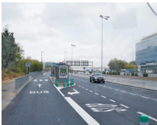
El nuevo carril situado en la avenida de Burgos