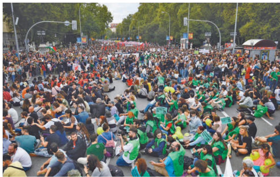
La convocatoria de Madrid fue multitudinaria EUROPA PRESS

animando a organizarse desde esta semana.