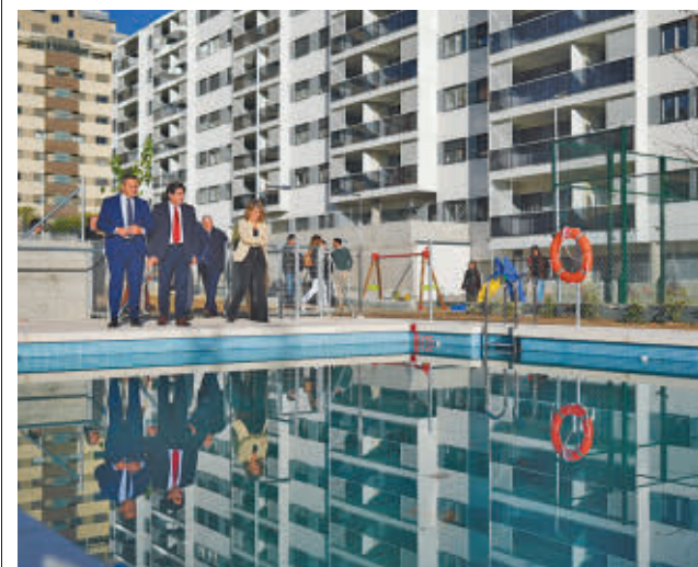
Un momento de la visita institucional