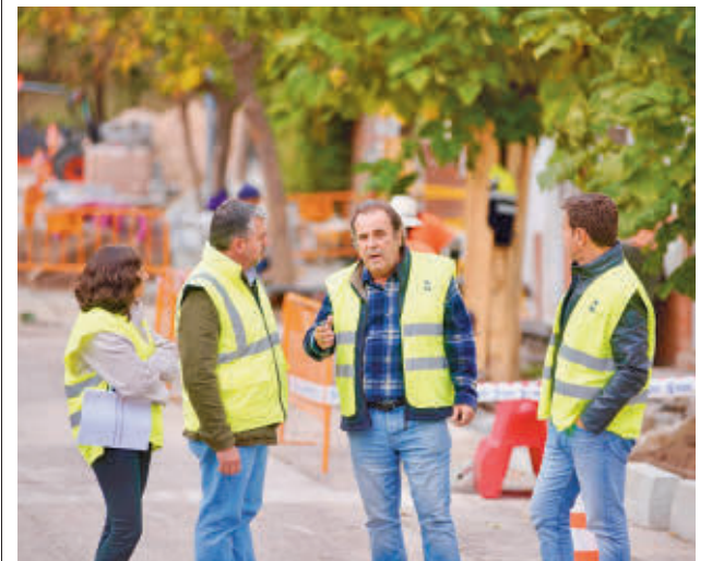
La visita de las autoridades a las obras

gentedigital.es La actualidad de los municipios del Noroeste, en nuestra web