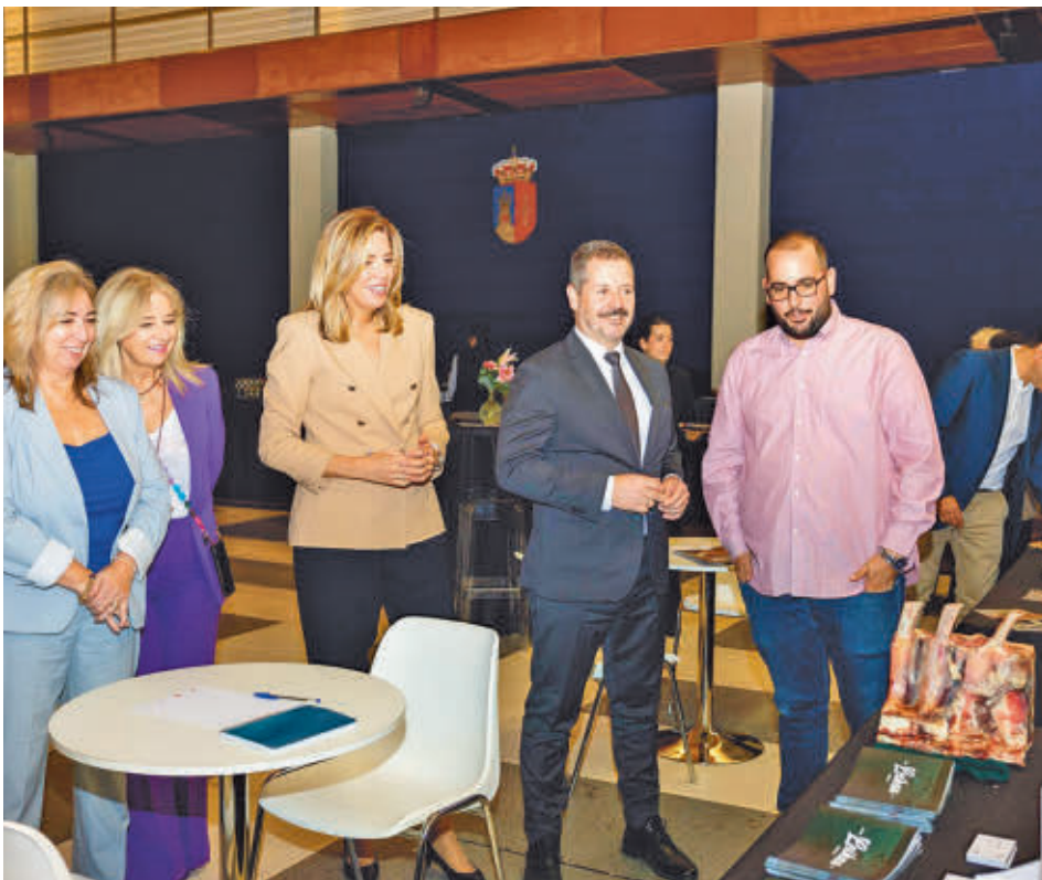
Un momento del encuentro entre la alcaldesa y el consejero regional