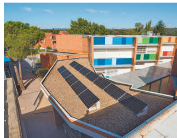
Placas solares en un edificio de Las Rozas

les. En concreto, se instalarán paneles de autoconsumo en la Casa Consistorial, el Centro Municipal El Abajón, el Centro de Mayores El Baile, el Centro de Mayores de Las Matas, el Centro Cívico y Social de Las Matas, Samer, la Policía Local, la Escuela Infantil La Cigüeña María, la Escuela Infantil Juan Ramón Jiménez, el Auditorio Joaquín Rodrigo, la Biblioteca León