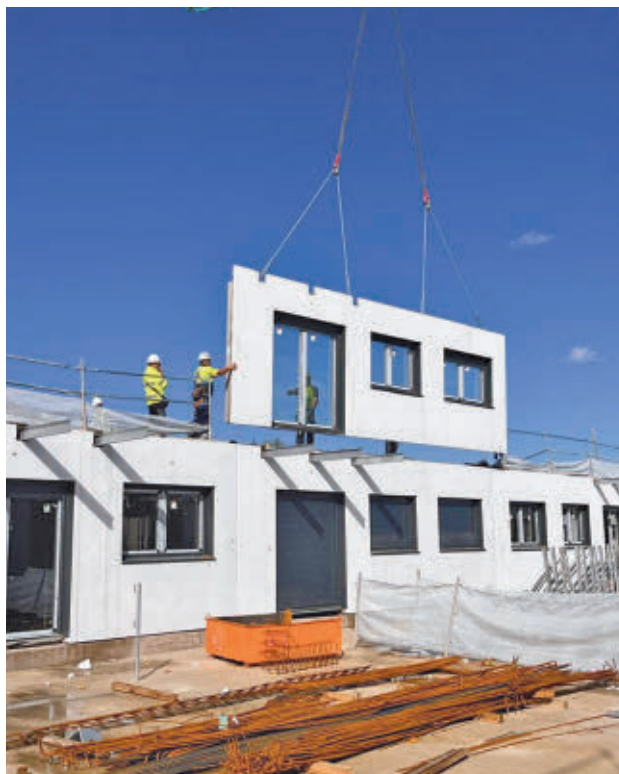
Obras del Plan Vive en Pinto

Una vez termine la construcción, el Ayuntamiento de Pinto habilitará una Oficina Municipal para que los vecinos puedan solicitar ser titulares de uno de estos inmuebles, que Sogeviso se encargará de comercializar. Tendrán prioridad los vecinos de Pinto y entre los requisitos estará el destinar el piso a vivienda habitual y no ser propietario en todo el territorio na-