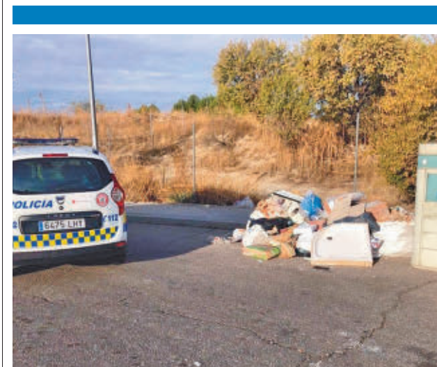
Escombros en la calle Virgilio

El otorgamiento se efectuará en régimen de concurrencia, mediante licitación pública y atendiendo a la pluralidad de criterios. Las personas físicas o jurídicas interesadas en gestionar algunos de estos quioscos de hostelería pueden presentar su oferta hasta el próximo 8 de noviembre.