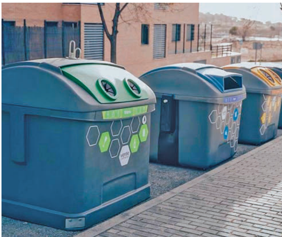
Contenedores en Colmenar Viejo