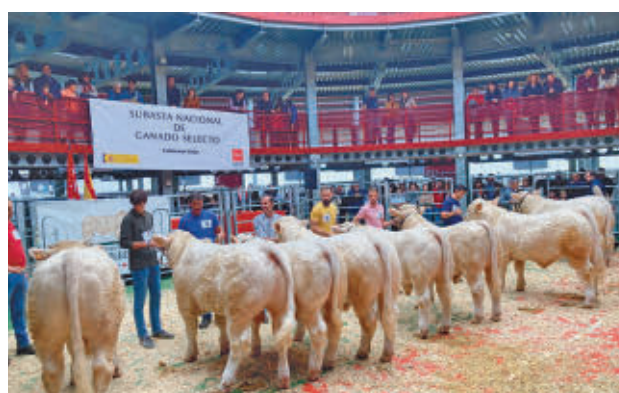
Edición anterior de la subasta de ganado

mente ha sido suspendido por la Comunidad de Madrid. La razón, la situación epidemiológica de la ‘lengua azul’ tras la declaración de nuevos focos de los serotipos 1 y 8 en distintas comunidades autónomas. Según aseguran fuentes del Gobierno regional, la Comuni-