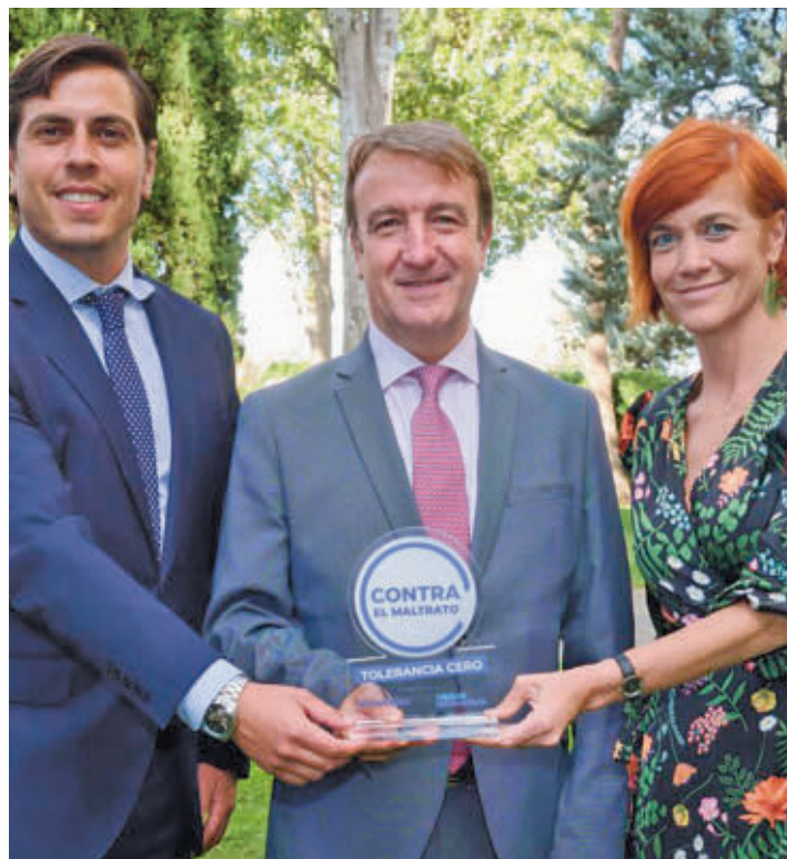
Representación municipal con el premio

Esta guía vuelve a ser noticia esta semana tras la inclusión de Tres Cantos como uno de los cuarenta municipios premiados por Fundación Mutua Madrileña y Antena 3 Noticias por su compromiso 'Contra el maltrato, Tolerancia Cero', una iniciativa conjunta que arrancó hace