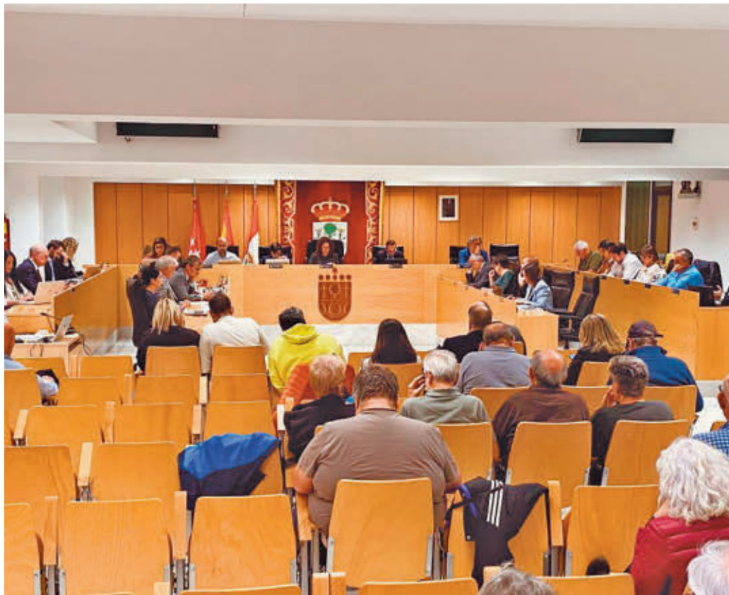
Un momento del pleno celebrado la semana pasada

Una de las grandes novedades viene aparejada al Impuesto de Bienes Inmuebles, el IBI, en el que está previsto un aumento de la bonificación por el uso de energía solar, pasando del 25% actual al 50%. Esta medida conecta con otra planteada: la regula-