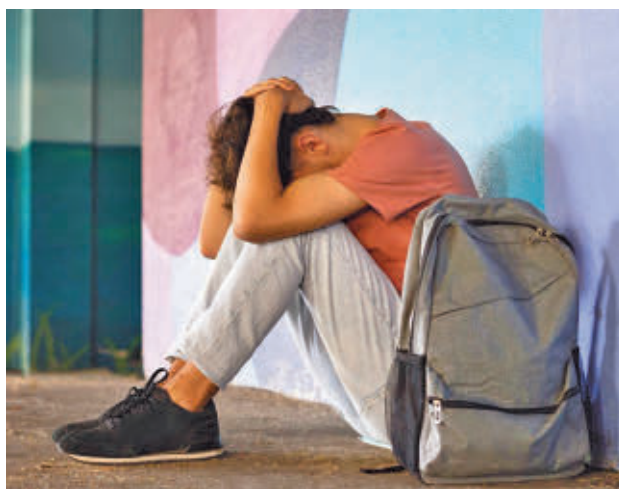
El programa se centra en la población joven

'Destapando lo invisible' pretende llegar a la población más joven de los centros escolares de la ciudad.