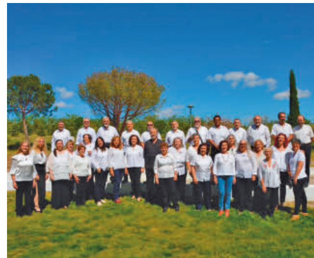
Foto de familia de la Coral de San Sebastián de los Reyes

Es importante destacar que la Coral busca nuevas voces. Las personas interesadas pueden acercarse a las audiciones que se realizan todos los miércoles y viernes, en horario de 19:30 a 21:30 horas, en el Centro Sociocultural Pablo Iglesias (Avenida de Bau-natal, 18).