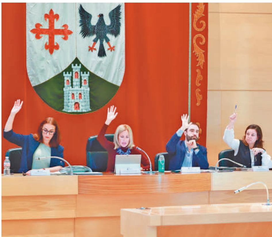
Una de las votaciones realizadas durante la sesión