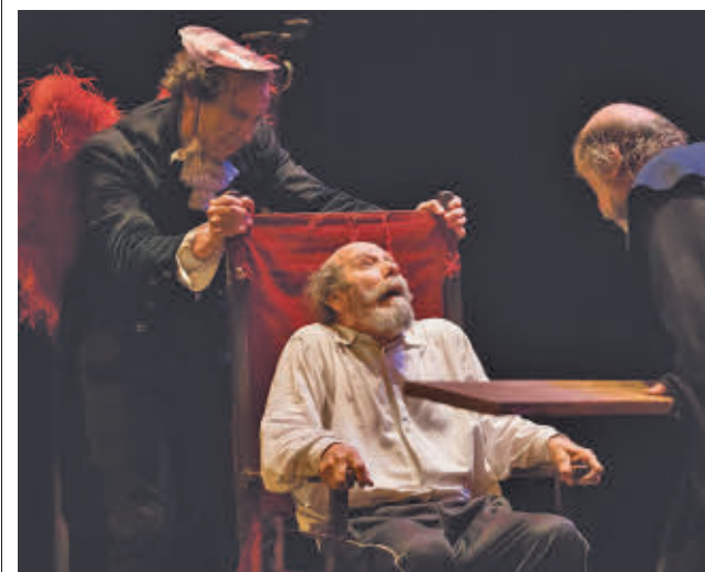
Escena de la obra teatral de La Zaranda Teatro M. CORTE