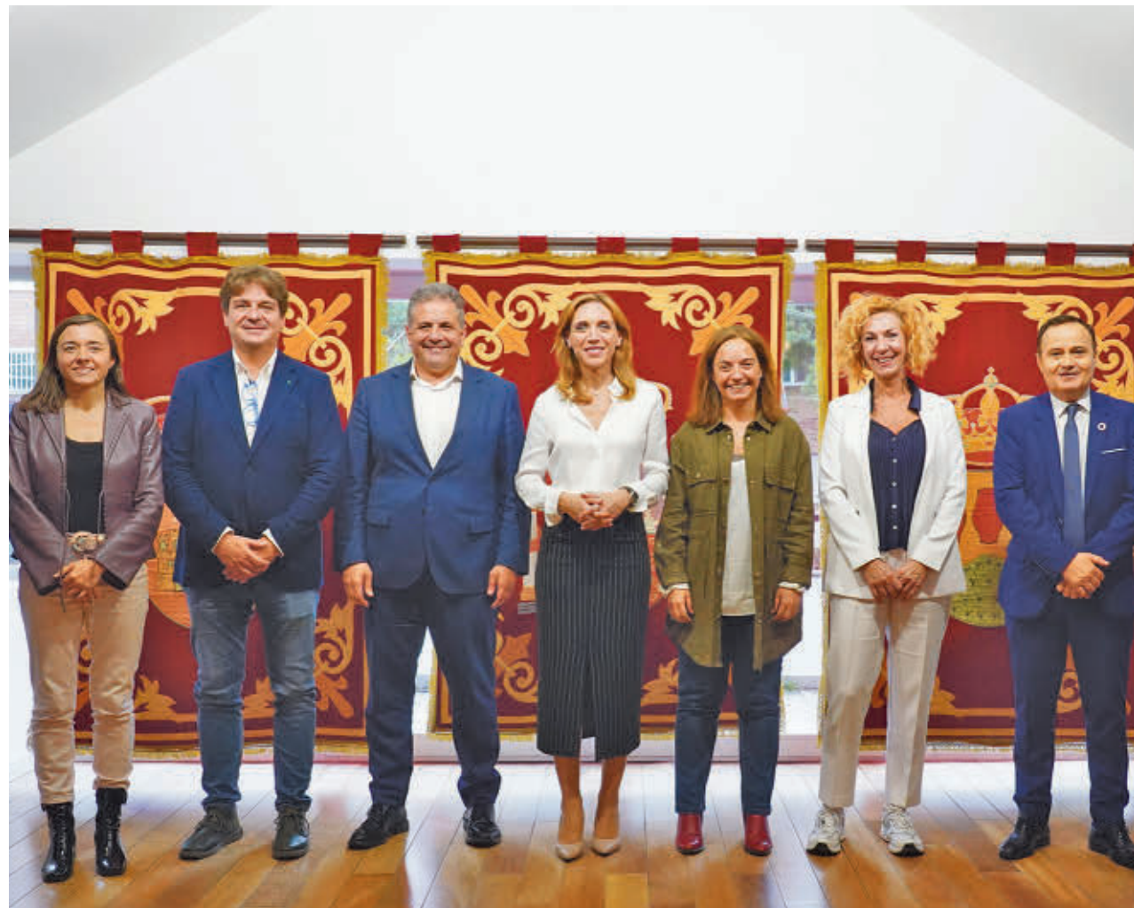
AYTO DE ALCORCÓN