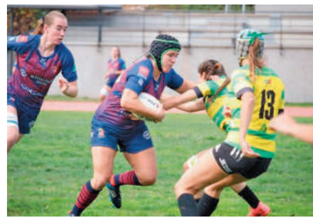
Arranca la fase regular

Cuatro de cuatro. El Innova-tns Leganés tratará de mantener su pleno de victorias a costa de un Castelló al que visitará este sábado 26.