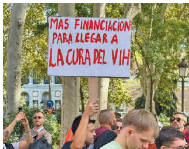
El acto busca dar visibilidad a quienes viven con VIH

rompen prejuicios’ y ‘Sin excusas para la discriminación. Indetectable = Intransmisible’, se hizo un llamado a la sociedad para adoptar medidas urgentes y efectivas contra la discriminación. “Este acto busca dar visibilidad y dignidad a las más de 150.000 personas en España que viven con VIH, y aún sienten la necesidad de ocultar su estado serológico”, han apuntado.