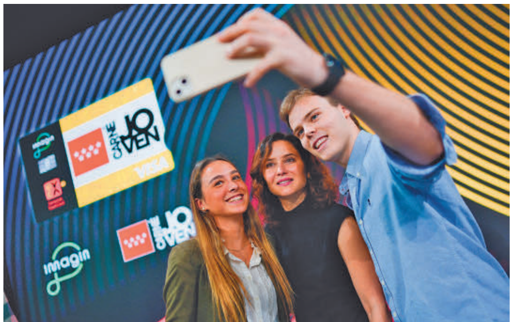
Díaz Ayuso se hizo unas fotos con varios jóvenes en el acto

El Carné Joven ha alcanzado la cifra de las 1.000 empresas y entidades colaboradoras, que realizan descuentos en