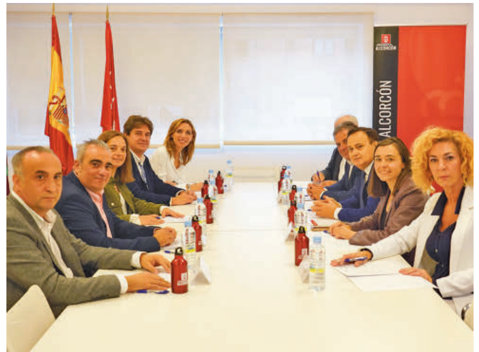
La reunión de los nueve alcaldes se produjo en Alcorcón

El objetivo es "propiciar la vivienda asequible para garantizar el derecho de acceso" a través del fomento de "la intervención de políticas públicas y la cooperación entre administraciones". Entre las cuestiones que quieren que se cumpla están que las viviendas públicas protegidas no dejen de serlo tras 15 años y