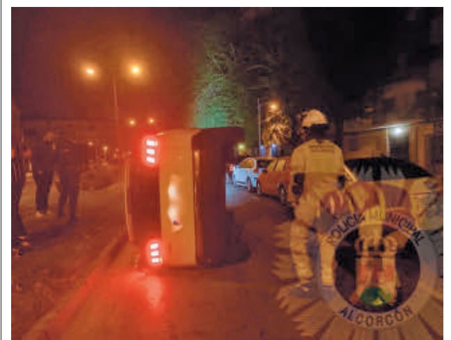
Los Bomberos devolvieron la verticalidad al coche

También se programan actividades como música en vivo a cargo del grupo de saxofones de la Escuela Municipal de música Manuel de Falla de Alcorcón.