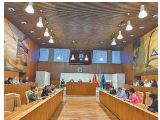
Sesión en la que se aprobó la Cuenta General

La edil también subrayó las cifras de 2023 de la Empresa Municipal del Suelo de Leganés (EMSULE), que contó con "un gran incremento de los beneficios generados, alcanzando los 17.634.627 euros, frente al resultado negativo de 1.355.265 euros del ejercicio anterior".