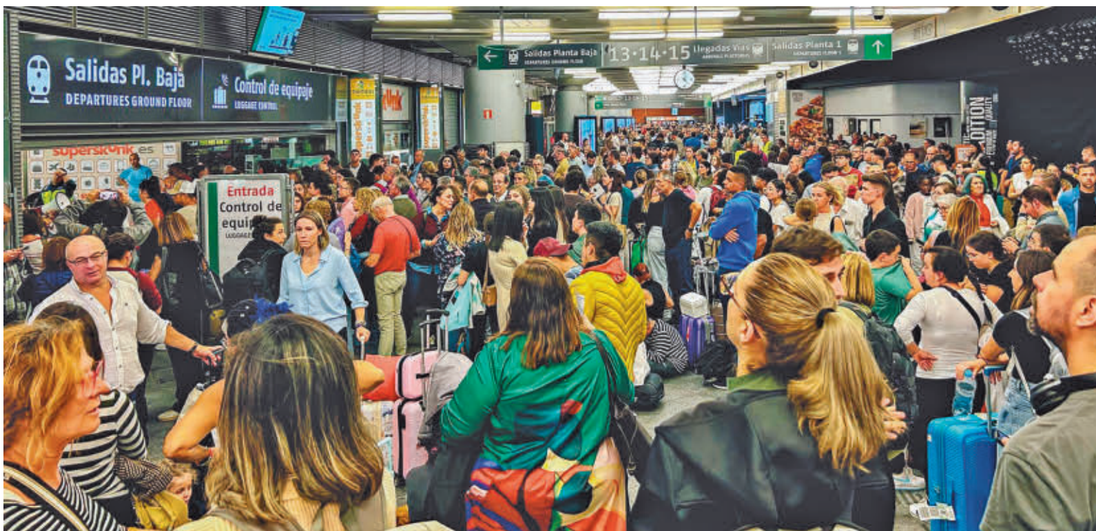
Cientos de viajeros esperan en la estación de Atocha