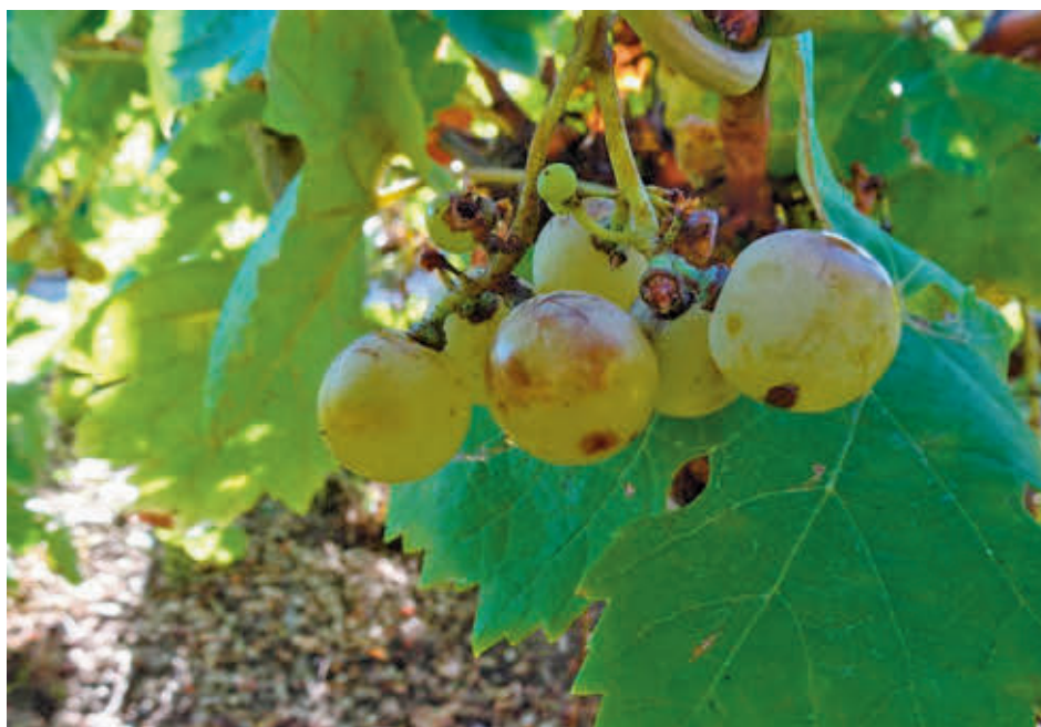
Uvas de la variedad Hebén

Hasta ahora, la Hebén se concebía únicamente como una pieza de museo, con algunos ejemplares conservados en el Museo Ampelográfico y la Colección de Vides de El Encín y en el Museo Ampelográfico, ambos situados en