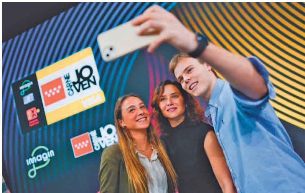
Díaz Ayuso se hizo unas fotos con varios jóvenes en el acto

El Carné Joven ha alcanzado la cifra de las 1.000 empresas y entidades colaboradoras, que realizan descuentos en