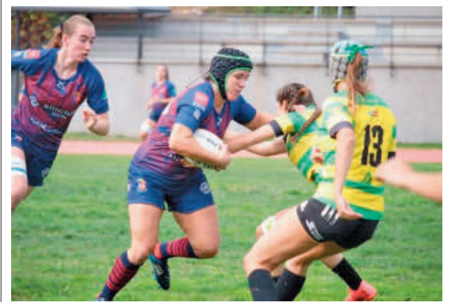
Arranca la fase regular

Cuatro de cuatro. El Innova-tsn Leganés tratará de mantener su pleno de victorias a costa de un Castelló al que visitará este sábado 26.