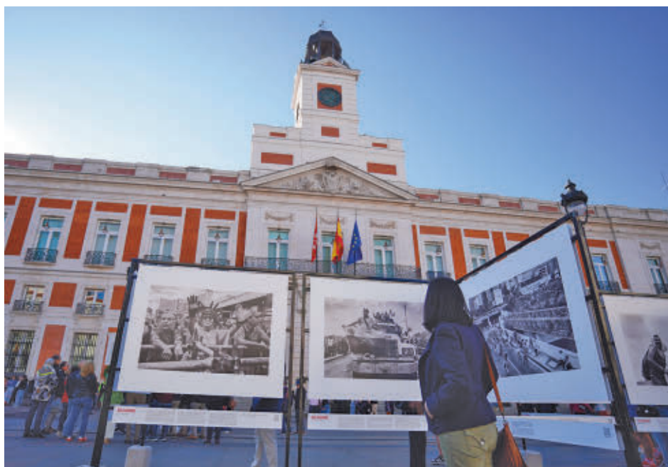
Algunas de las fotos que se pueden ver en la Puerta del Sol

El fotógrafo recordó "al pueblo venezolano, a los millones de