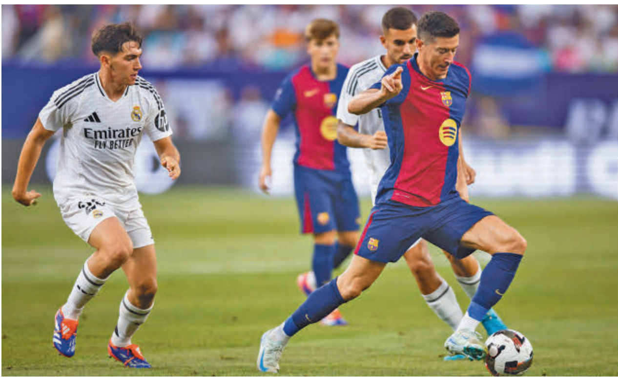
Robert Lewandowski en el partido amistoso disputado este verano en Estados Unidos