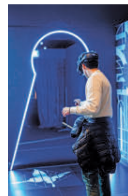
Un lugar icónico

bre de 2023, la experiencia inmersiva de Tomorrowland ha recibido a más de 40.000 visitantes de 56 países que han disfrutado de una experiencia de realidad virtual sin precedentes y se han sumergido en el universo mágico de uno