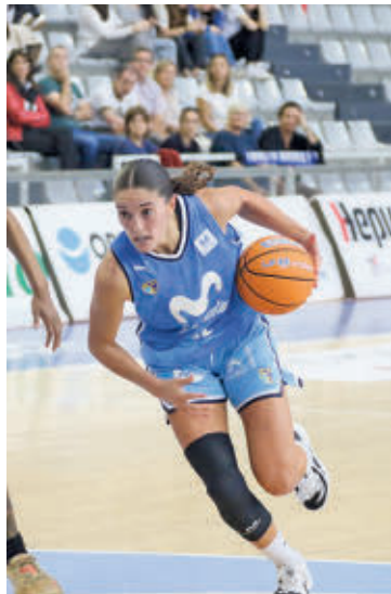
Derrota en Donostia FEB

El Valencia, líder con pleno de victorias • Las del Ramiro también van en buena línea