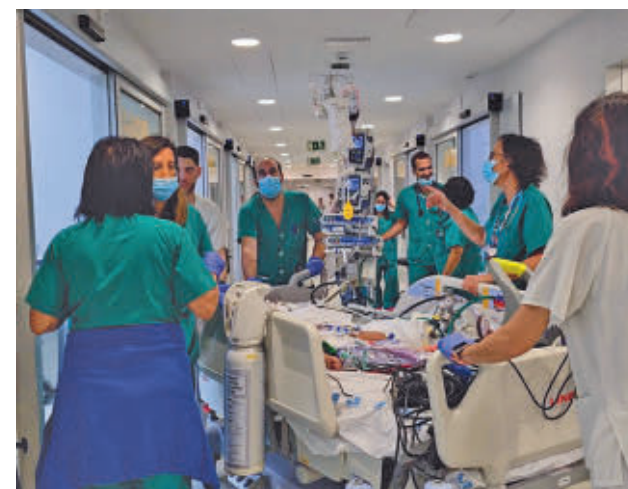
Momento del traslado del niño

El menor fue desconectado del ECMO el martes 15 de octubre y está estable. Actualmente, continúa ingresado a la espera de evolución en la Unidad de Cuidados Intensivos Pediátricos.