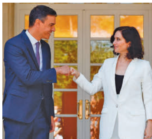
Sigue la guerra fría entre Sánchez y Ayuso

EL PERIÓDICO GENTE NO SE RESPONSABILIZA NI SE IDENTIFICA CON LAS OPINIONES QUE SUS LECTORES Y COLABORADORES EXPONGAN EN SUS CARTAS Y ARTÍCULOS