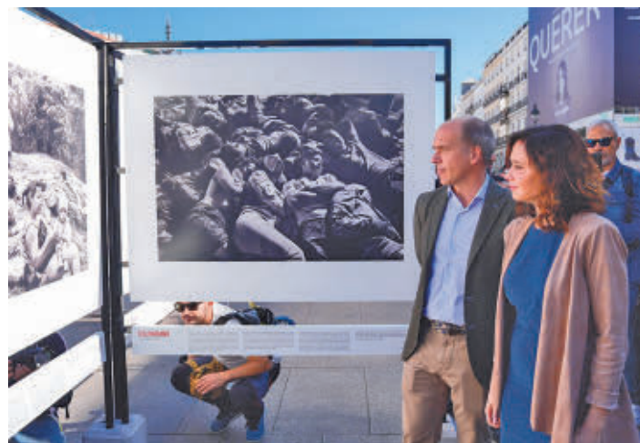
Díaz Ayuso, junto al autor de las fotografías

'Bolívariano' es una exposición de 31 fotografías en blanco y negro que denuncian la "tiranía" de Nicolás Maduro • Isabel Díaz Ayuso la inauguró junto a su autor, Álvaro Ybarra Zavala