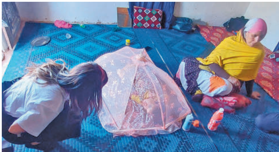
Las condiciones en los campos de refugiados son muy precarias

SE HA ELEGIDO ESTA ÉPOCA POR LAS DIARREAS Y LOS CATARROS POR LAS MOSCAS