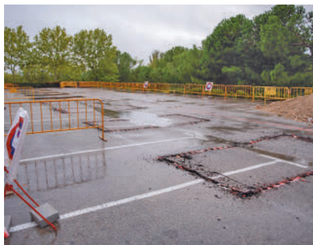
Las obras en la zona de estacionamiento

Además del ahorro que suponen sobre el consumo energético, las placas fotovoltaicas producen también una reducción en las emisiones de CO2, por lo que se configuran como un modelo energético más sostenible.