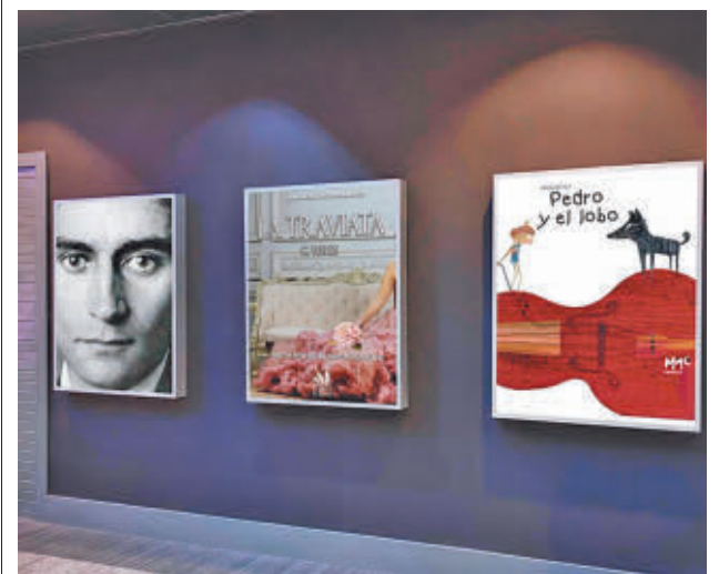
Los carteles de la programación cultural majariega