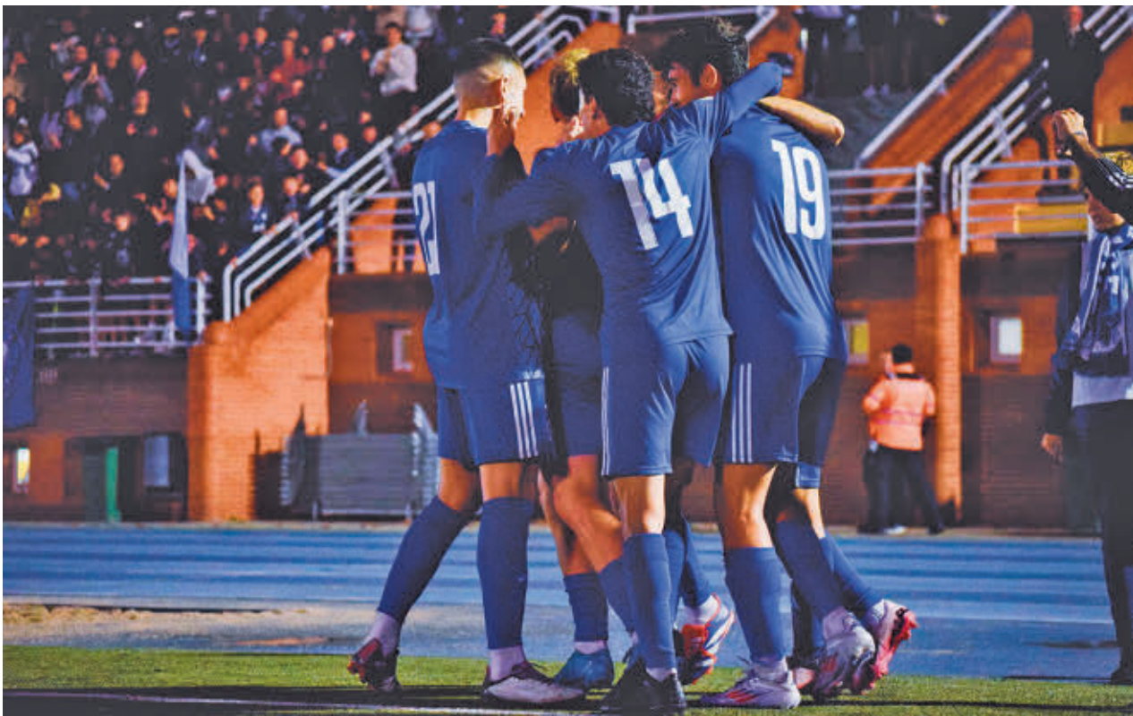
Los jugadores de las Rozas celebran uno de los goles que marcaron al Cazalegas