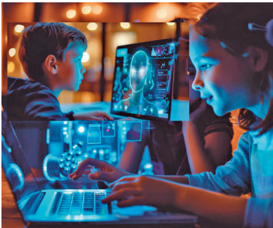
Los participantes podrán programar su propia Inteligencia Artificial

El fin de semana se completará el domingo 27 de octubre en el Teatro de la Cultura Carmen Conde un espectáculo de magia para niños, en colaboración con la Red de Teatros de la Comunidad de Madrid. 'Mystery' combina trucos de magia y música para divertir a los más pequeños durante hora y media.