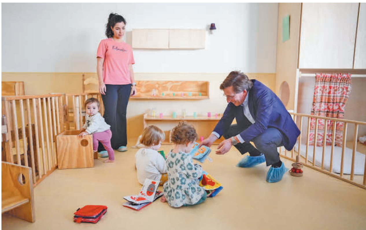
El alcalde muestra un libro de animales a dos niñas en la Escuela Infantil Muñeco de Nieve de Vicálvaro