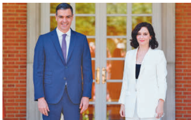
Pedro Sánchez y Ayuso, durante una reunión

También hablaba en un comunicado de "la negociación de la ruptura de la Ha-