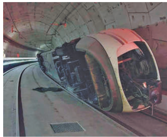
Vagón descarrilado en el túnel de Atocha