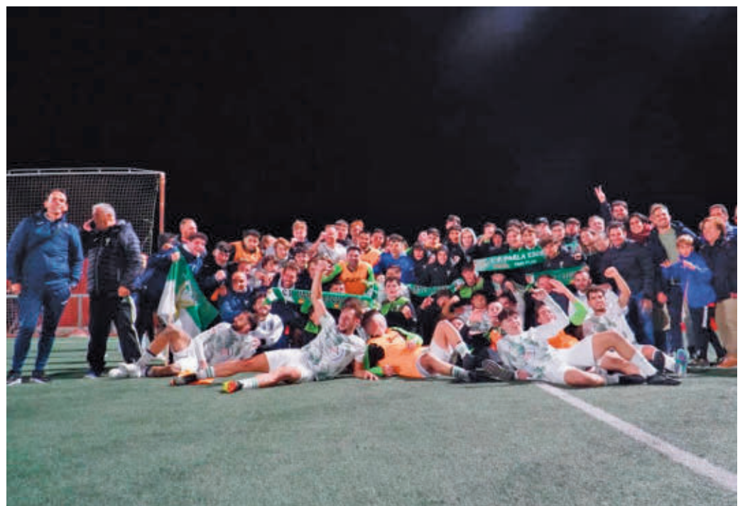
Los jugadores del Parla Escuela celebran el triunfo en Sonseca