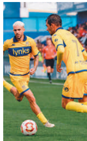
El Alcorcón ganó al Castilla

Por su parte, el Atlético de Madrid B, duodécimo, visitará al Hércules.