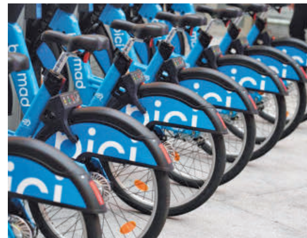
Varios vehículos del servicio municipal de alquiler

Fuentes municipales explican que las ubicaciones han sido escogidas con la finalidad de densificar zonas donde ya estaba presente el servicio y cuyo perfil de demanda indica la conveniencia de reforzar el sistema, así como para dar cobertura a nuevas localizaciones no cubiertas con anterioridad, para lo que se han tenido en cuenta distintas peticiones de las juntas municipales de distrito.