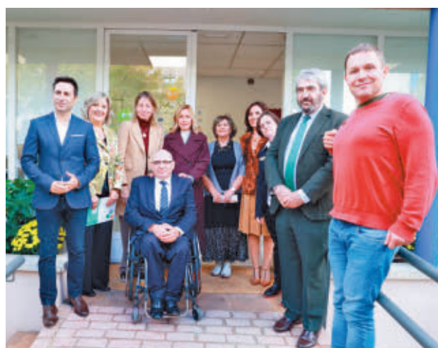
Inauguración del espacio en avenida de la Vega

El nuevo espacio cuenta con un centro de formación dotado de medios y adaptado para personas con discapacidad intelectual. Tiene como objetivo formar estas personas desarrollando aspectos laborales, sociales y personales para favorecer su inserción en el mundo laboral.