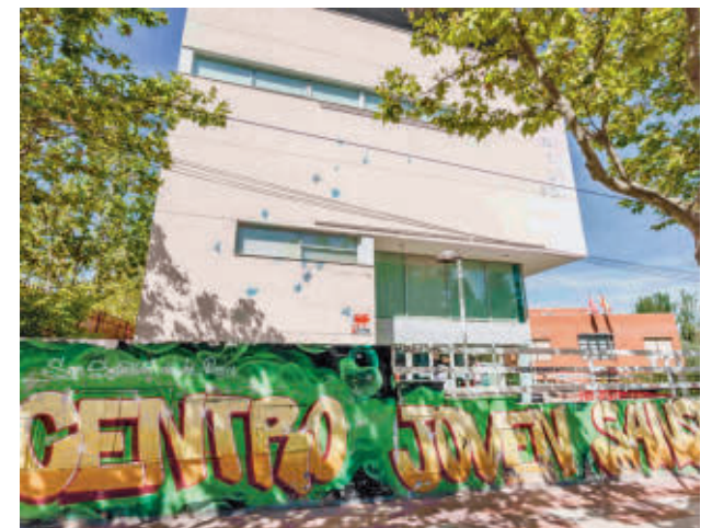
Fachada de Centro Joven Sanse

La recta final de la programación incluye para el jueves día 21 el espectáculo Experiencias (18 horas) y el Día del Cuento (18 horas), mientras que el viernes 22 habrá Scalextric (17 horas), Taller de cocina y teatro con Mr. Vértigo (17:30 horas) y Campeonato de tenis de mesa (17:30 horas).