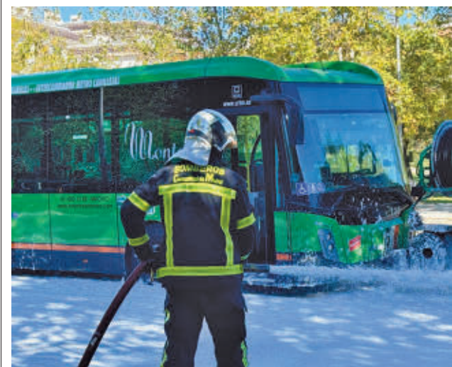
Intervención de uno de los bomberos

GenteMadrid.es Consulte la actualidad regional y local en nuestra página web