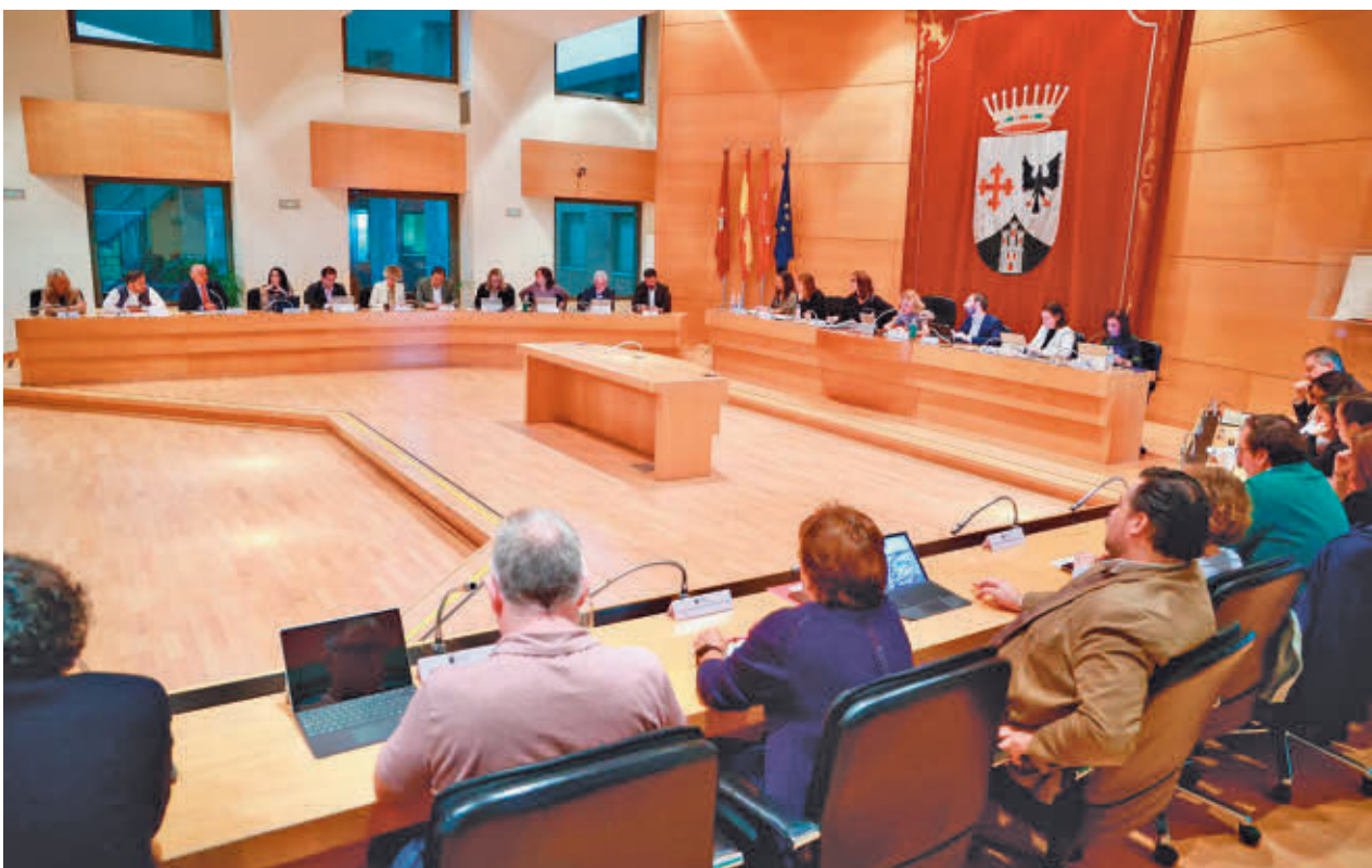
El pleno extraordinario tuvo lugar el pasado viernes 25 de octubre