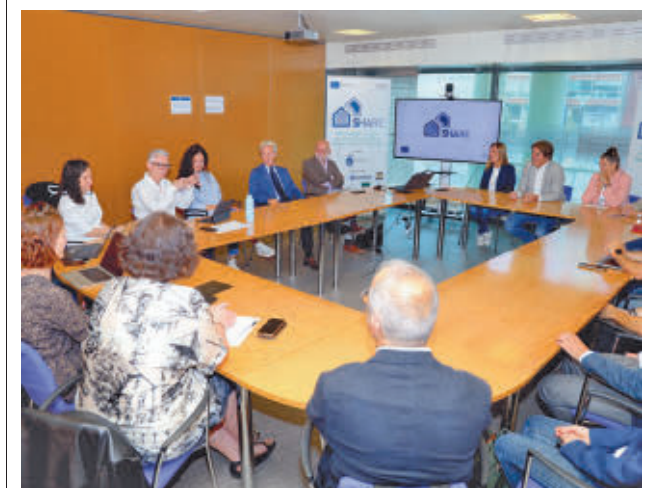
Reunión socios del SHARE AYUNTAMIENTO FUENLABRADA

En este sentido, han insistido en que lo que se pretende con ello es “reclamar las condiciones de vida que nos impiden las políticas de privatización y especulación en los servicios básicos y los derechos fundamentales”. Enumeran cuestiones como una “vivienda digna” a un precio asequible, centros educativos y de salud en condiciones y un compromiso público con las pensiones.