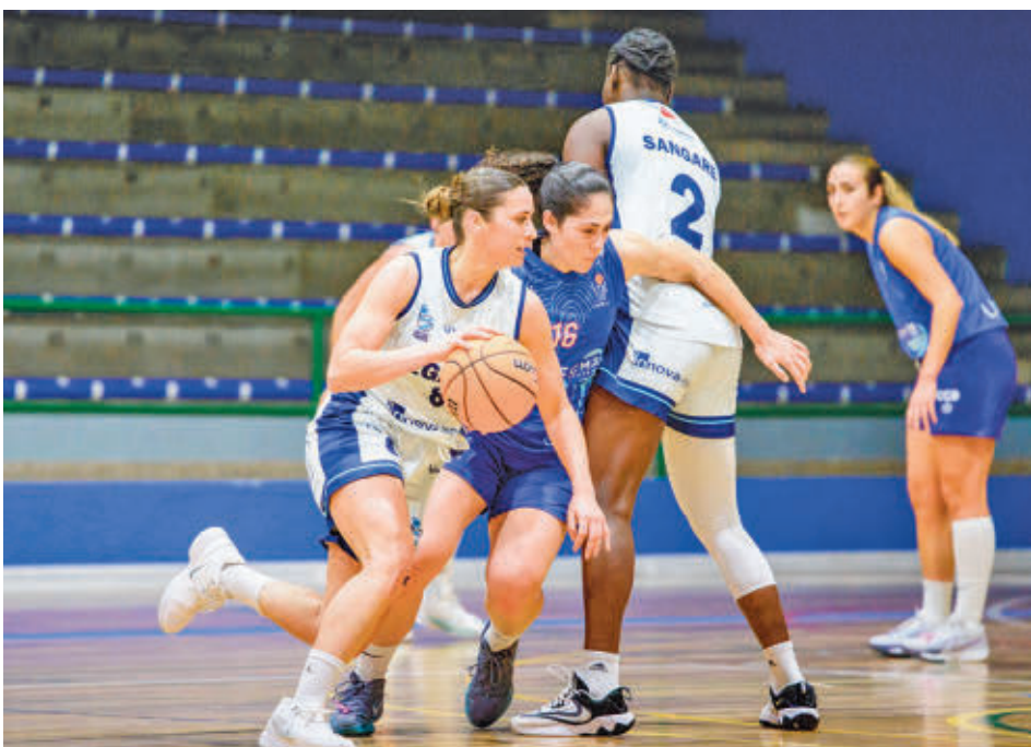
Sufrida victoria del Leganés en Castellón NBF