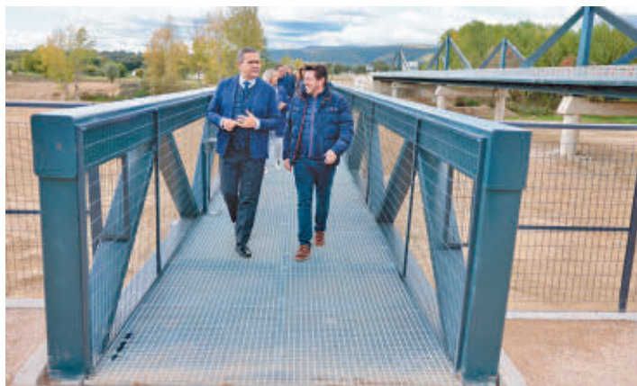
El consejero visitó la zona este fin de semana