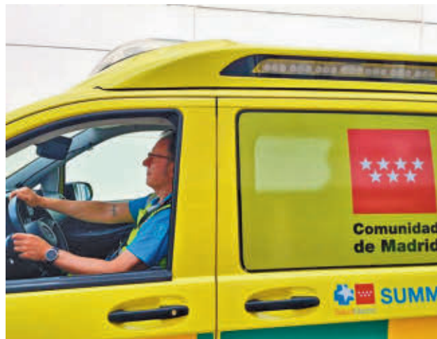
Una de las ambulancias del Summa 112

Las autoridades sanitarias recuerdan la importancia de llamar al 112 ante la aparición de uno sólo de estos síntomas: dificultad para hablar o entender; sonrisa caída hacia un lado; o pérdida de fuerza en un brazo o en una pierna. No hay que dejar que remitan ni acudir directamente a un hospital.