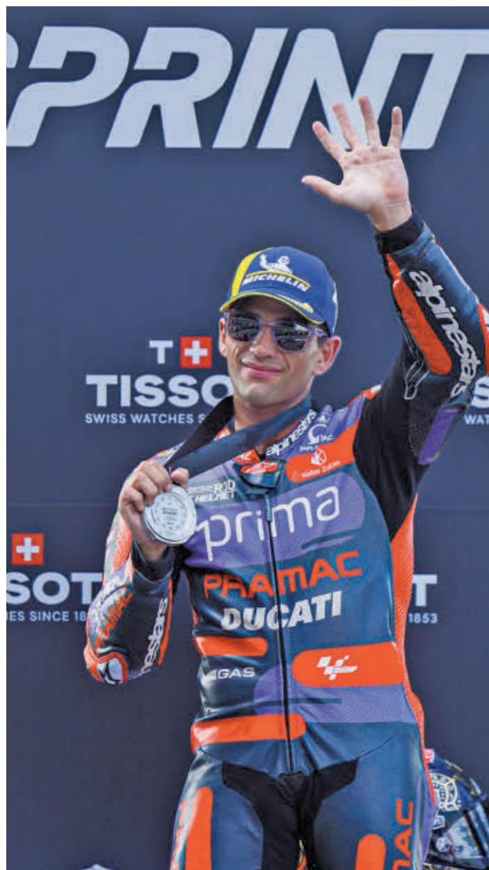
El piloto del Pramac, en el podio de Tailandia

A tenor de lo visto esta temporada, donde Bagnaia solo ha sufrido tres abandonos (por dos de Martín), todo hace indicar que las espadas se mantendrán en todo lo alto hasta el 17 de noviembre, fecha en la que se disputará el