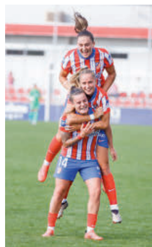
El Atlético viaja a Donostia

equipos madrileños tratando de meter presión al líder y vigente campeón, el Barça. Uno de los primeros aspirantes en salir a escena es el Atlé-