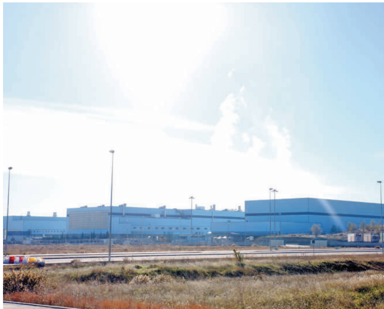
AYTO DE FUENLABRADA