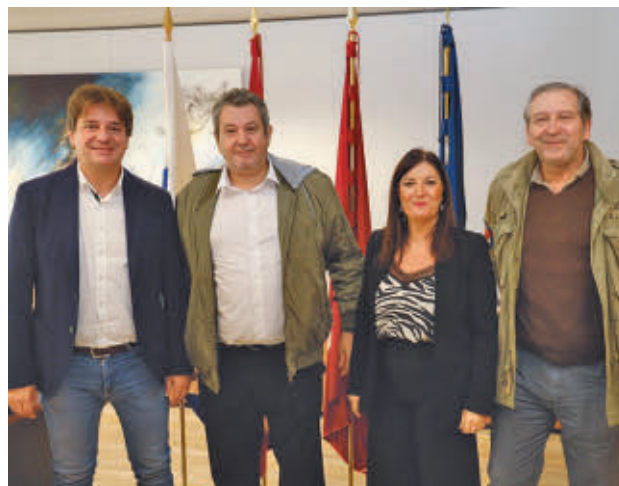
La rúbrica sirve para apoyar económicamente el evento

El objetivo de la misma, que se viene celebrando desde hace ya varios años impulsada por esta organización y en colaboración con el Consistorio, es el de dar visibilidad a los establecimientos locales y a sus propuestas culinarias, a la vez que se promueve la variada cultura gastronómica que ofrece la ciudad para atraer visitantes.