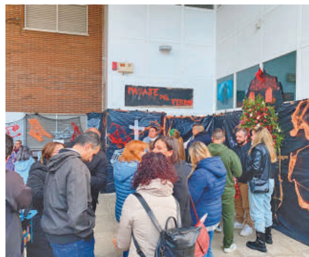
La AV Arco Iris tuvo su Pasaje del Terror este fin de semana

MÁS INFORMACIÓN GenteMadrid.es Consulte la actualidad regional y local en nuestra página web