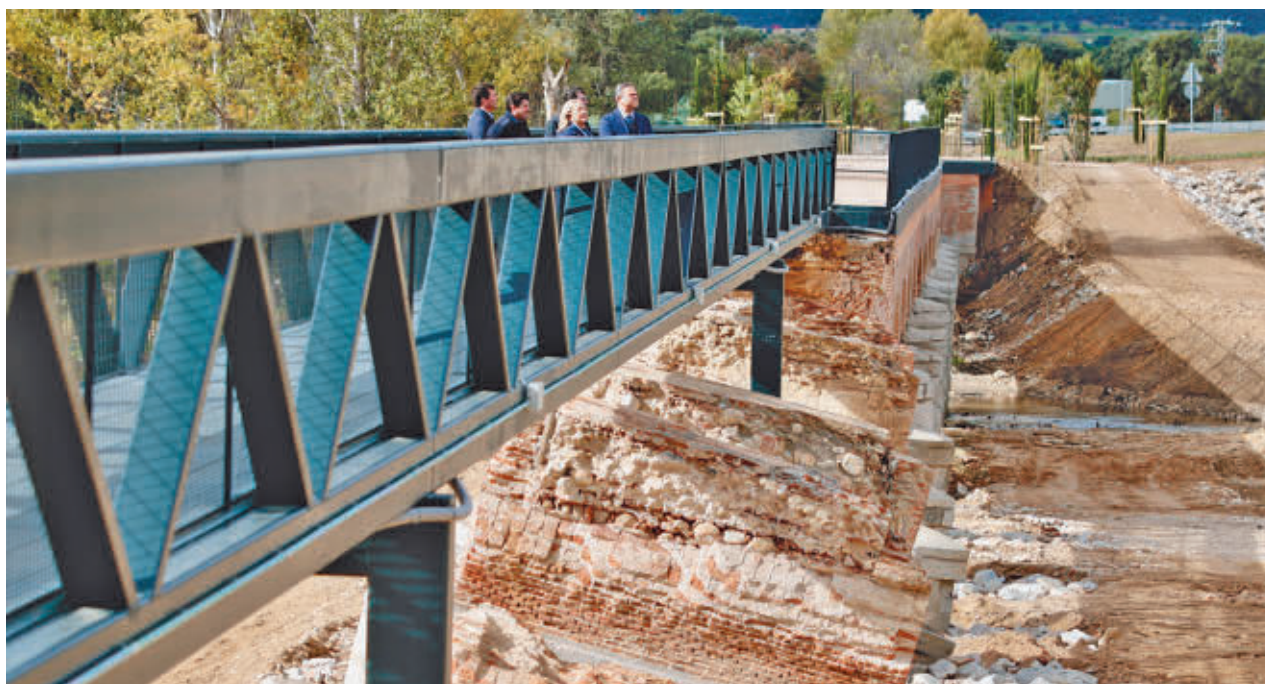
Pasarela desde la que se podrá observar el Puente de La Pedrera

La Oficina de Impulso a la IA se estrenó en mayo coordinando y promoviendo iniciativas que ayuden a optimizar y hacer más eficiente la atención a los ciudadanos. Para ello cuenta en su organigrama con representantes de todas las consejerías y la colaboración de empresas punteras.