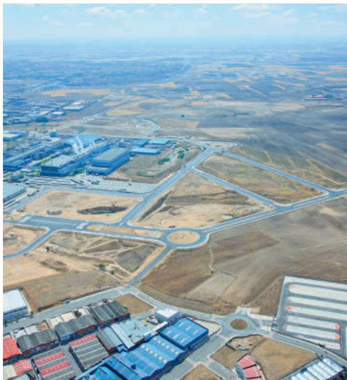
Foto de archivo del polígono El Bañuelo

Las cuatro mencionadas forman parte del proceso de comercialización puesto en marcha el pasado mes de abril, que integra una decena de parcelas en total que se encuentran ya urbanizadas y que disponen de todos los servicios necesarios para su explotación, han apuntado