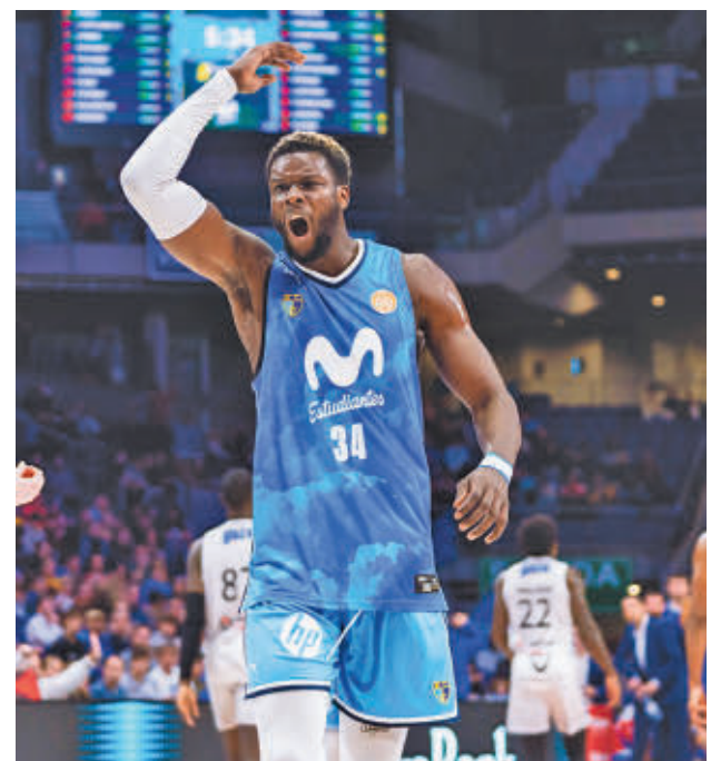
Los colegiales se impusieron al Zamora

Este sábado (17:30 horas), nueva cita en las instalaciones de Pez Volador ante el Barça CBS, un equipo que tras caer de Liga Femenina ocupa la novena posición.