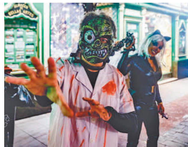
Celebración de Halloween en Madrid

Por otro lado, ha destacado que la región crece a un ritmo del 6% interanual y acumula ya la llegada de más de 6,8 millones de turistas en lo que va de año en la ciudad de Madrid y 8,7 millones en el conjunto de la Comunidad.