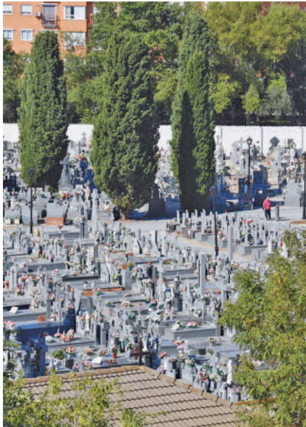
Los agentes vigilarán los accesos al camposanto

Con el objetivo de ofrecer un mejor servicio, la frecuencia de paso será cada 30 minutos. Además, la Policía Local establecerá un operativo especial en las inmediaciones de los dos camposantos el día 1, vigilando los accesos y refor-