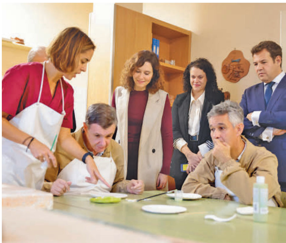
Isabel Díaz Ayuso visitó un centro para personas con TEA en Las Rozas

La Asociación Nuevo Horizonte en Las Rozas de Madrid está dedicada a la atención de personas con trastorno del espectro autista (TEA). Esta entidad busca desde 1980 el bienestar de estas personas y de sus familias, ofreciendo atención terapéutica y psicológica, y actividades de ocio y tiempo libre y con la que la Comunidad de Madrid tiene 50 plazas concertadas