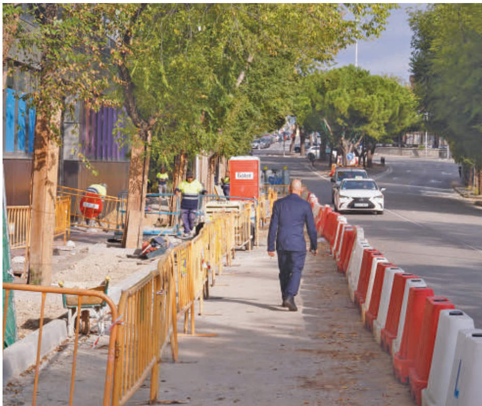
Estado actual de las obras en esta zona del distrito de Fuencarral-El Pardo