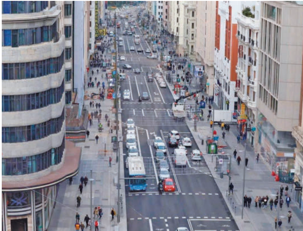
La Gran Vía es una de las principales arterias turísticas de la capital

EL SECTOR HOTELERO GENERÓ UN 4,6% MÁS DE PUESTOS DE TRABAJO