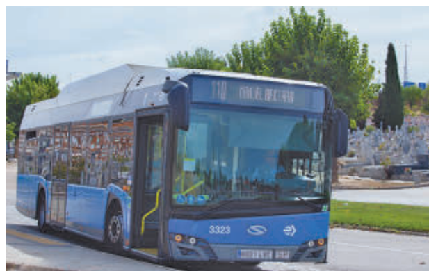
Uno de los autobuses de la línea 110, que llega a La Almudena

Para ello, incrementará el servicio en las rutas 25 (Plaza de España-Casa de Campo), 106 (Manuel Becerra-Vicálvaro), 108 (Oporto-Cementerio de Carabanchel), 110