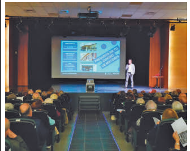
Alrededor de 200 personas acudieron a la presentación

Este programa se unirá a otras propuestas deportivas al aire libre o en interior de los centros de mayores, como gimnasia de mantenimiento, meditación, respiración, relajación o fisioterapia preventiva. Estas iniciativas se suman a las organizadas por el Área de Políticas Sociales, Familia. Todos los martes, a las 10 horas, se realizan clases gratuitas de ejercicio al aire libre, previa inscripción, en la pista de baloncesto de los jardines de Berta Cáceres (avenida de Alfonso XIII).