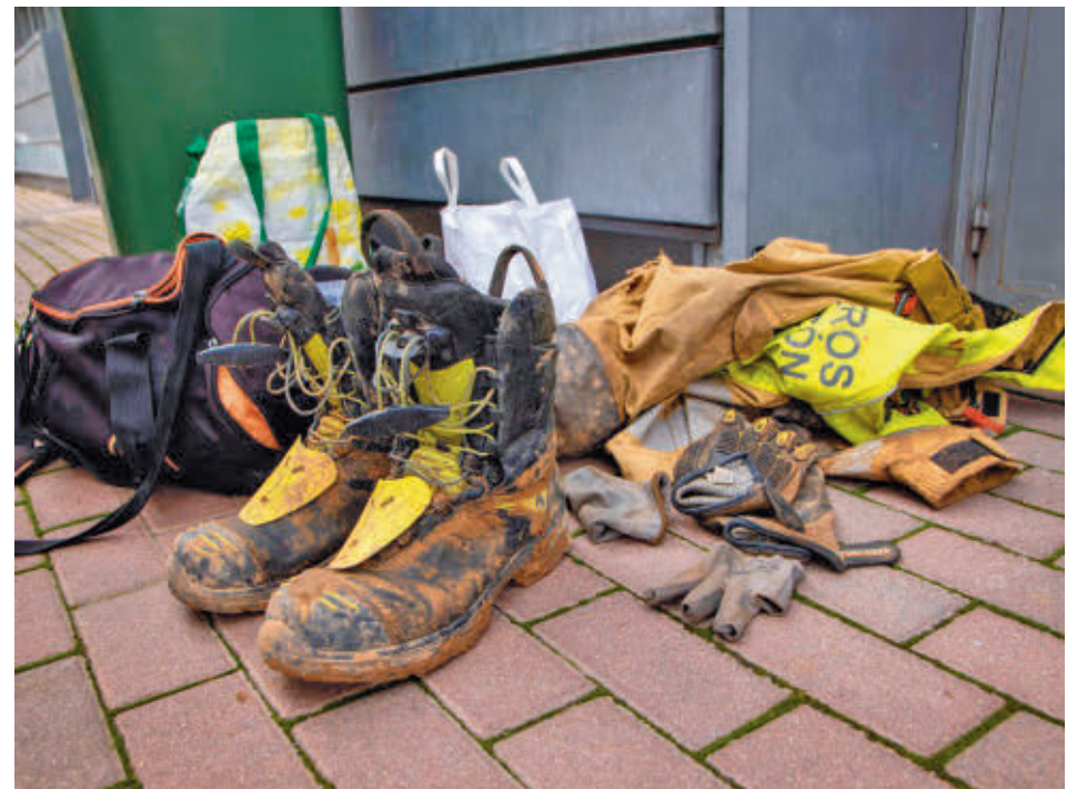
Un grupo de bomberos de Alcorcón ha acudido a ayudar en el terreno

El municipio no solo ha contribuido con productos, sino también con equipos. “Hemos mandado especialistas de nuestro Cuerpo de Bomberos a las zonas más afectadas de Valencia que se han integrado en equipos de allí de la zona para realizar distin-