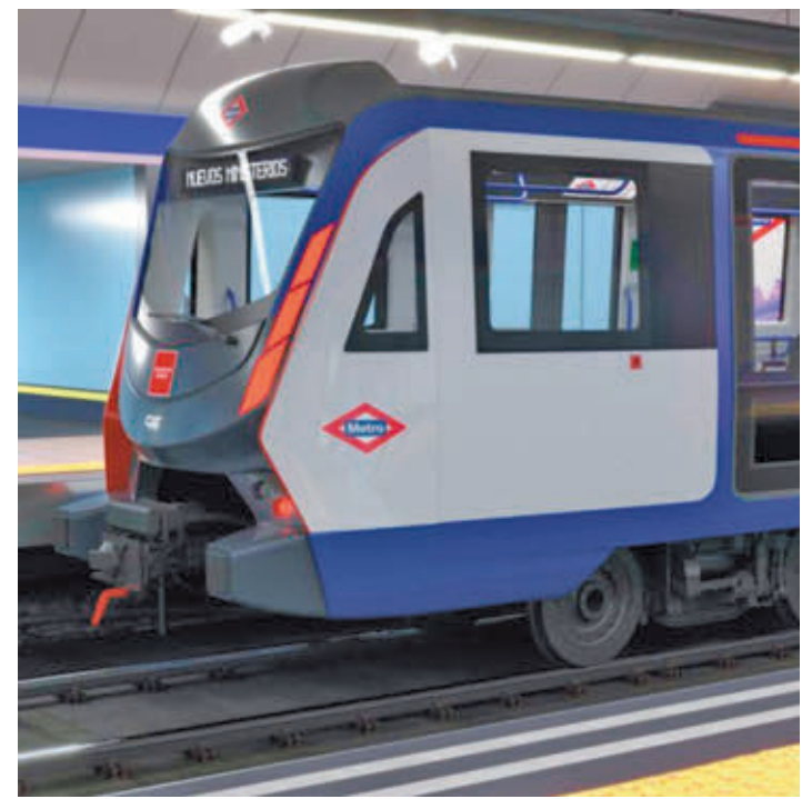
Uno de los trenes que circulará por la Línea 6

Pascual incidió en que serán más seguros y fiables, con tecnología “puntera”. En este sentido, se facilitará una mejor información al viajero gracias a la comunicación continua tren-tierra y dispondrán de novedades como el bucle inductivo, un sistema que facilita la percepción de la megafonía para personas con audífonos. También se mejorará la accesibilidad, ya que conta-