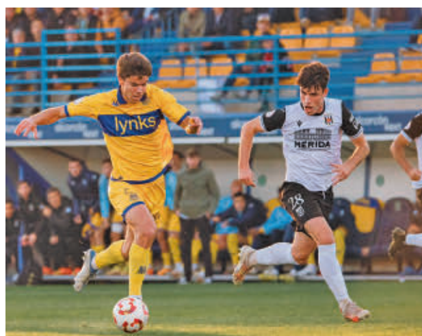
El Alcorcón no pasó del empate con el Mérida AD ALCORCÓN

tras salvar los muebles con el Mérida (2-2) en un choque que pedían por 0-2. Igualado a 10 puntos con el Alcorcón está un Fuenlabrada que este domingo (12 horas) recibe al Hércules, mientras que el penúltimo, el Castilla, jugará con el Intercity. Además, Real Murcia-Atlético B.