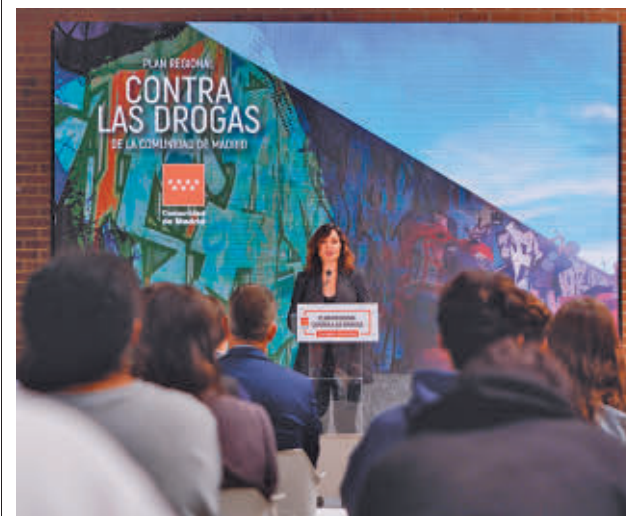
Díaz Ayuso, durante la presentación

Pignoise celebra sus 20 años en la música con una gira que llegará el 7 de marzo al WiZink Center