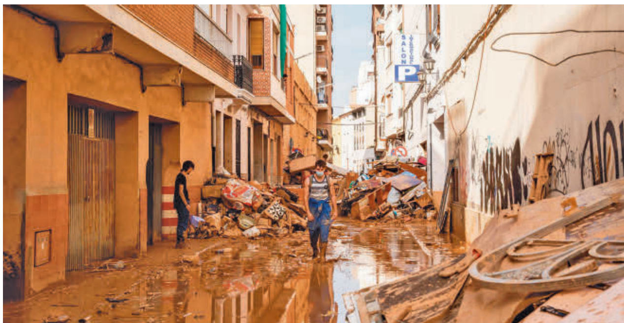
Una de las calles afectadas por la DANA

Euros Para reparar los elementos de las comunidades