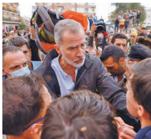
Visita de Felipe VI a Paiporta

EL PERIÓDICO GENTE NO SE RESPONSABILIZA NI SE IDENTIFICA CON LAS OPINIONES QUE SUS LECTORES Y COLABORADORES EXPONGAN EN SUS CARTAS Y ARTÍCULOS