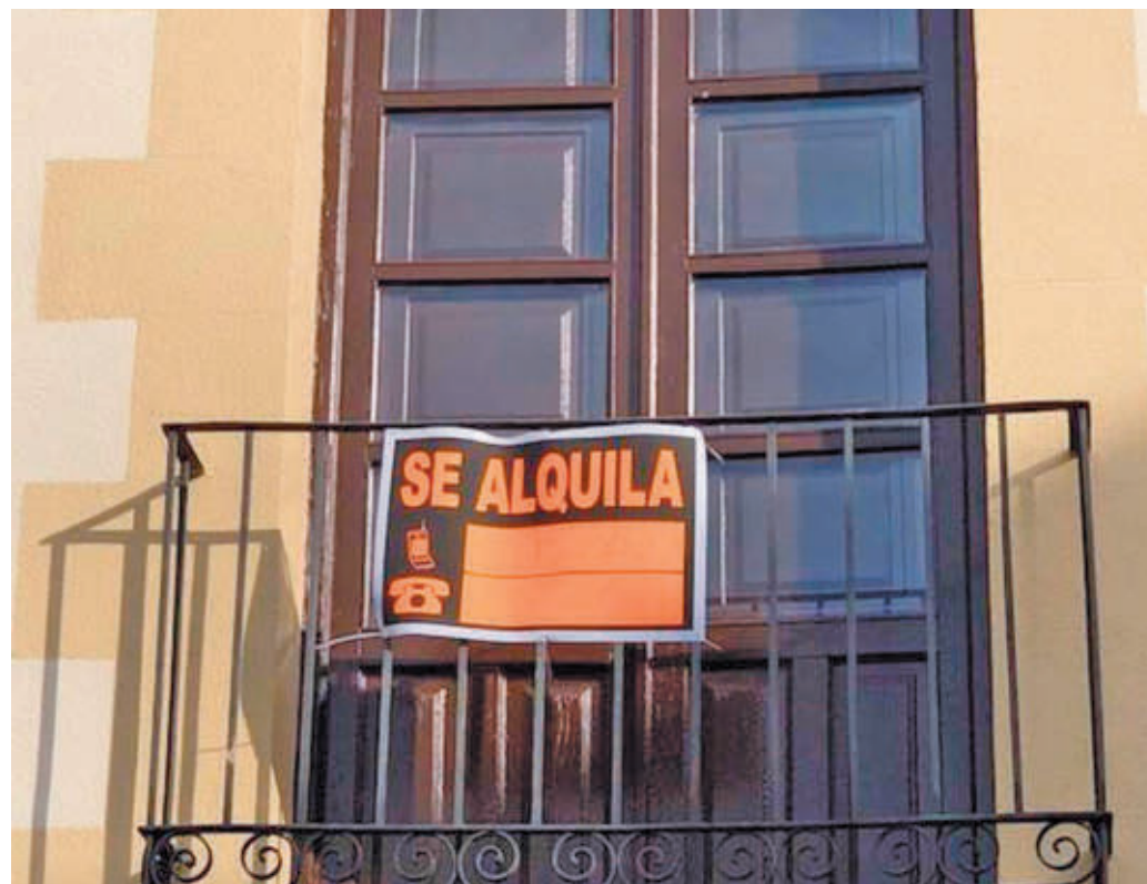
El alquiler supone más esfuerzo que la compra

Un estudio del portal inmobiliario Fotocasa revela el esfuerzo que tienen que hacer los arrendatarios para hacer frente a los pagos • En el caso de las personas que pagan una hipoteca, esta cifra se reduce hasta en 17 puntos