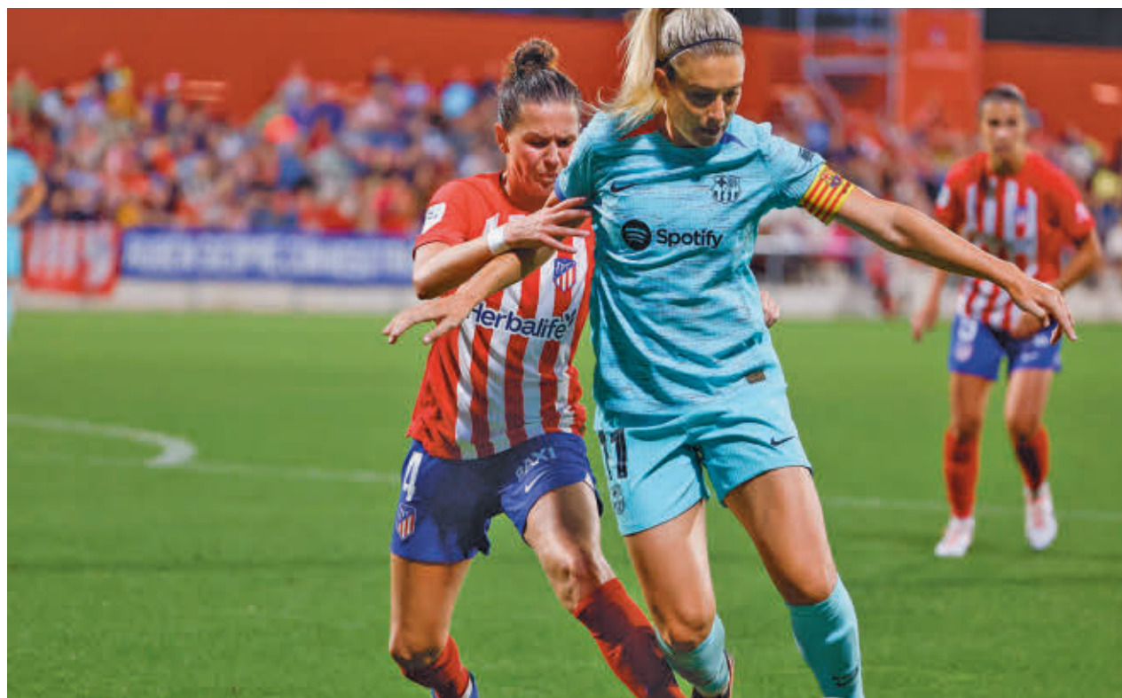
Imagen del partido disputado el 15 de octubre de 2023

El año pasado se dio un partido muy parejo que solo se decantó con gol de Alexia