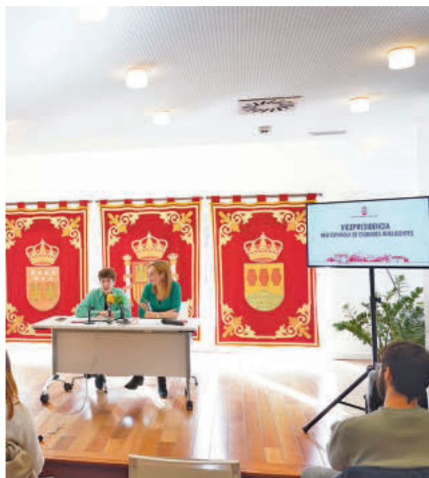
La alcaldesa lo anunció en rueda de prensa

Así lo ha dicho la primera edil tras poner en valor su reciente nombramiento como vicepresidenta de la Red Española de Ciudades Inteligentes (RECI) de la Federación Española de Municipios y Provincias (FEMP). Subraya la re-