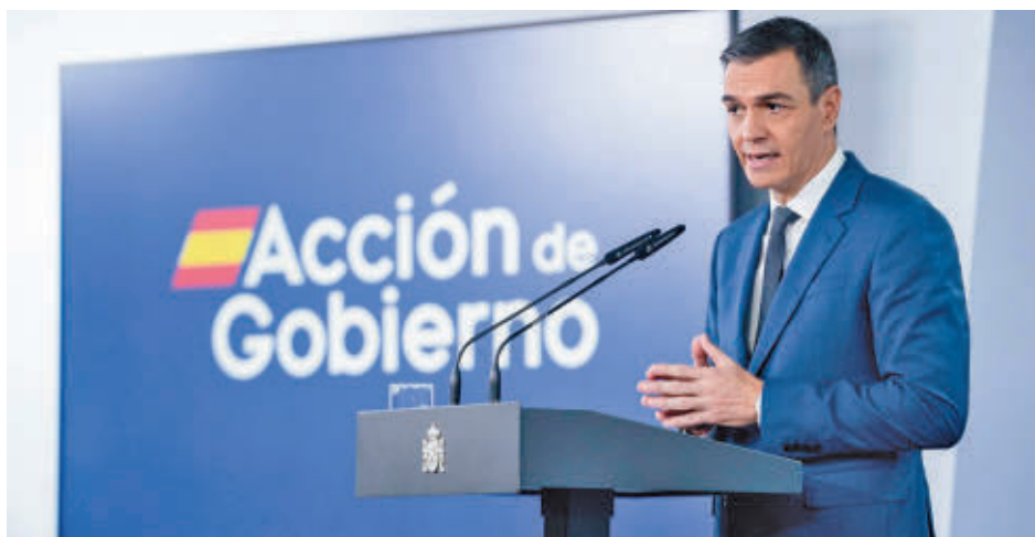
Pedro Sánchez, durante la presentación del plan

da, sin umbrales de renta. De esta forma, los afectados recibirán hasta 72.000 euros por casos de incapacidad; entre 20.000 y 60.000 para la reparación de viviendas; hasta 10.300 euros para cambiar o reparar muebles, electrodomésticos y enseres; y hasta 37.000 euros para reparar elementos de las comunidades de vecinos, como portales o