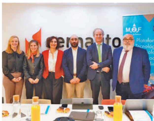
Reunión de los representantes del sector