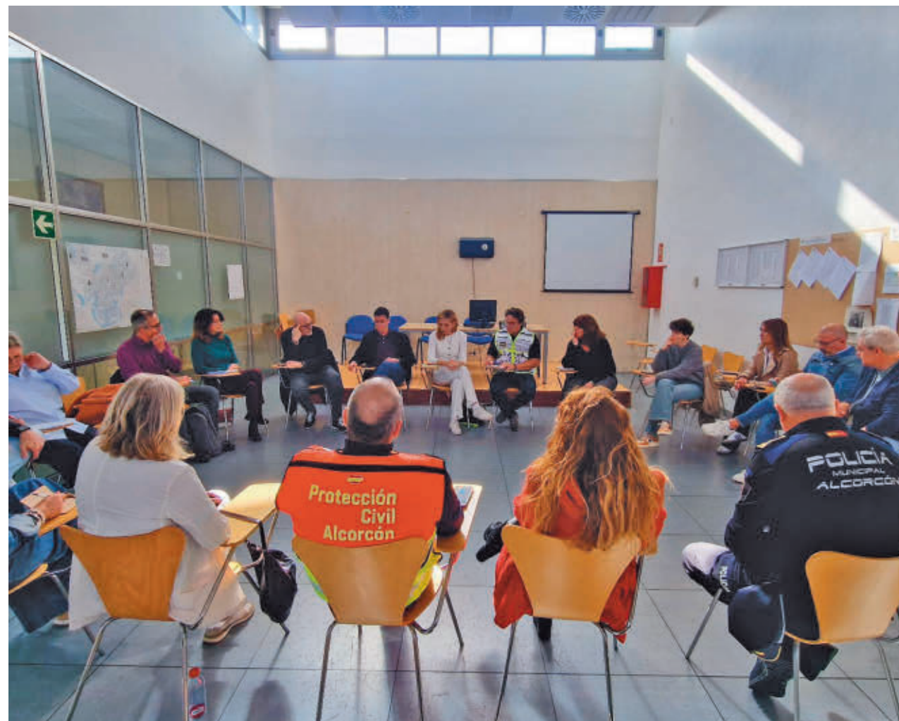
AYTO DE ALCORCÓN