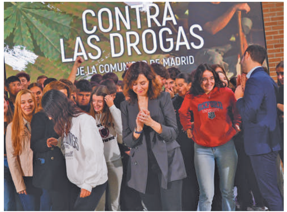
Isabel Díaz Ayuso, en la presentación del plan

rá un programa de prevención en centros educativos y se les dotará de materiales didácticos para concienciar a menores sobre su uso, se pondrá en marcha un nuevo plan de inspección, se llevarán a cabo actuaciones en zonas vulnerables y se lanzará la