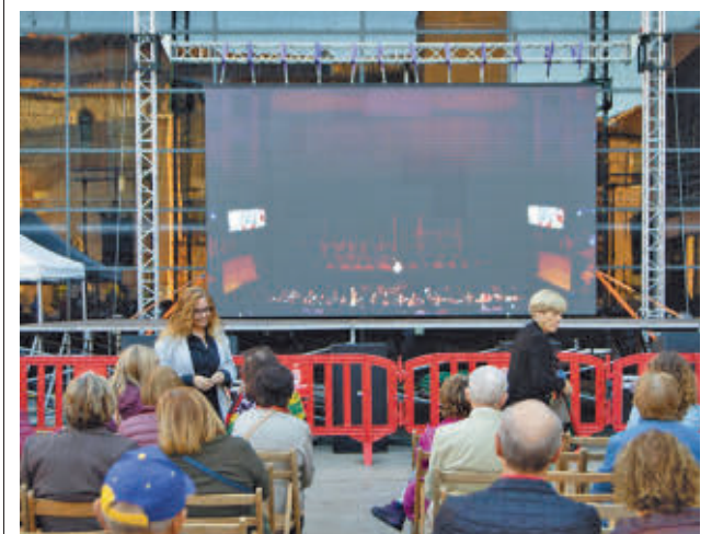
La grabación dejó ingresos en la ciudad