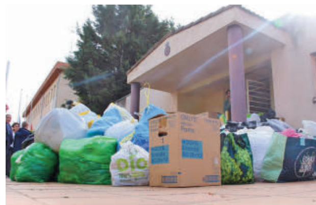
La recogida se hizo en Protección Civil

La ayuda permitió durante el fin de semana que saliesen con destino a Valencia hasta cinco camiones donados por Transgruma con alimentos y enseres entregados por los vecinos. Mientras, un contingente de voluntarios de Protección Civil se desplazó a Paiporta, una de las poblaciones más afectadas por el temporal. Según ha informado el Ayuntamiento, estos efectivos “se han desplazado hasta uno de los epicentros de la tragedia, en labores de auxilio y en el transporte de su-