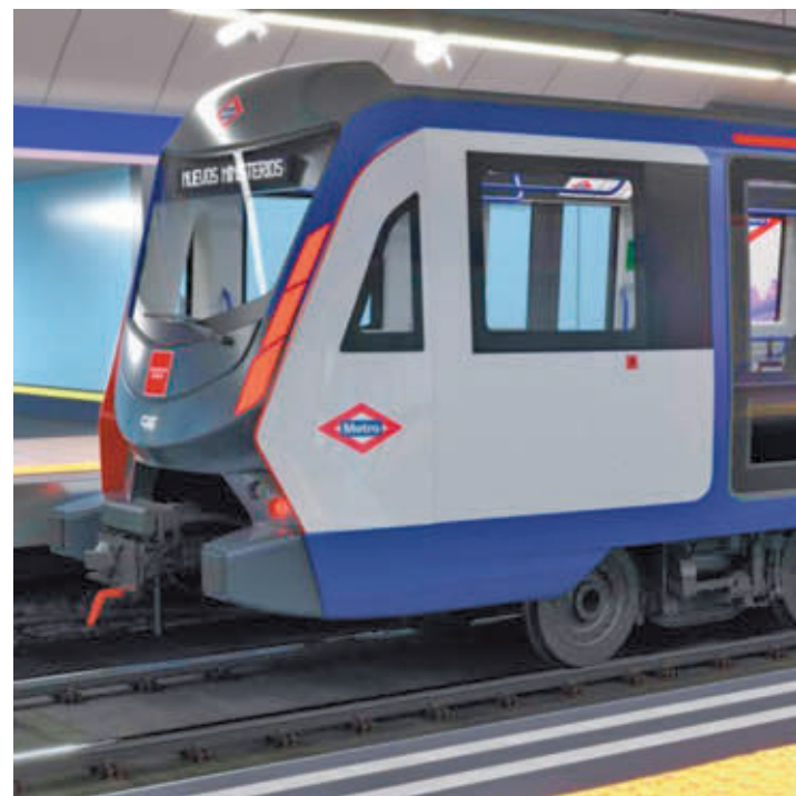
Uno de los trenes que circulará por la Línea 6

Pascual incidió en que serán más seguros y fiables, con tecnología “puntera”. En este sentido, se facilitará una mejor información al viajero gracias a la comunicación continua tren-tierra y dispondrán de novedades como el bucle inductivo, un sistema que facilita la percepción de la megafonía para personas con audífonos. También se mejorará la accesibilidad, ya que conta-