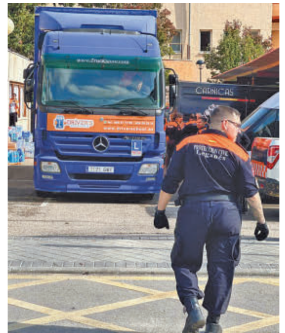
Salida de uno de los camiones