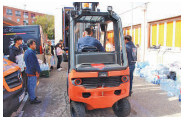
Carga de uno de los camiones que ha salido

ministros”, explicaron desde el Gobierno local.