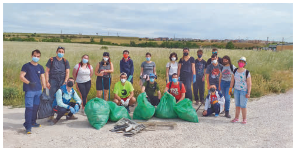
Voluntarios en Leganes