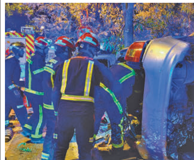
Vehículo siniestrado en Leganés

GenteMadrid.es Consulte la actualidad regional y local en nuestra página web