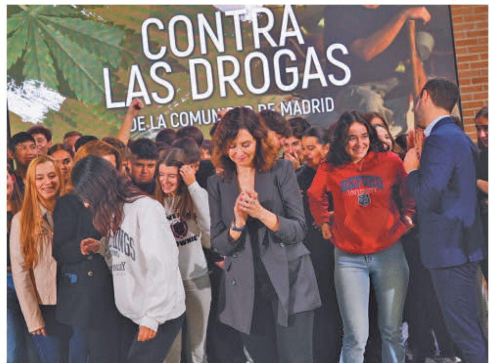
Isabel Díaz Ayuso, en la presentación del plan

rá un programa de prevención en centros educativos y se les dotará de materiales didácticos para concienciar a menores sobre su uso, se pondrá en marcha un nuevo plan de inspección, se llevarán a cabo actuaciones en zonas vulnerables y se lanzará la