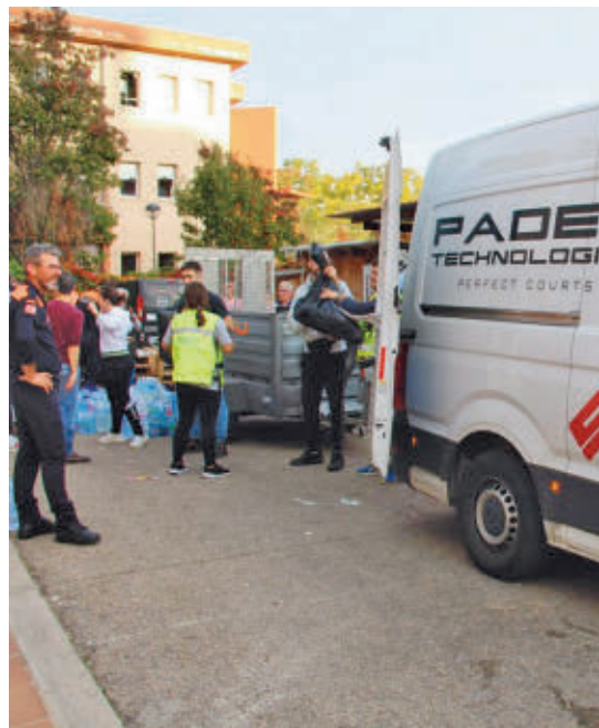
Se donaron toneladas de comida