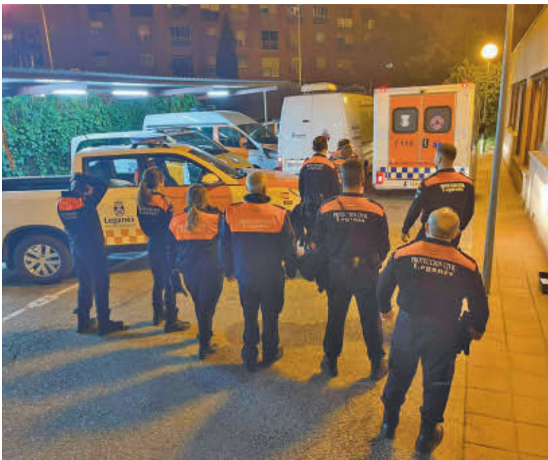
Voluntarios de Protección Civil