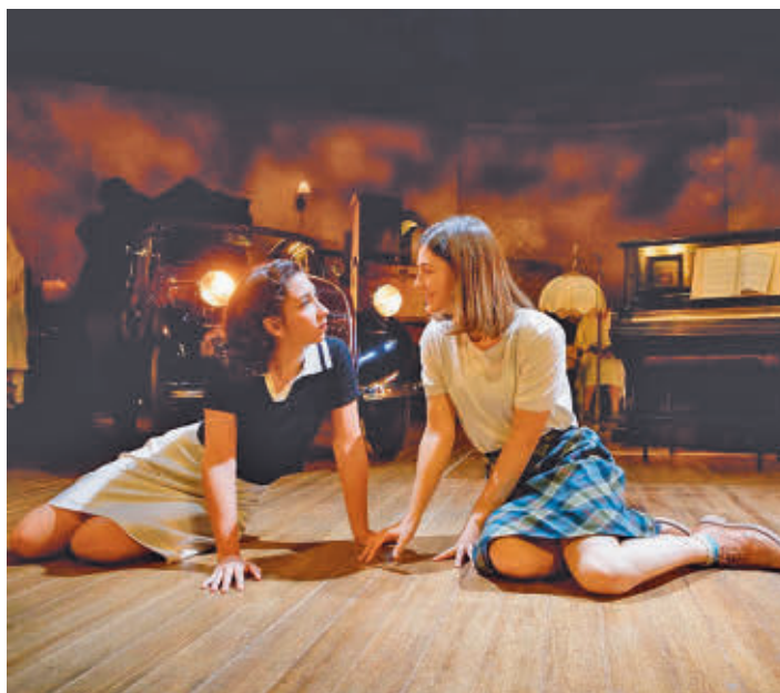
La obra se podrá ver hasta el 22 de diciembre CDN

A ntes de que la programación navideña condicione la programación cultural, la capital vuelve a ofrecer grandes reclamos para el público, especialmente en lo que se refiere a las artes escénicas. Un buen ejemplo de ello es 'Nada', una obra que acoge el Centro Dramático Nacional hasta el 22 de diciembre en el Teatro María Guerrero. Se trata de una adaptación de la novela de Carmen Laforet que se trasladó al cine en 1947, pero que no se había