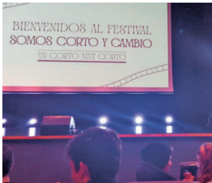
El evento es impulsado y organizado por los alumnos del instituto

El IES Luis Buñuel organiza la tercera edición del evento • Será en el Teatro Villa de Móstoles los días 10, 11 y 12 de diciembre • Alumnos y profesionales se reunirán para intercambiar ideas