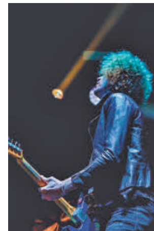
Concierto de 2023

Entre la programación hay artistas como Coque Malla, Pedro Guerra, La Bien Querida, Marwán, Hard GZ, Rodrigo Cuevas, Kiko Veneno, Ángeles Toledano, Anni B Sweet o El Canijo de Jerez, entre otros muchos. En esta "nueva década" el festival tendrá 9 sedes, 8 en Madrid y una en