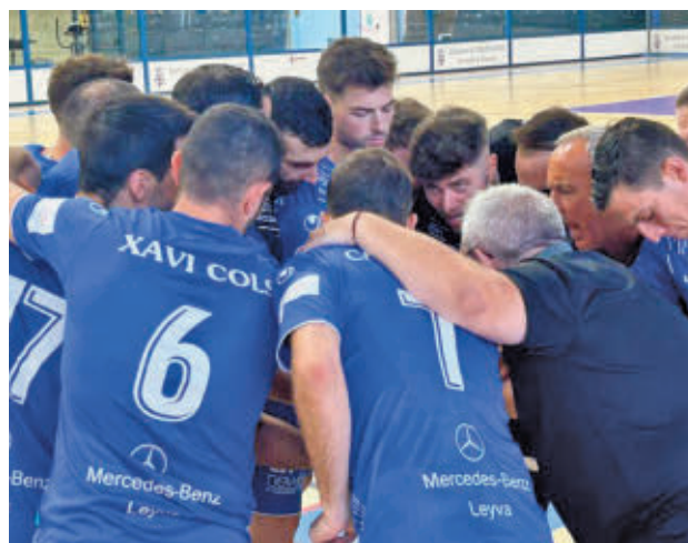
El conjunto azulón sigue invicto en su temporada liguera

Con esta victoria, los azulones mantienen su pleno de victorias y siguen líderes. En la próxima jornada, se enfrentan en casa al Movistar Inter FS B, tercer clasificado.