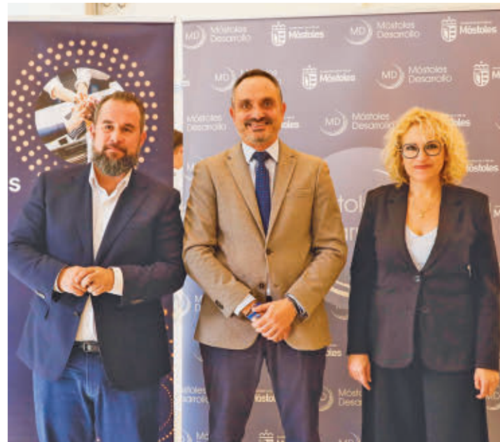
El alcalde asistió a la sede de Móstoles Desarrollo para la presentación

Esta iniciativa, impulsada por el Ayuntamiento, Móstoles Desarrollo y SostenibleS-