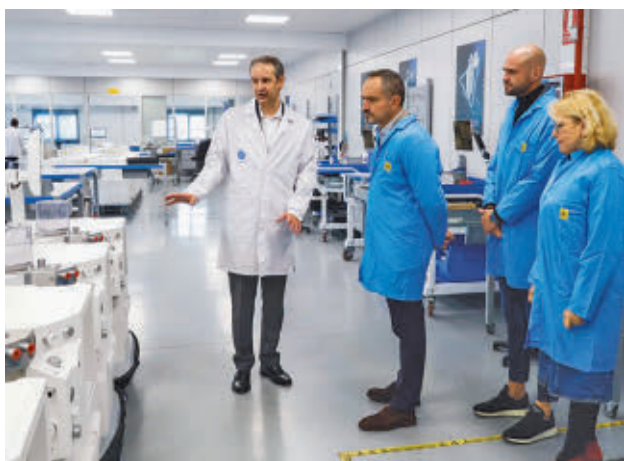
La empresa es pionera en la fabricación de equipos médicos