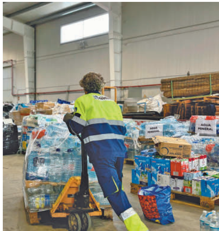
Móstoles recogió más de 150 palés de enseres de primera necesidad

Gracias a la colaboración de las peñas de Móstoles y numerosos vecinos, la campaña logró recoger más de 150 palés de artículos. En total, más de 13.500 personas