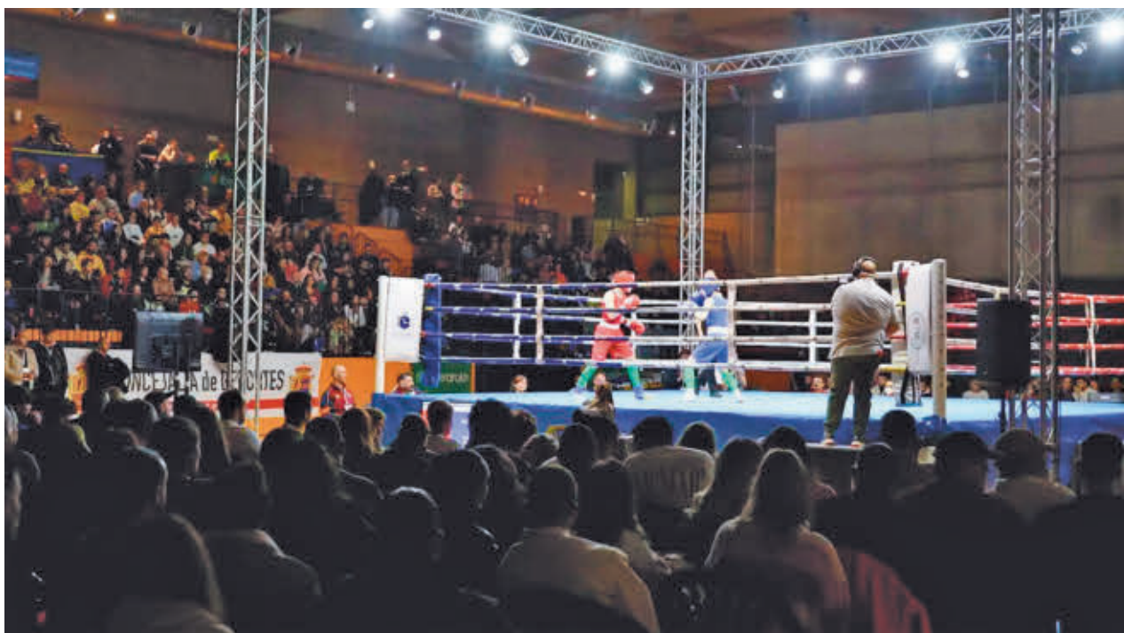
En estos últimos meses, Móstoles ha acogido varias competiciones de boxeo y Artes Marciales Mixtas