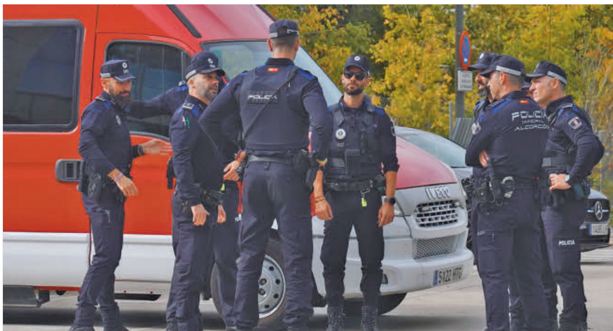
El Consistorio continúa canalizando la ayuda a los municipios y familias afectadas por la DANA AYUNTAMIENTO DE ALCORCÓN