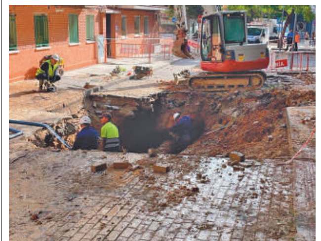
Un momento de las reparaciones

Por edades, las mujeres son quienes mantienen la cifra de desempleo más alto, con 4.374 paradas frente a los 2.908 hombres. En este sentido, desde el Consistorio han destacado que "el paro ha descendido en 193 en personas mayores de 45 años, 177 en el tramo de 24 a 44 años y 94 en menores de 25".