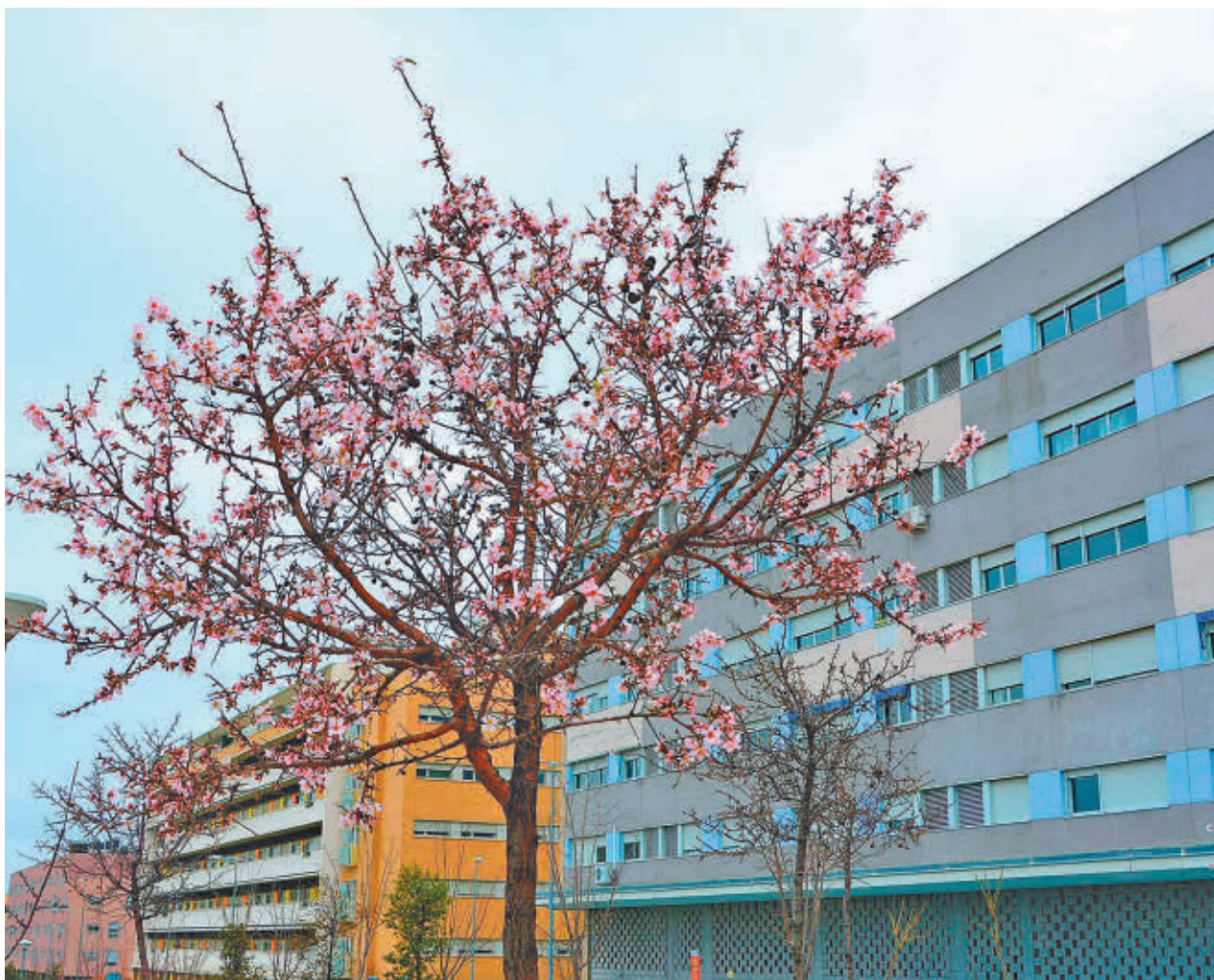
AYTO DE ALCORCÓN