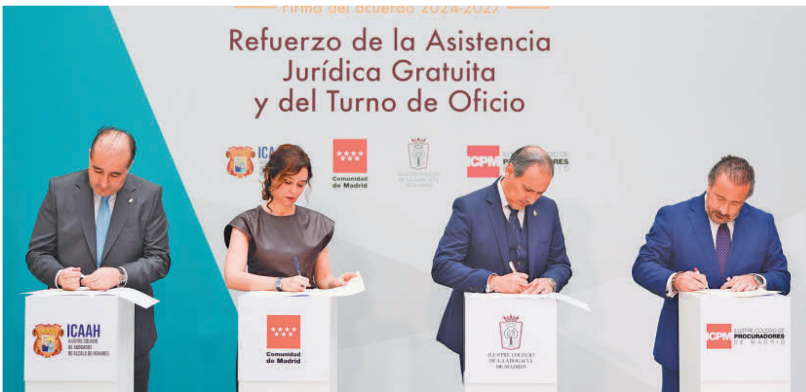
Isabel Díaz Ayuso firma el convenio con los representantes de los colegios de abogados