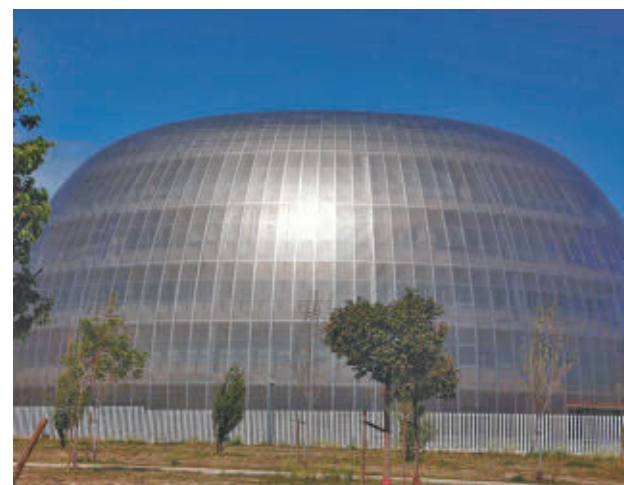
Palacio de la Justicia de Madrid