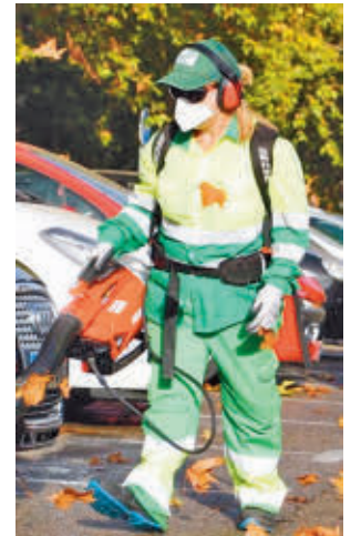
Operario en Arganda

"Implicaremos a una gran cantidad de recursos municipales; hemos diseñado un plan de trabajo con el que actuar diariamente en Arganda para reducir el efecto de la caída de la hoja", ha destacado el alcalde de la localidad,