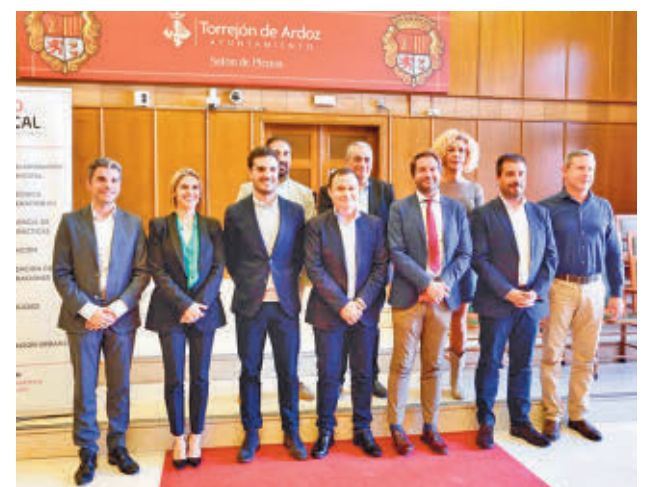
Representantes de los ayuntamientos

Además, se ha puesto de relieve la transformación que han generado los proyectos impulsados a través de fondos comunitarios "convirtiéndolos en más verdes, más inclusivos y digitales y, en definitiva, en realidades de las que puede disfrutar hoy el conjunto de la ciudadanía".