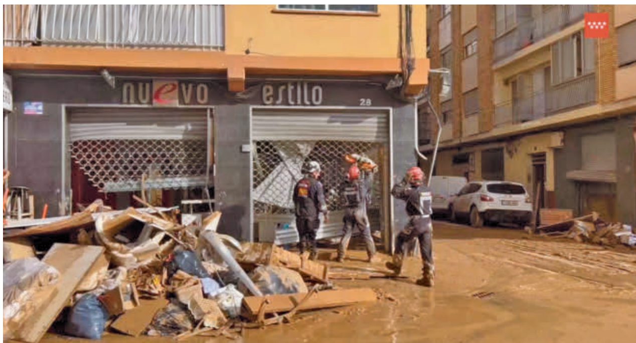
Efectivos del Ericam trabajan en la zona afectada por la DANA