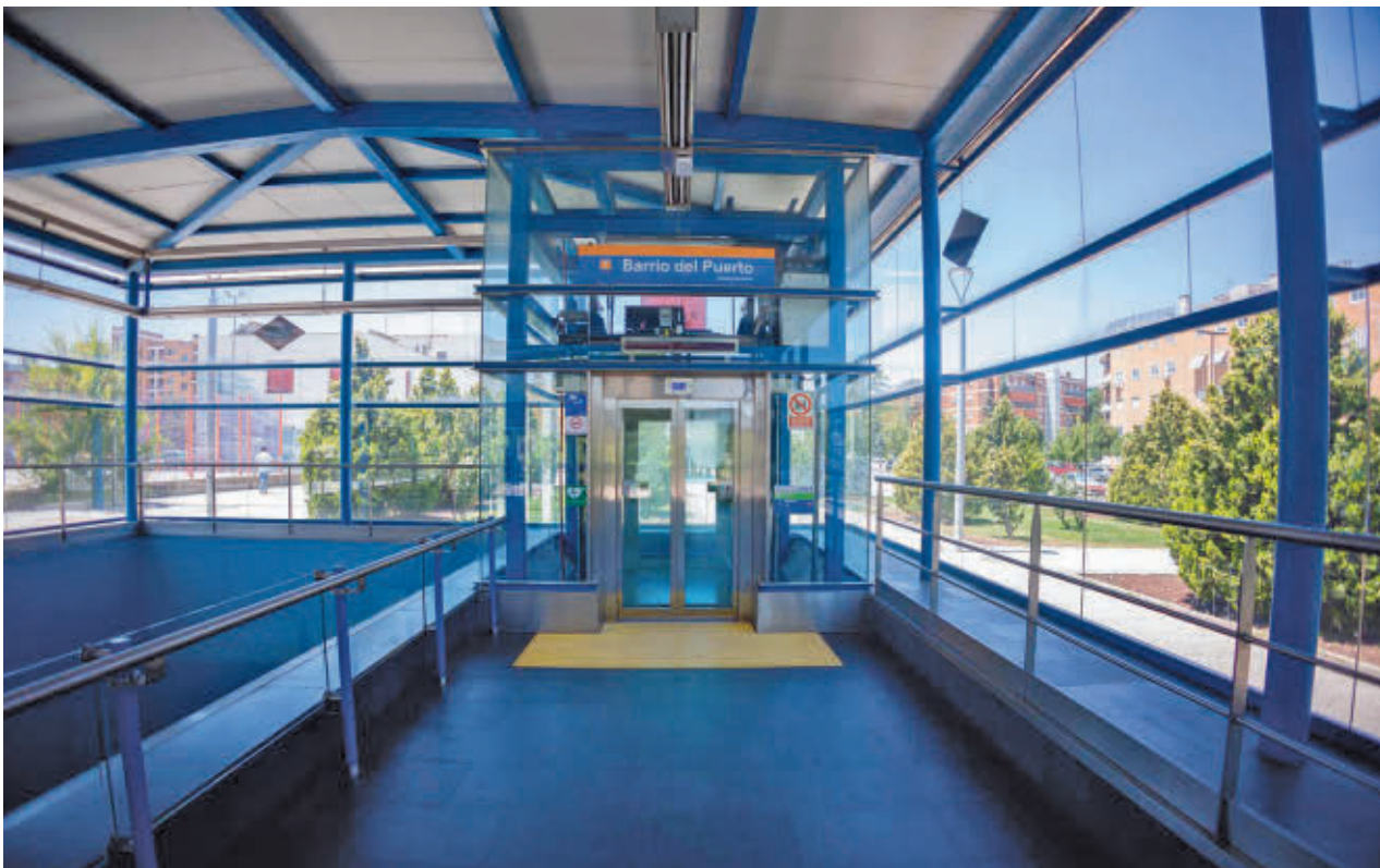
Estación de Metro de Barrio del Puerto, en Coslada