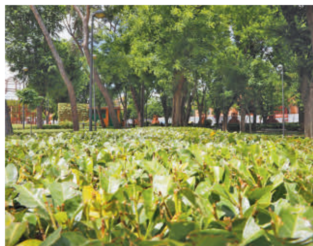
Se llevarán a cabo cortes de tráfico por la poda

Los trabajos también afectarán a varias líneas de autobús como la L-1, la L-3A, la L-6, la 441, la 448, la 450, la 455 y la 462.