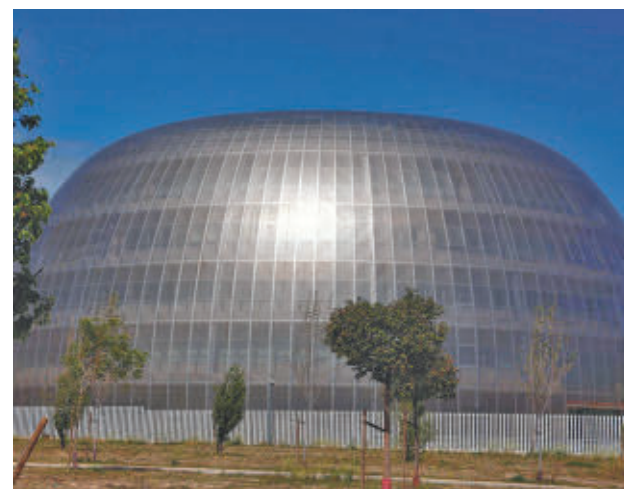
Palacio de la Justicia de Madrid