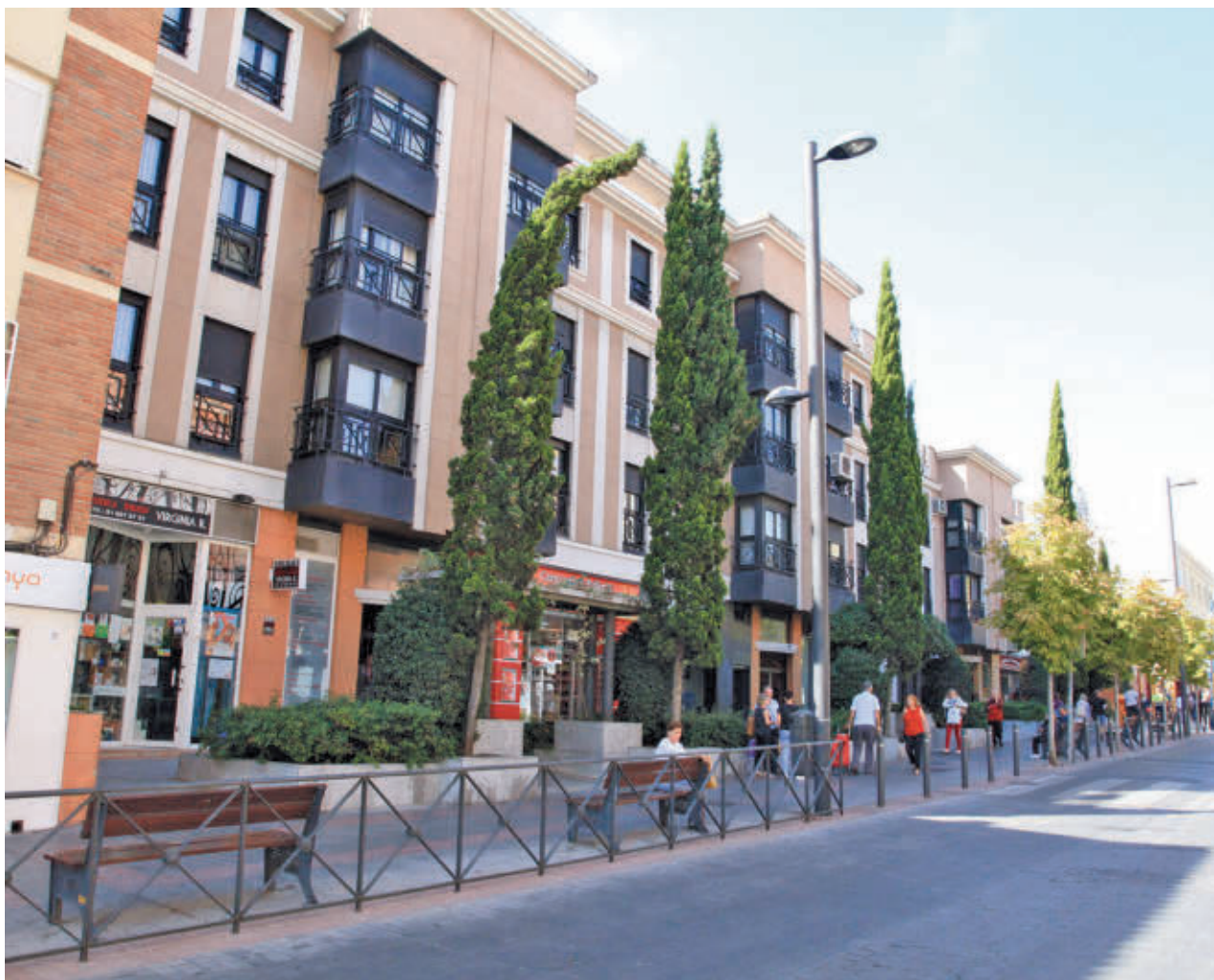
AYTO DE GETAFE