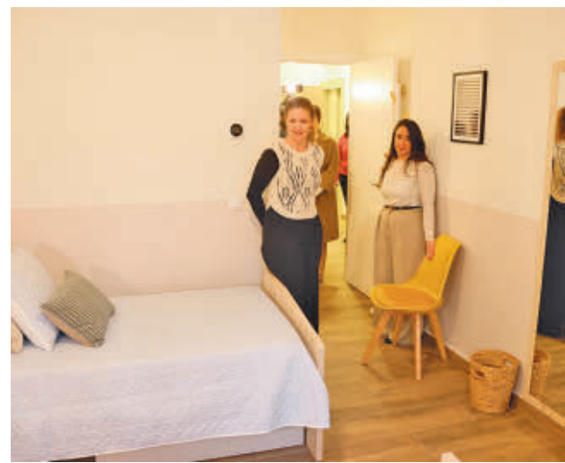
La consejera visitó las instalaciones