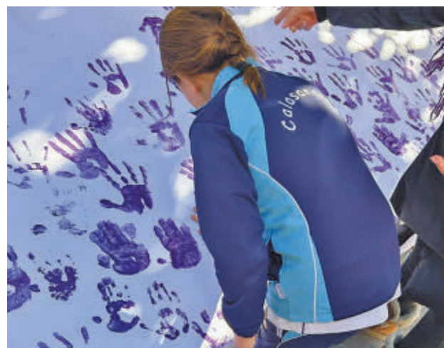
Actividades realizadas en 2023 DELEGACIÓN DE MUJER E IGUALDAD

día antes. El jueves 21, a las 18:30 horas, los vecinos saldrán a la calle en una manifestación reivindicativa que recorrerá el tramo que va de la Plaza de España hasta la plaza del Ayuntamiento, pasando por las calles General Palacio y Madrid. Pretende ser un homenaje a las víctimas de la violencia machista, y por ello a su llegada se leerá un manifiesto.