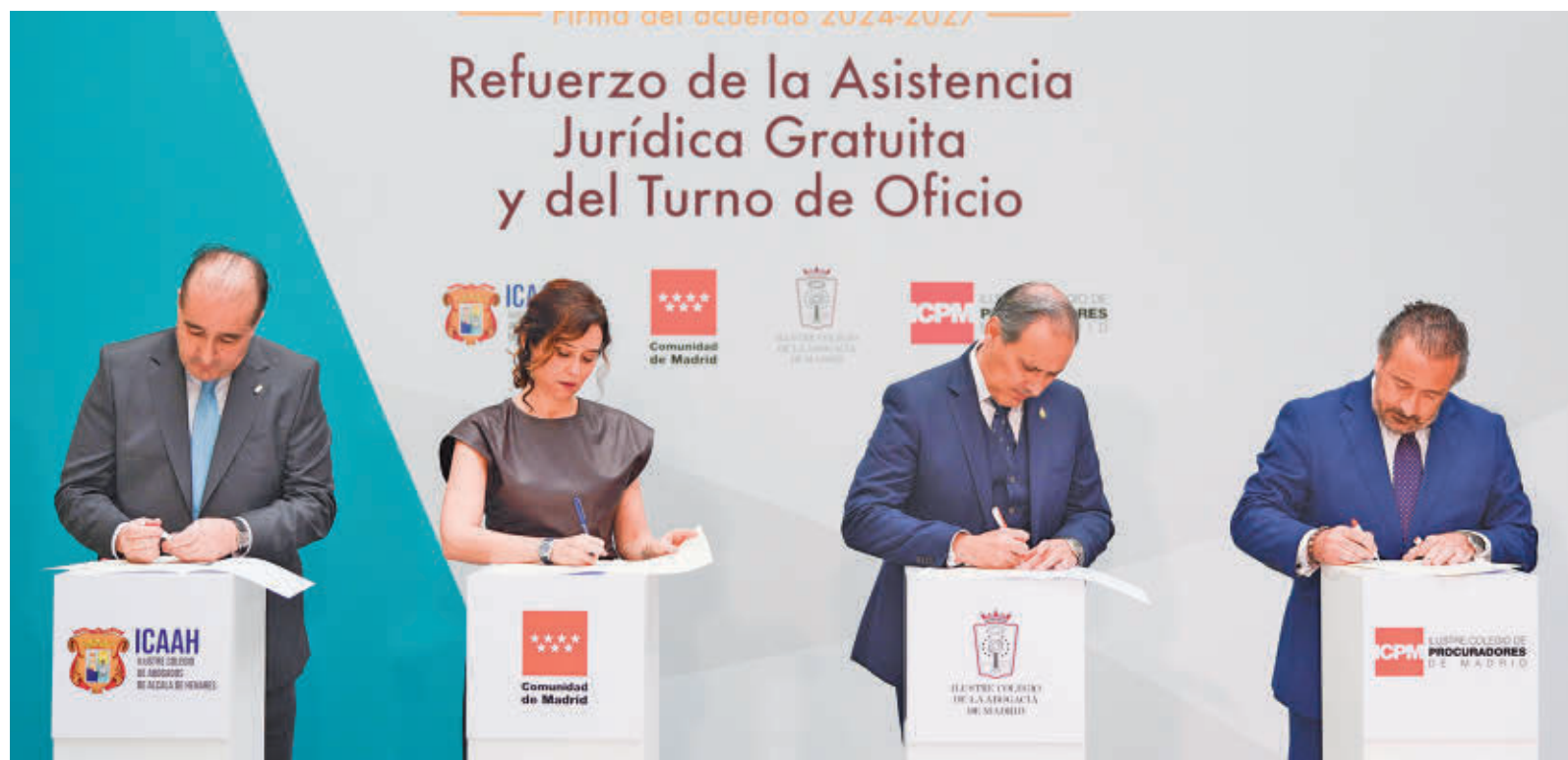
Isabel Díaz Ayuso firma el convenio con los representantes de los colegios de abogados