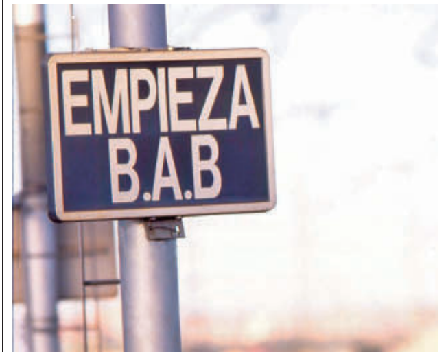
Bloqueo Automático Banalizado (BAB) ADIF

Además, el despliegue del sistema BAB ha conllevado la renovación de las instalaciones de seguridad asociadas a la señalización en el tramo, con la modificación y sustitución de enclavamientos electrónicos, aquellos que permiten regular los itinerarios de los trenes.