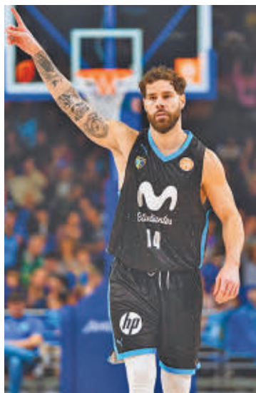
Nuevo triunfo colegial

Los dos equipos madrileños ocupan la segunda y la tercera plaza, tras el San Pablo Burgos