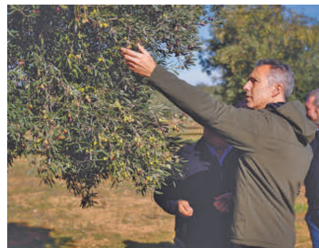
Novillo, en la recogida de la aceituna

da (DOP) Aceite de Madrid fue reconocido por la Unión Europea en abril del año pasado y hasta el momento se han inscrito diez marcas de ocho municipios: Aljamo (Arganda del Rey); Thermeda Oleum (Tielmes); Frutos Verdes de Posito y Valleherboso (Villarejo de Salvanés); Molino de Titulcia (Titulcia); O Laguna de Blas (Villaconejos); Los Verdinales (Carabancha); Apis Aurelia (Colmenar de Oreja); Alma de Laguna (Villaconejos), y La Lebrera (Valdilecha), algunas de ellas de carácter extra ecológico.