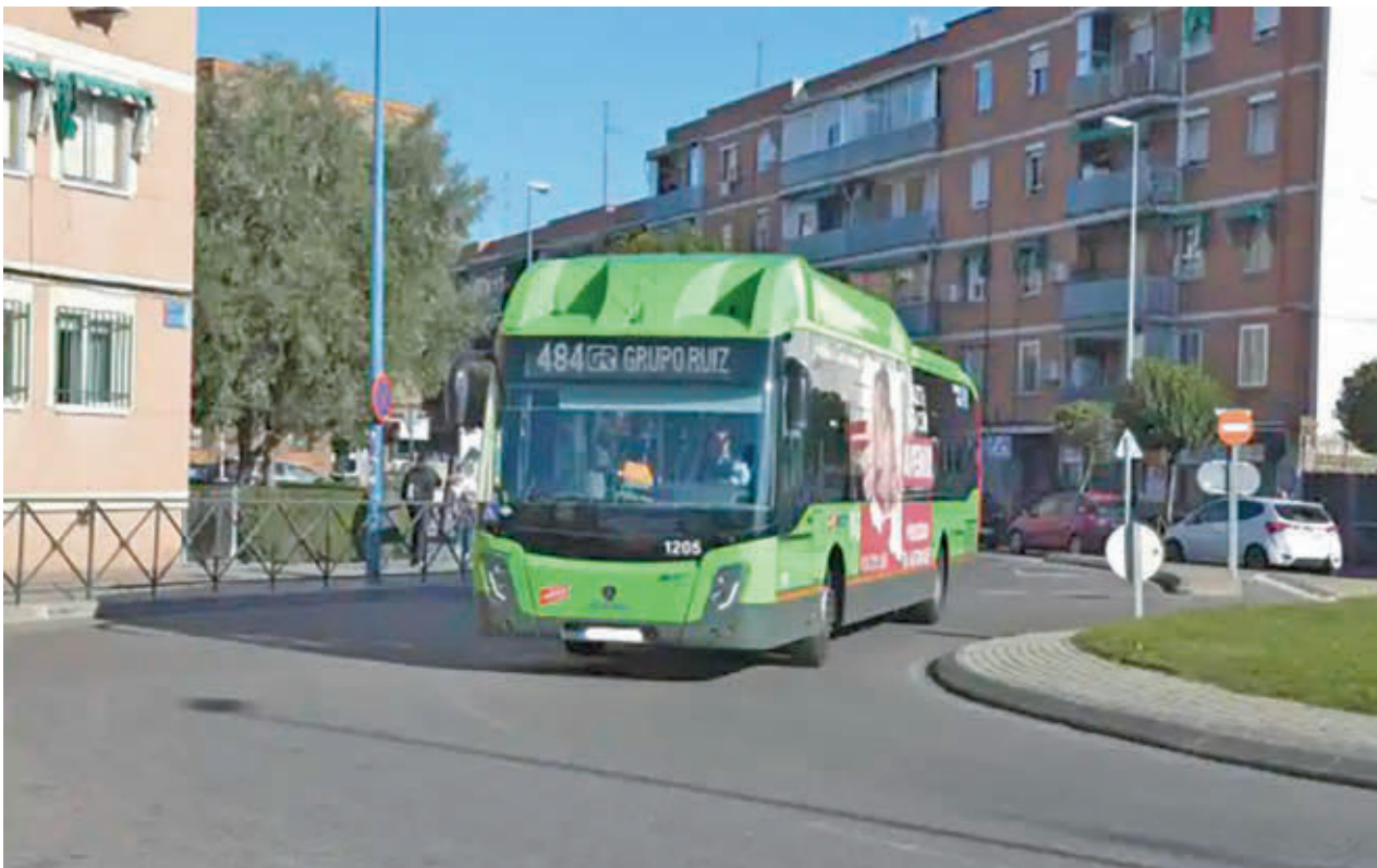
Uno de los autobuses de la Línea 484 que conecta Leganés con la capital