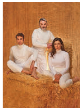
Elenco de 'Camino al zoo'

» Teatro José Monleón. Sábado 16, 20 horas. Acceso gratuito