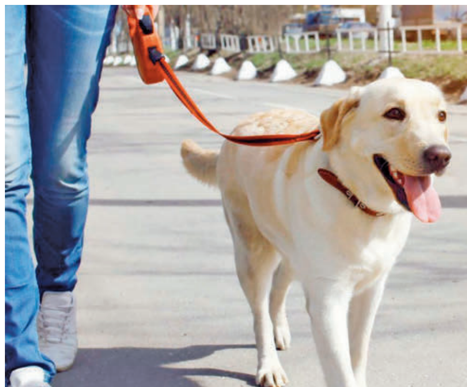
Los perros deben ir debidamente sujetos con una correa

Por la noche, a las 22:30 horas, se celebrará para todos los asistentes una ‘queimada’ popular. El domingo, será la despedida y durante la noche tendrá lugar el ‘magosto’, el tradicional reparto de castañas asadas.