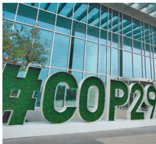
La COP29 se celebra en Azerbaiyán

EL PERIÓDICO GENTE NO SE RESPONSABILIZA NI SE IDENTIFICA CON LAS OPINIONES QUE SUS LECTORES Y COLABORADORES EXPONGAN EN SUS CARTAS Y ARTÍCULOS