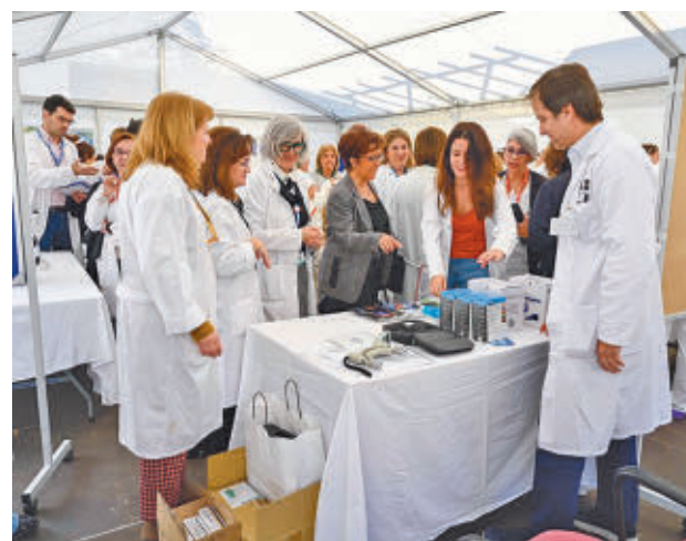
Primera sesión del VacunaFest

Dentro del VacunaFest se han creado cuatro áreas temáticas: vacunación a lo largo de