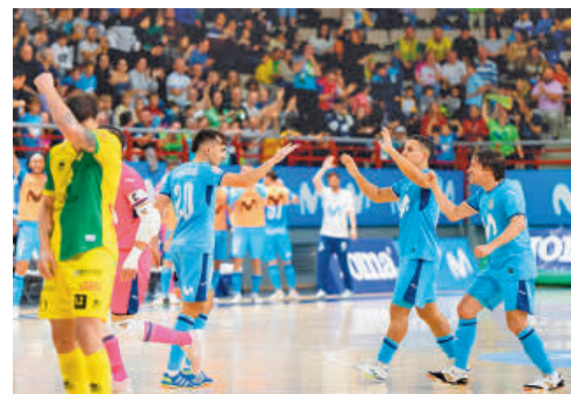
Inter sumó otra victoria a costa de Jaén (6-2)

Una derrota (3-0) ante el Barça condena al Madrid Chamberí a ocupar la última plaza antes de recibir este sábado (19 horas) al Haro.