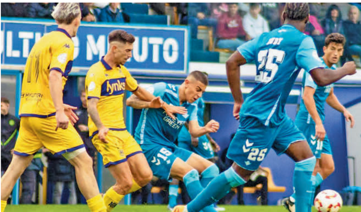
Como visitante, el equipo alfarero solo ha sumado dos puntos hasta la fecha AD ALCORCÓN