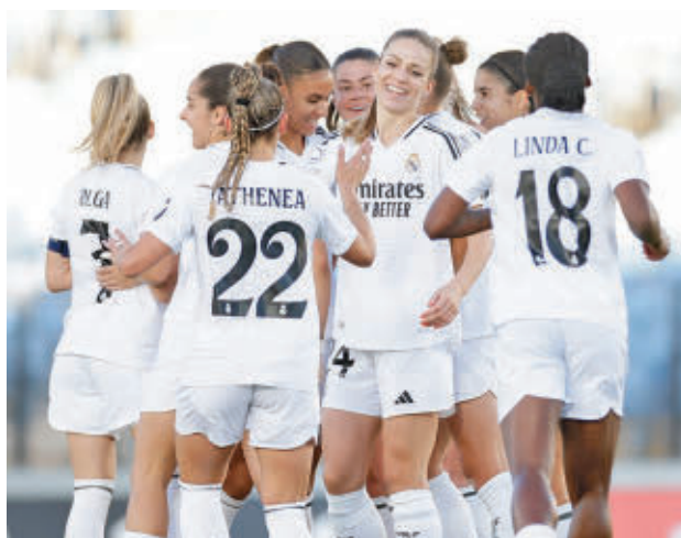
El Real Madrid es segundo en la tabla R. MADRID FEMENINO

Respecto a los otros equipos madrileños, el Madrid CFF recibe este sábado a un rival directo, el Eibar, tras su triunfo ante el Sevilla, precisamente el próximo rival del Atlético (domingo, 16 horas).