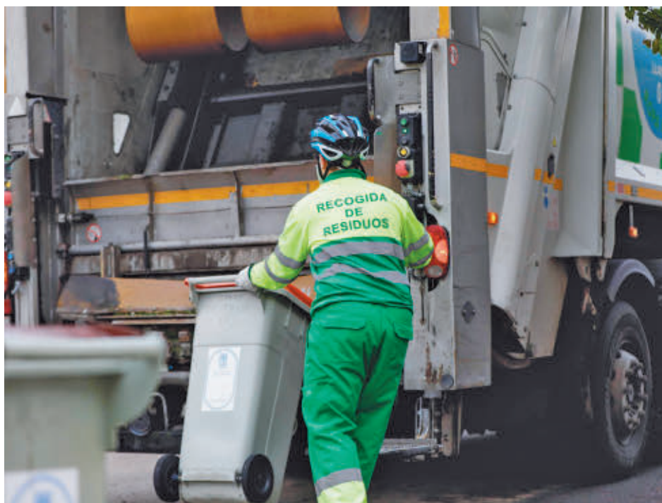
Recogida de residuos en Madrid E. P.

En cuanto a la recogida per cápita, la Comunidad de