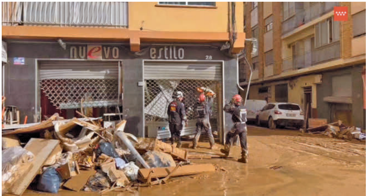
Efectivos del Ericam trabajan en la zona afectada por la DANA