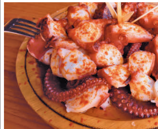
El pulpo y el marisco serán las estrellas