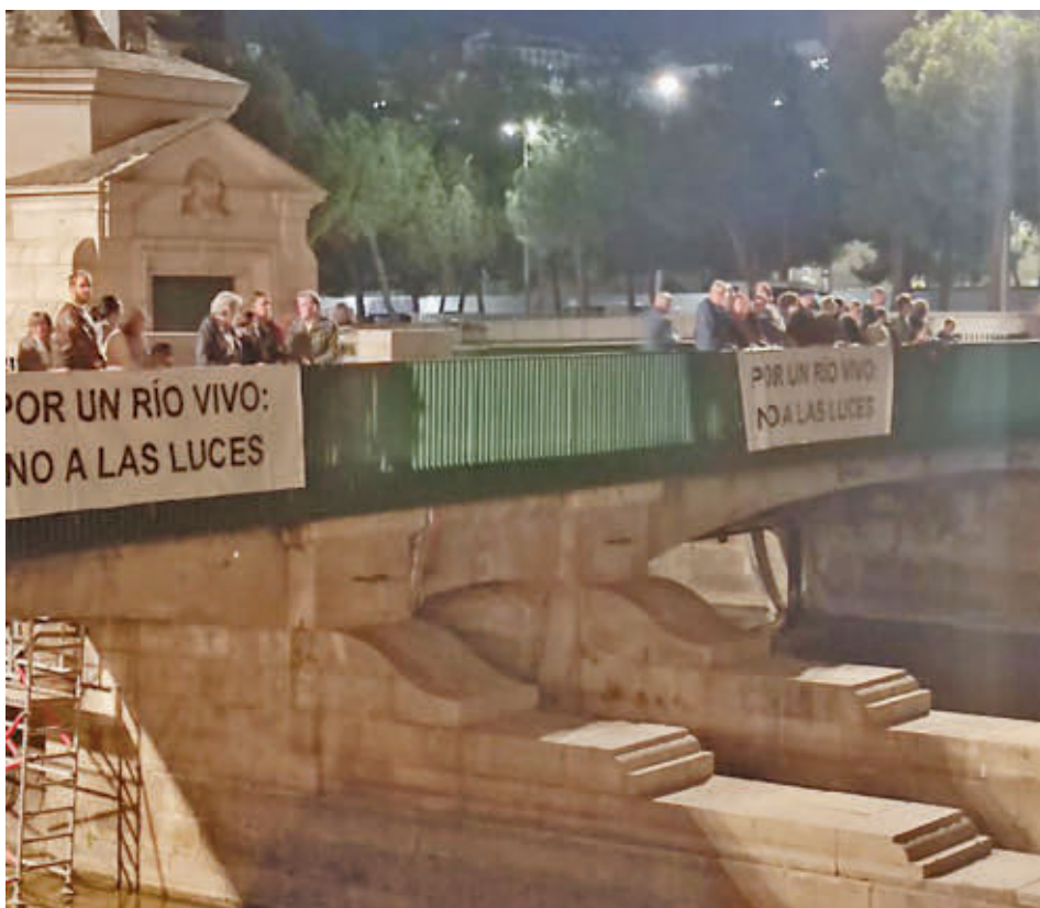
La protesta vecinal del pasado 23 de octubre