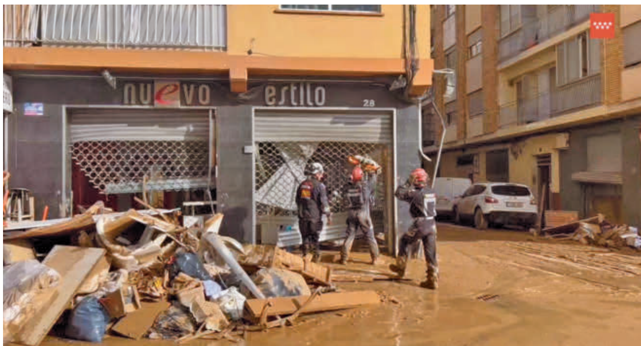
Efectivos del Ericam trabajan en la zona afectada por la DANA