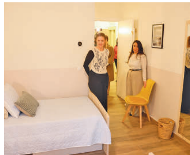
La consejera visitó las instalaciones