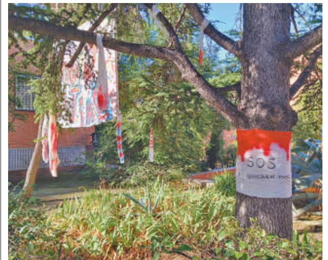
Uno de los carteles vecinales en defensa de la zona estancial

Su último acto de protesta tuvo lugar el pasado jueves 14 de noviembre en el Pleno de la Junta de Moncloa-Aravaca, donde volvieron a mostrar su rechazo a los planes de la citada empresa.