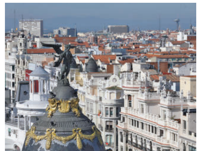
La cúpula del edificio Metrópolis, con la calle Alcalá al fondo