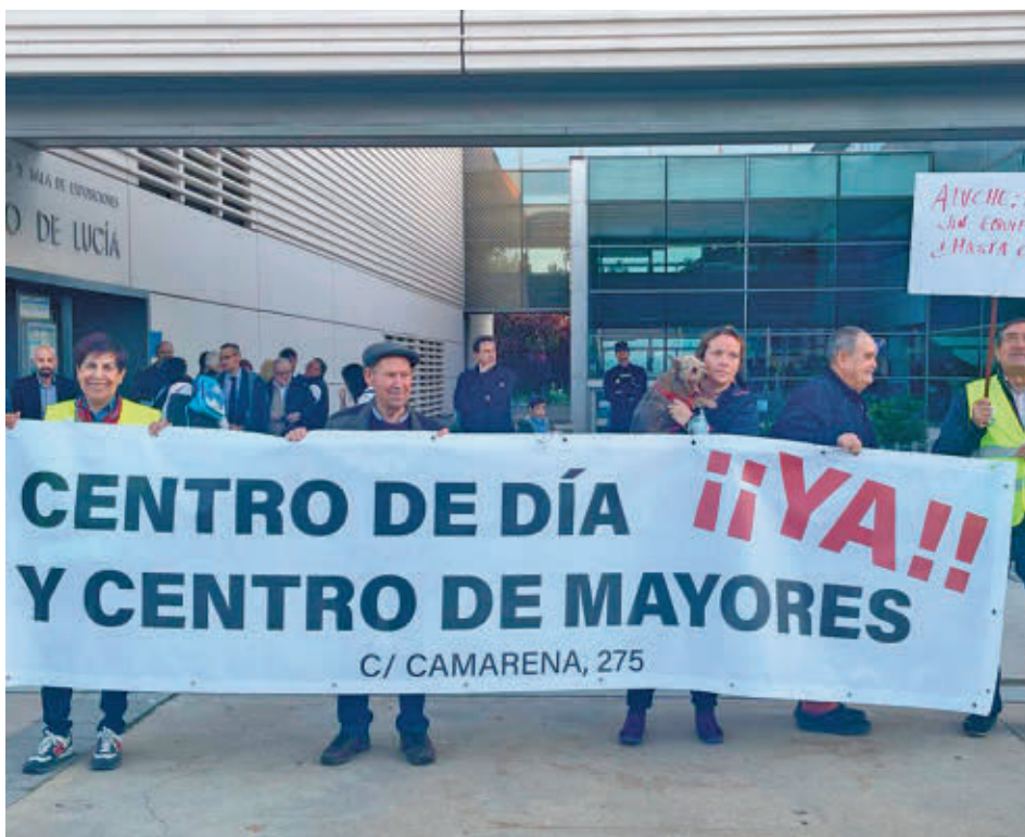
La manifestación finalizó a las puertas de la Junta Municipal de Latina