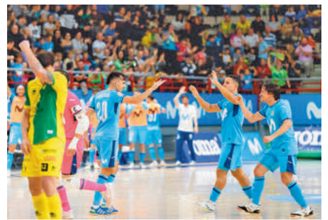
Inter sumó otra victoria a costa de Jaén (6-2)

Una derrota (3-0) ante el Barça condena al Madrid Chamberí a ocupar la última plaza antes de recibir este sábado (19 horas) al Haro.