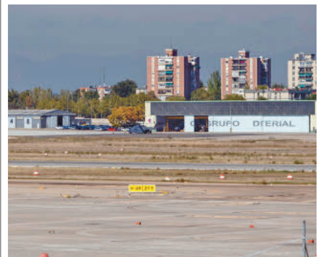
Una de las pistas de aterrizaje del aeródromo