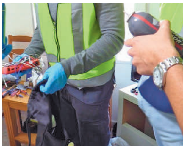
Algunos de los artículos decomisados en el operativo

ción comenzó tras tener conocimiento de varias denuncias, la primera el 17 de septiembre, en la calle de Cerecinos y aledañas, con coches que amanecían con pintadas, lunas fracturadas y limpiaparabrisas rotos. Incluso hubo dos de ellos calcinados. Al cierre de edición, se desconoce su motivación, aunque podría estar relacionada con algún trastorno mental.