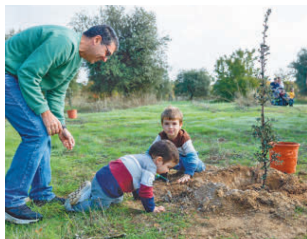
La plantación en el Parque Forestal Adolfo Suárez

drina un árbol' pretende vincular cada recién nacido a cada uno de los árboles plantados, "estableciéndose una conexión simbólica entre los primeros años de vida del niño y el crecimiento del árbol", dicen desde el Consistorio. Cada ejemplar está apadrinado por un menor, cuyo nombre figura en una placa junto un QR con información sobre la especie.