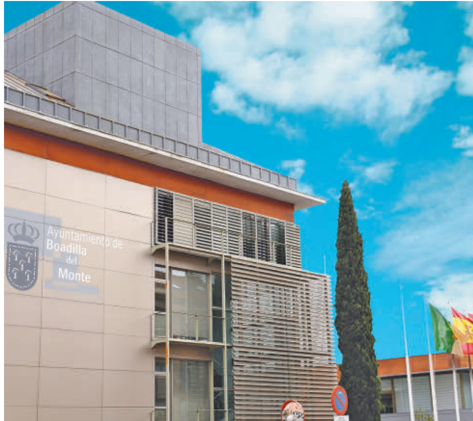
Ayuntamiento de Boadilla del Monte

LOS MENORES DE TRES AÑOS TENDRÁN UNA AYUDA A LA MANUTENCIÓN