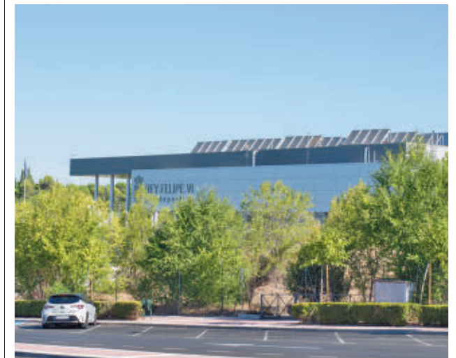
El Centro Deportivo Rey Felipe VI

En el Centro Deportivo Ángel Nieto, que ya contaba con paneles, se está ampliando la instalación para cubrir la demanda de autoconsumo durante todo el día, con una inversión de 211.337,39 euros. Lo mismo sucede en el Condesa de Chinchón, donde la actuación cuenta con un presupuesto de 248.062,10 euros. Por último, en la piscina cubierta municipal, ante la imposibilidad de hacerlo en la cubierta, se instalarán en las marquesinas para vehículos que se están colocando en el aparcamiento con un gasto de 194.732,21 euros.