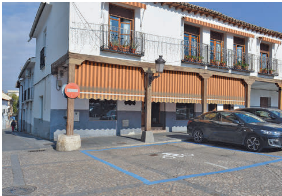
Zona de aparcamiento para motos en la plaza de la Constitución

En concreto, hay 70 nuevos huecos para motos en la avenida de Andalucía y en puntos de las calles Estrella de Elola, Cristo de la Salud, Gre-