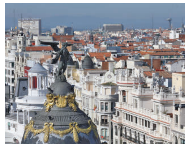
La cúpula del edificio Metrópolis, con la calle Alcalá al fondo