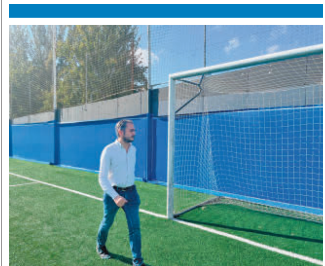
El concejal visitó las obras

La actuación global en la línea C-3 se ha desarrollado en los 38 kilómetros que discurren por las estaciones de Villaverde Bajo, San Cristóbal Industrial, Getafe Industrial, Pinto, Valdemoro, Ciempozuelos y Aranjuez. Se espera que la actuación reduzca las incidencias que se producen en el trayecto.