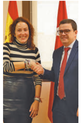
Firma del contrato

El Ayuntamiento de San Sebastián de los Reyes ha firmado con la UTE Urbaser Pade-casa el nuevo contrato de limpieza viaria y recogida de residuos, que cuenta con una cifra histórica, hasta 116 millones de euros. Este contrato, que recoge todas las necesidades actuales y demandas históricas que la ciudad tiene en esta materia, contempla la renovación de los más de 1.800 contenedores de residuos y la ampliación del número de elementos para atender otras zonas, además de la