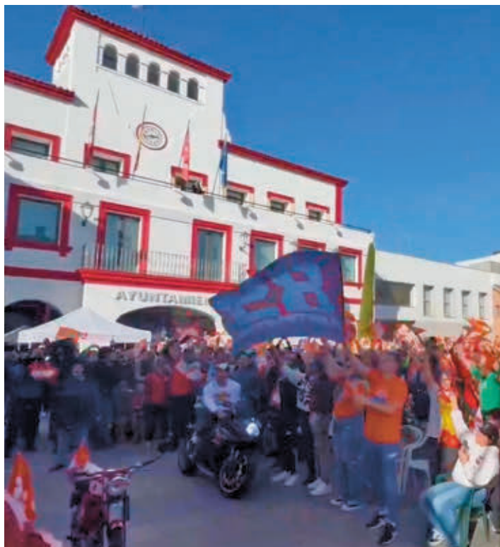
Imagen de la plaza de la Constitución el pasado domingo

En el día D, Martín Almuogera mostró sangre fría para minimizar los riesgos. Mientras Bagnaia, su gran rival por el título, se marchaba en pos de una nueva victoria, el piloto de San Sebastián de los Reyes se agarró a la tercera posición para sumar un nuevo podido en su carrera y, lo que era más importante, alcan-