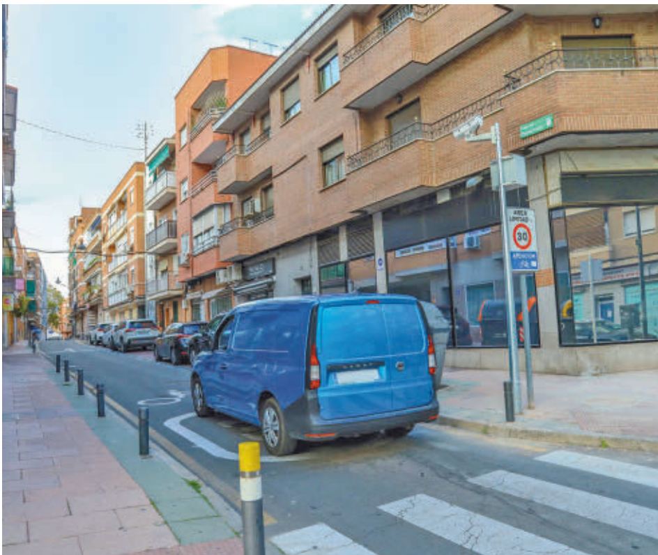
Tránsito de vehículos en la calle del Empecinado