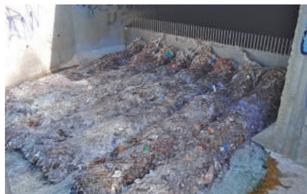
Toallitas acumuladas en una depuradora

danía de las consecuencias que acarrea utilizar el retrete como cubo de basura, un hábito que puede causar serios daños tanto en las instalaciones interiores de las viviendas como en la red de alcantarillado, especialmente en depuradoras, infraestructuras hidráulicas vitales para la salva-