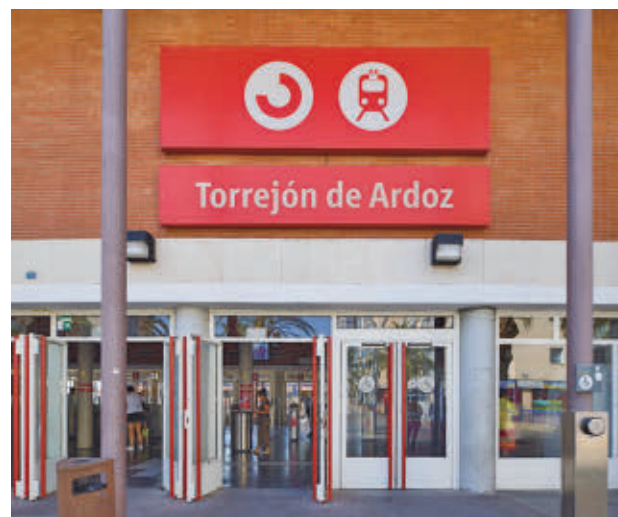
Estación de Cercanías de Torrejón de Ardoz

Consulte la actualidad regional y local en nuestra página web