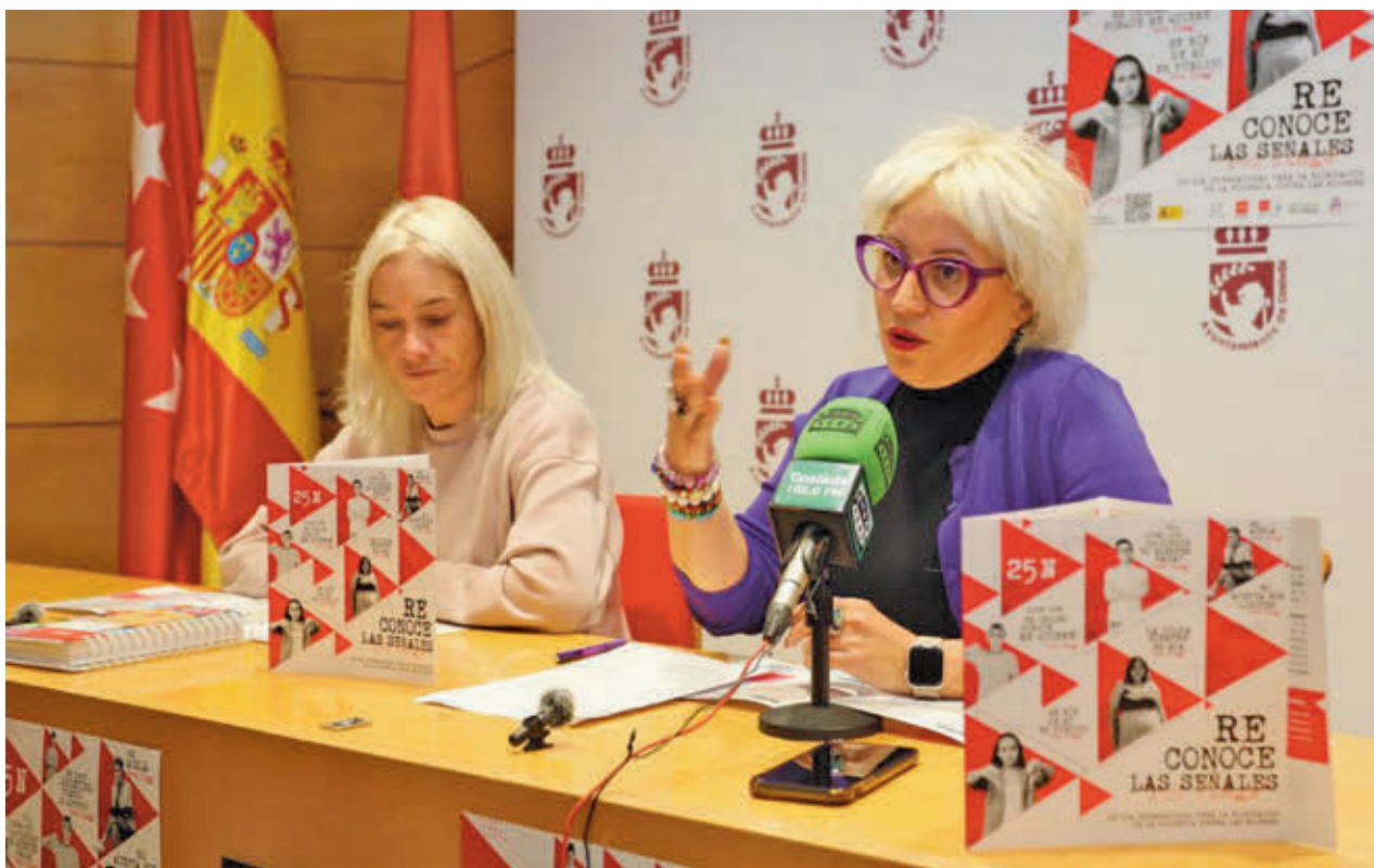
Presentación de la programación del 25-N en Coslada