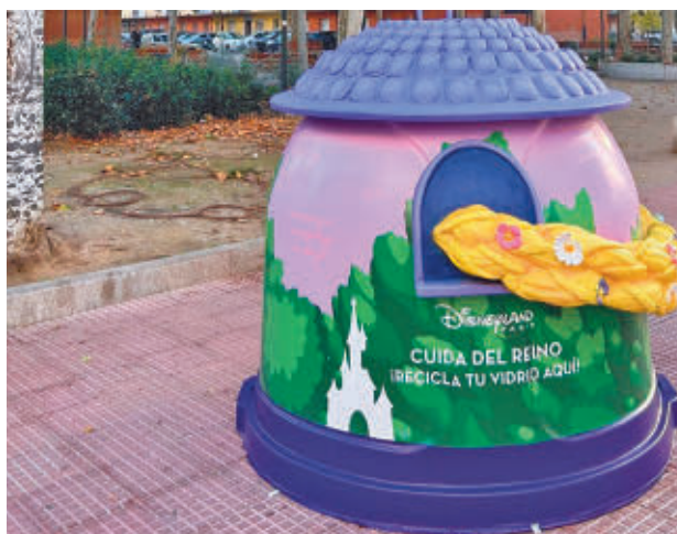
Uno de los iglús de reciclaje

Bajo el lema '¡La magia de reciclar vidrio!', los emblemáticos iglús de reciclaje tematizados con personajes de Disneyland Paris estarán presentes durante tres semanas, donde las familias podrán depositar sus residuos de vidrio mientras disfrutan de personajes únicos. Los participantes en la campaña tendrán la oportunidad de ganar un viaje a Disneyland Paris.