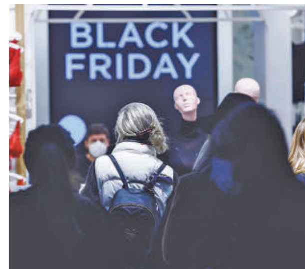
Las ofertas se multiplican en estas fechas

Una de las variables con incidencia directa en el consumo es la inflación, asunto que también aborda la encuesta de GoDaddy y que revela cierto optimismo. El 32% afirma que la inflación no afectará a sus compras, mientras que un 38% señala que gastará lo mismo que el año pasado.