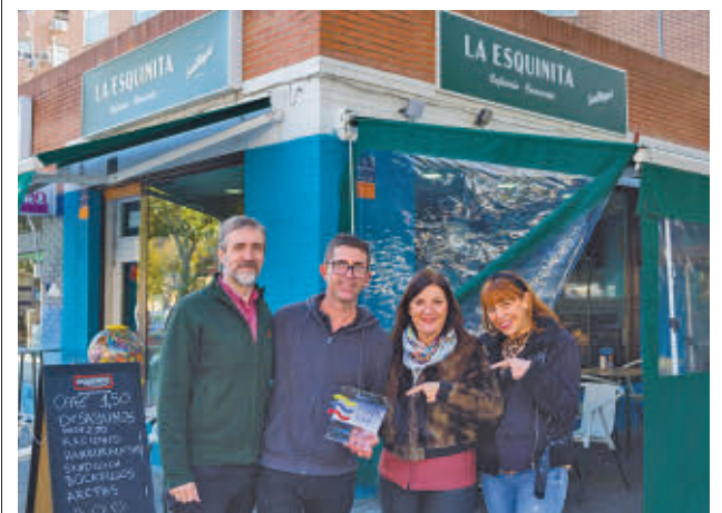
Los premiados recogiendo el premio DEGUSTA FUENLABRADA

Con dicho importe, entre otras cuestiones, se sufragarán los gastos derivados de la recogida y transporte de los desechos domésticos, tales como envases, papel, cartón o bolsa de desperdicios, en los municipios para los que la Mancomunidad del Sur presta este servicio desde 2013. Cabe destacar que los depósitos se realizan en el vertedero de residuos urbanos de Pinto, así como en las estaciones de transferencia de residuos urbanos de Leganés, Las Rozas de Madrid, Colmenar del Arroyo y de Oreja. Estas medidas de la Consejería tienen como objetivo incrementar la sostenibilidad y reducir las basuras de las viviendas particulares.