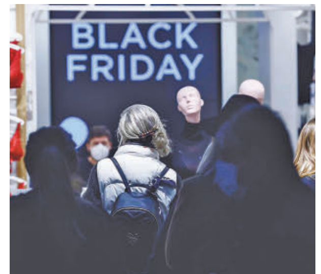
Las ofertas se multiplican en estas fechas

Una de las variables con incidencia directa en el consumo es la inflación, asunto que también aborda la encuesta de GoDaddy y que revela cierto optimismo. El 32% afirma que la inflación no afectará a sus compras, mientras que un 38% señala que gastará lo mismo que el año pasado.