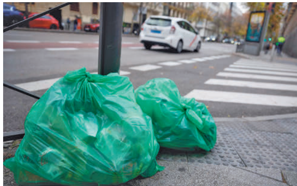
Con dicho importe se sufragarán los gastos de recogida y transporte de desechos domésticos

GenteMadrid.es Consulte la actualidad regional y local en nuestra página web