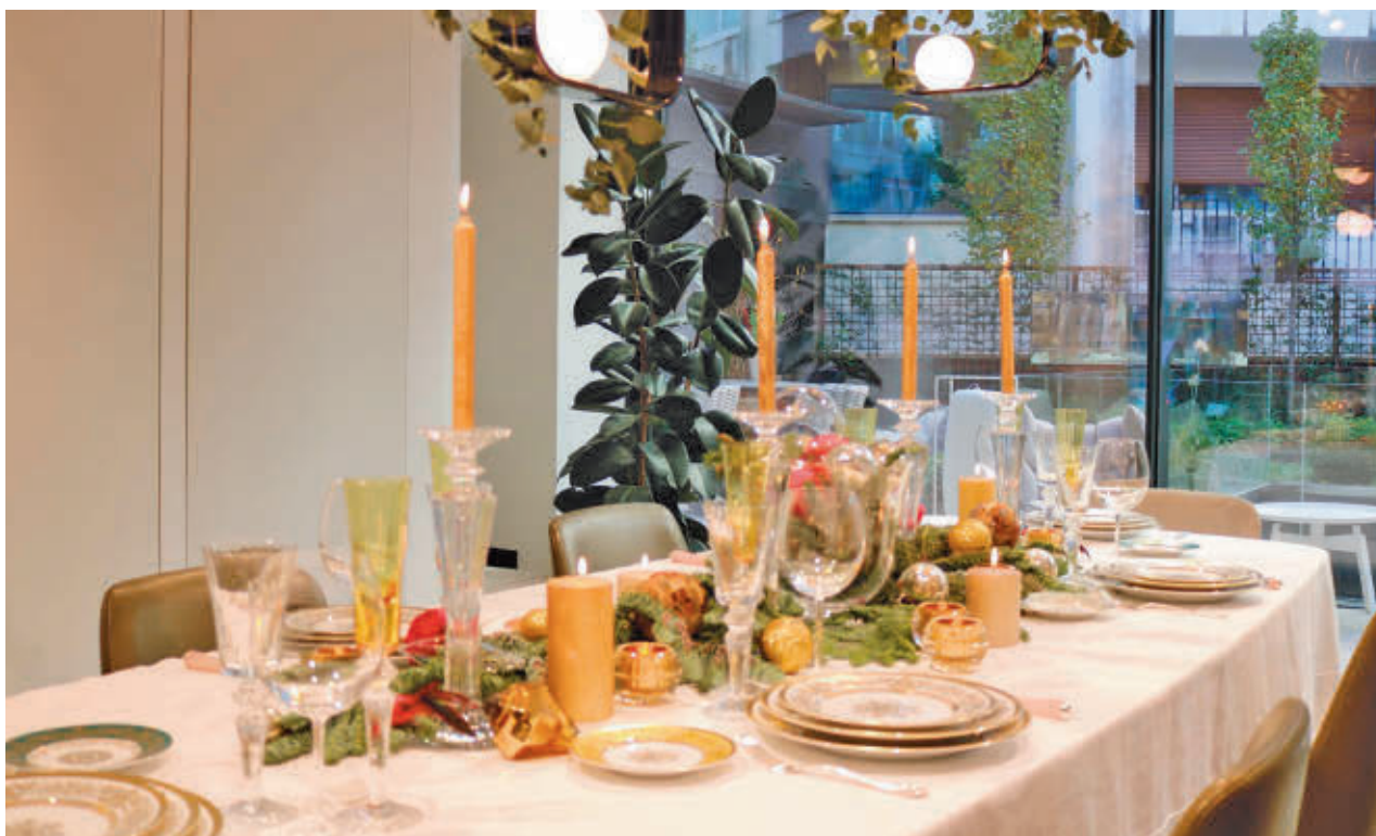
Los restaurantes madrileños se preparan para una época clave