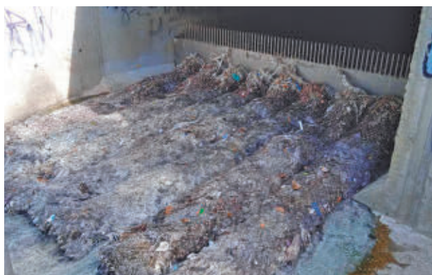
Toallitas acumuladas en una depuradora

danía de las consecuencias que acarrea utilizar el retrete como cubo de basura, un hábito que puede causar serios daños tanto en las instalaciones interiores de las viviendas como en la red de alcantarillado, especialmente en depuradoras, infraestructuras hidráulicas vitales para la salva-