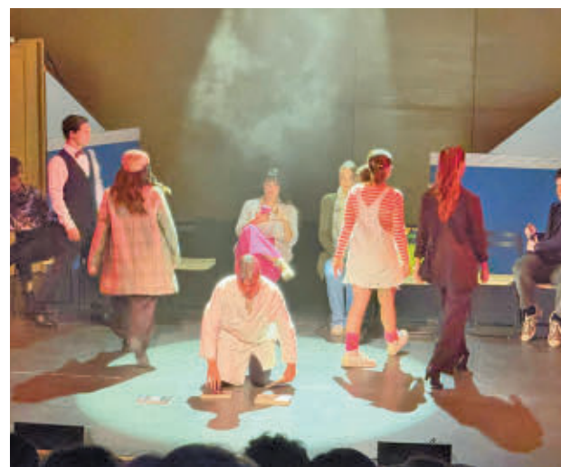
Una escena de 'La Sala de Espera'

El CD Leganés ha vendido todas las entradas disponibles para el partido frente al Madrid y vigilará el correcto uso de los abonos.