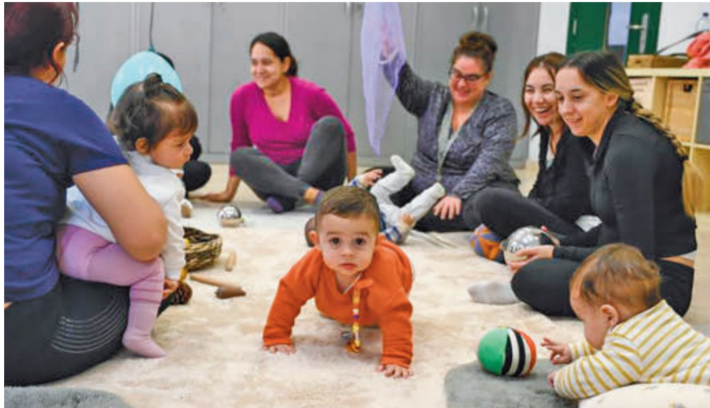
Uno de los espacios de crianza de la Fundación La Caixa

El proyecto se desarrolla actualmente en las localida-