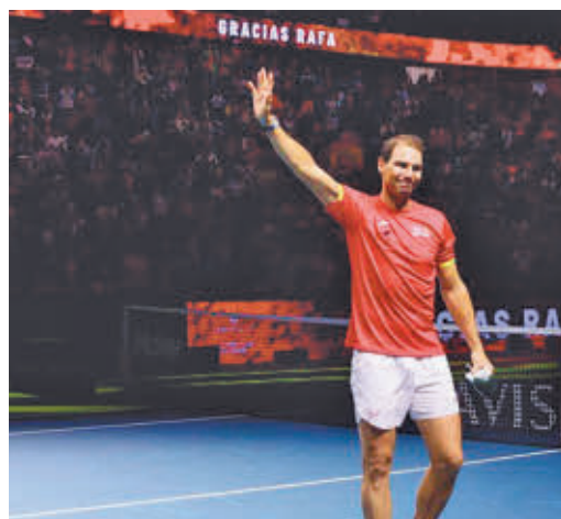
Nadal se despidió del tenis en Málaga

EL PERIÓDICO GENTE EN MADRID NO SE RESPONSABILIZA NI SE IDENTIFICA CON LAS OPINIONES QUE SUS LECTORES Y COLABORADORES EXPONGAN EN SUS CARTAS Y ARTÍCULOS