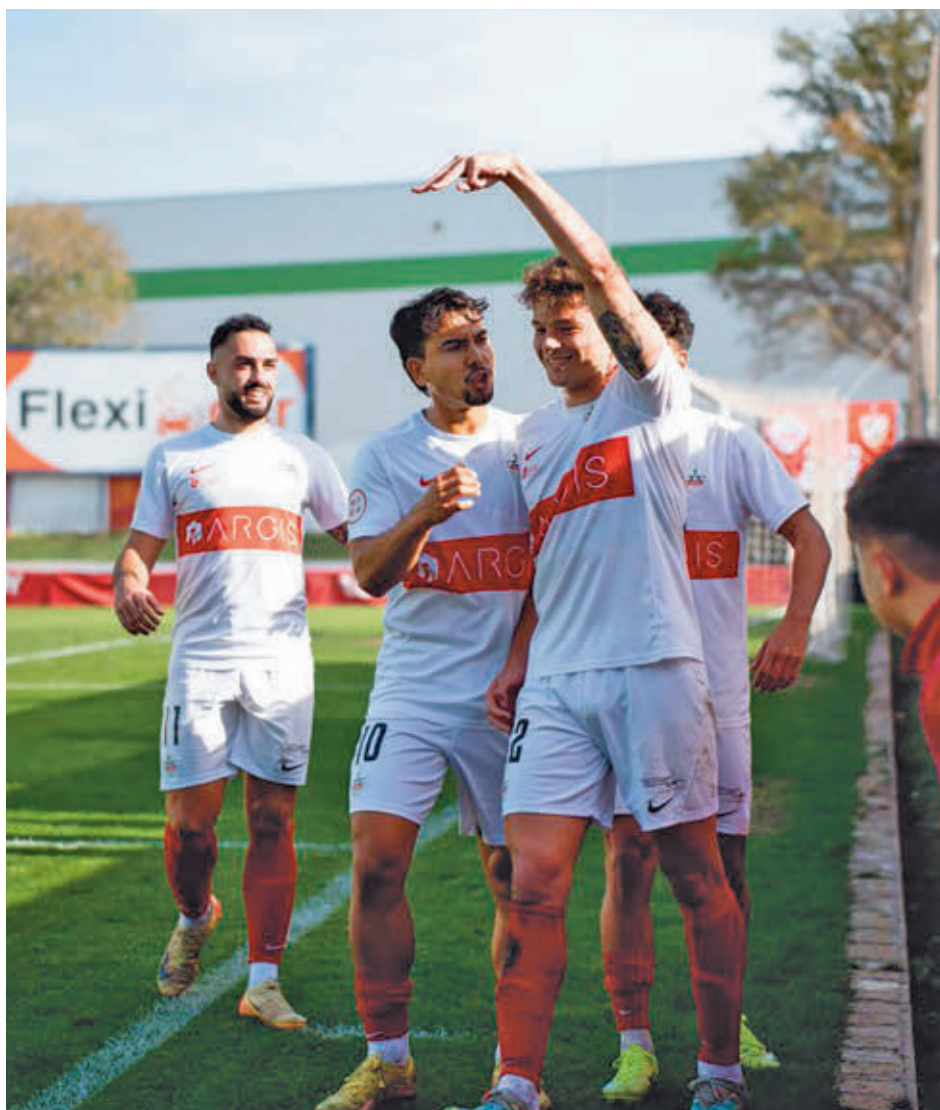
El Sanse visitará este domingo el Cerro del Espino tras su goleada al Unión Sur Yaiza

Quien ha perdido comba respecto a la zona de ascenso es el Rayo Majadahonda, un equipo que atraviesa una crisis de resultados tras sumar solo uno de los últimos 12 puntos disputados. Con el ánimo de revertir esa mala racha, este domingo (12 horas) recibirá a una UD San Sebastián de los Reyes que tampoco está para grandes alegrías. El conjunto que dirige Gonzalo Ónega tiene solo dos puntos de margen respecto a la zona de descenso a pesar del triunfo de la pasada jornada en Matapiñonera ante el Unión Sur Yaiza (5-2). Preci-