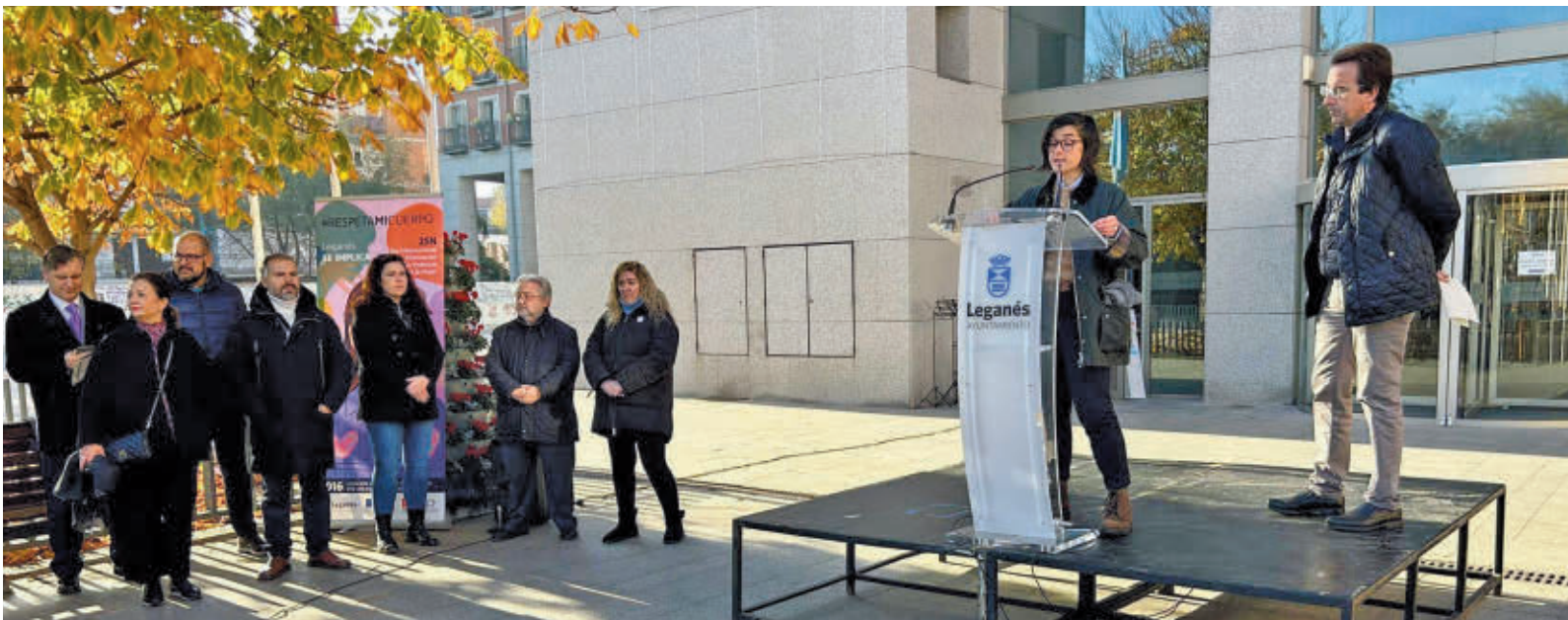
Acto institucional del pasado año con motivo de la celebración del 25-N