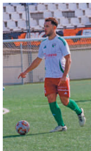
El Trival empató ante el Parla

Por su parte, la RSD Alcalá tendrá que visitar el campo de uno de los filiales de la categoría, el Rayo Vallecano B, tercer clasificado y que se ha situado a solo tres puntos de los dos primeros.