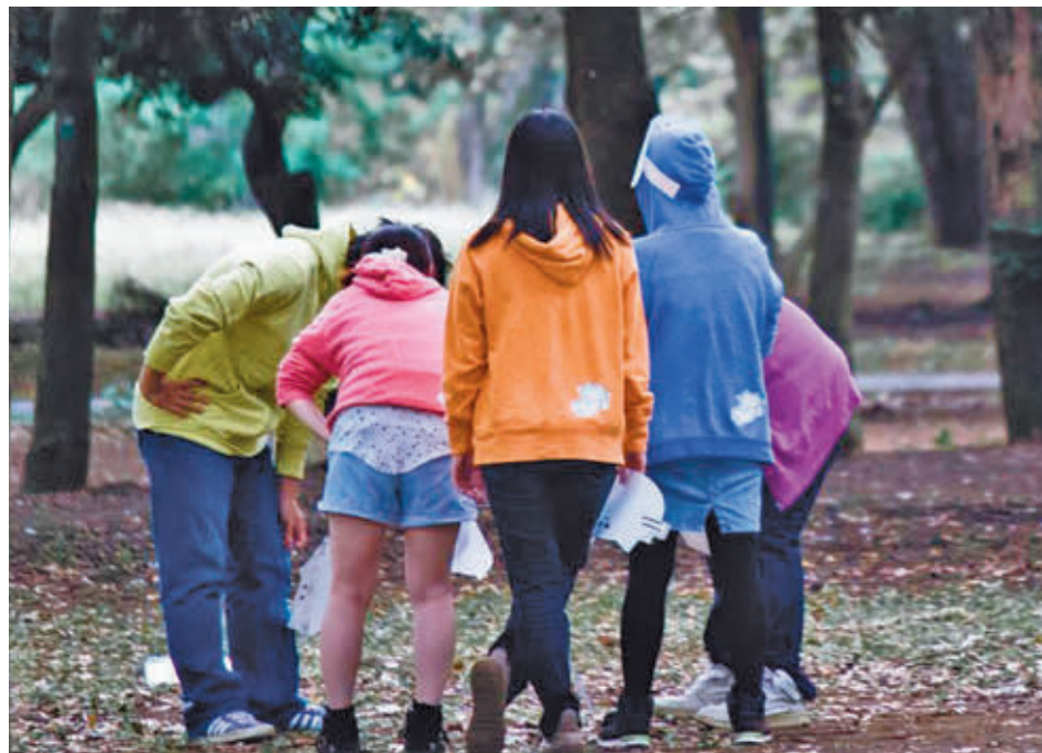
Los alumnos madrileños han obtenido una buena valoración

ment (IEA) y en el que han participado por primera vez 50 centros educativos y 1.300 estudiantes de 2º curso de Educación Secundaria Obligatoria (ESO). Este estudio, que se ha realizado en 34 países y 11 comunidades autónomas españolas, también ha contado con la realización de cuestionarios de contexto a los equipos directivos, el profesorado y los coordinadores de Tecnologías de la Infor-