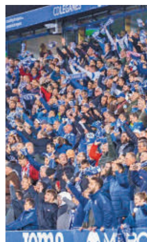
Grada de Butarque

La Feria ha sido posible gracias al trabajo del Ayuntamiento de Leganés con la Comunidad de Madrid, CEIM, la Cámara de Comercio de Madrid y la Unión Empresarial de Leganés (UNELE).