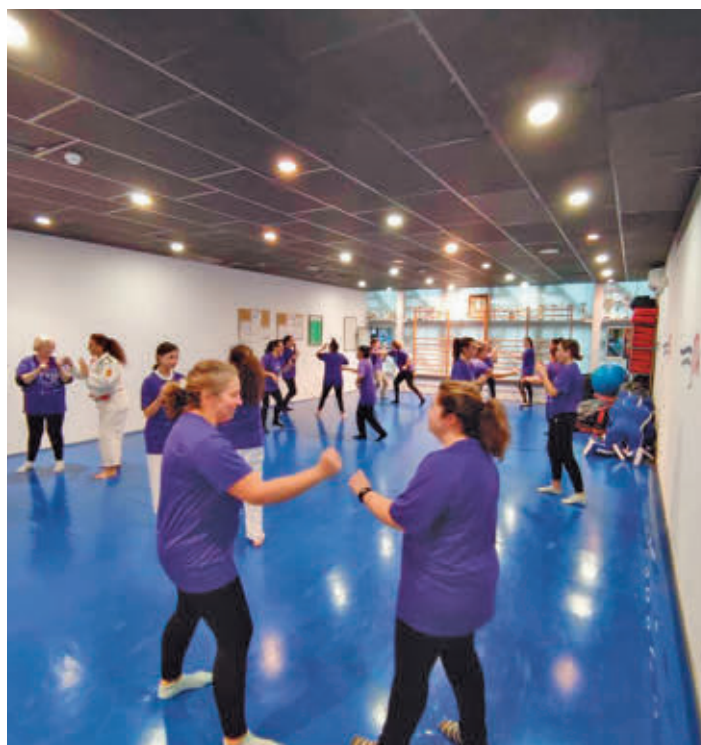
Habrà un seminario de técnicas de autodefensa

USUARIAS DEL PMORVG CREARÁN UNA MARIPOSA GIGANTE