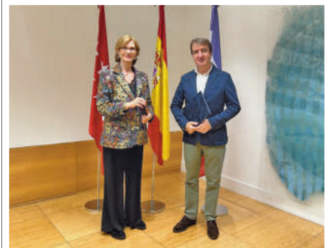
El alcalde, junto a la subdirectora de la fundación