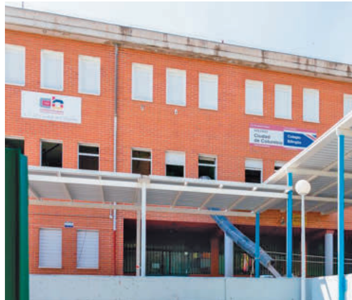
Fachada del colegio tricantino

continuación, el Consejo Escolar votó de manera unánime a favor.