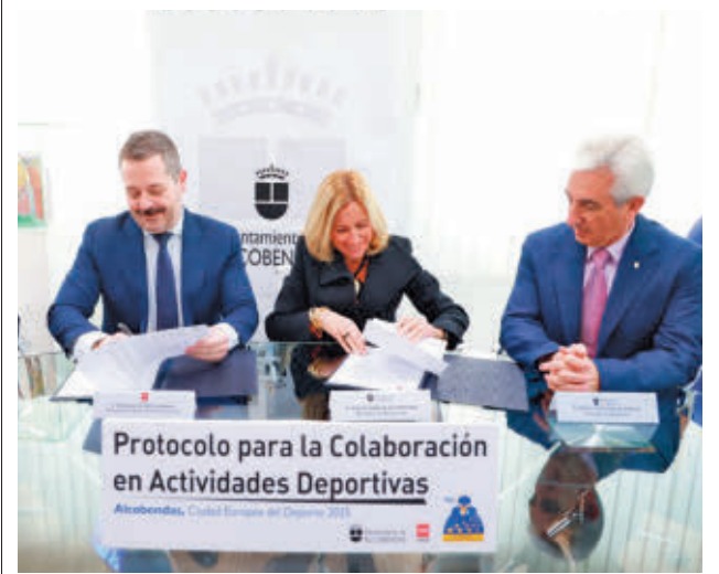
Momento de la firma del protocolo

GenteMadrid.es Consulte la actualidad regional y local en nuestra página web