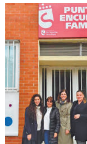
Fachada del edificio

Ahora, después de los trabajos realizados, este espacio destinado a los menores y sus progenitores ya luce con una nueva imagen. El PEF es