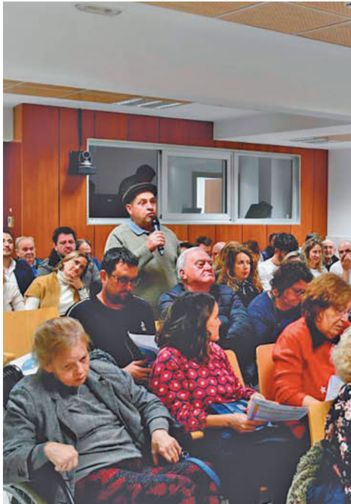
Intervención de uno de los asistentes

La Agenda Urbana es el mayor proceso participativo que se ha puesto en marcha en la historia de la ciudad, donde se tienen en cuenta todas las opiniones y sensibilidades para desarrollar las iniciativas que van a sentar