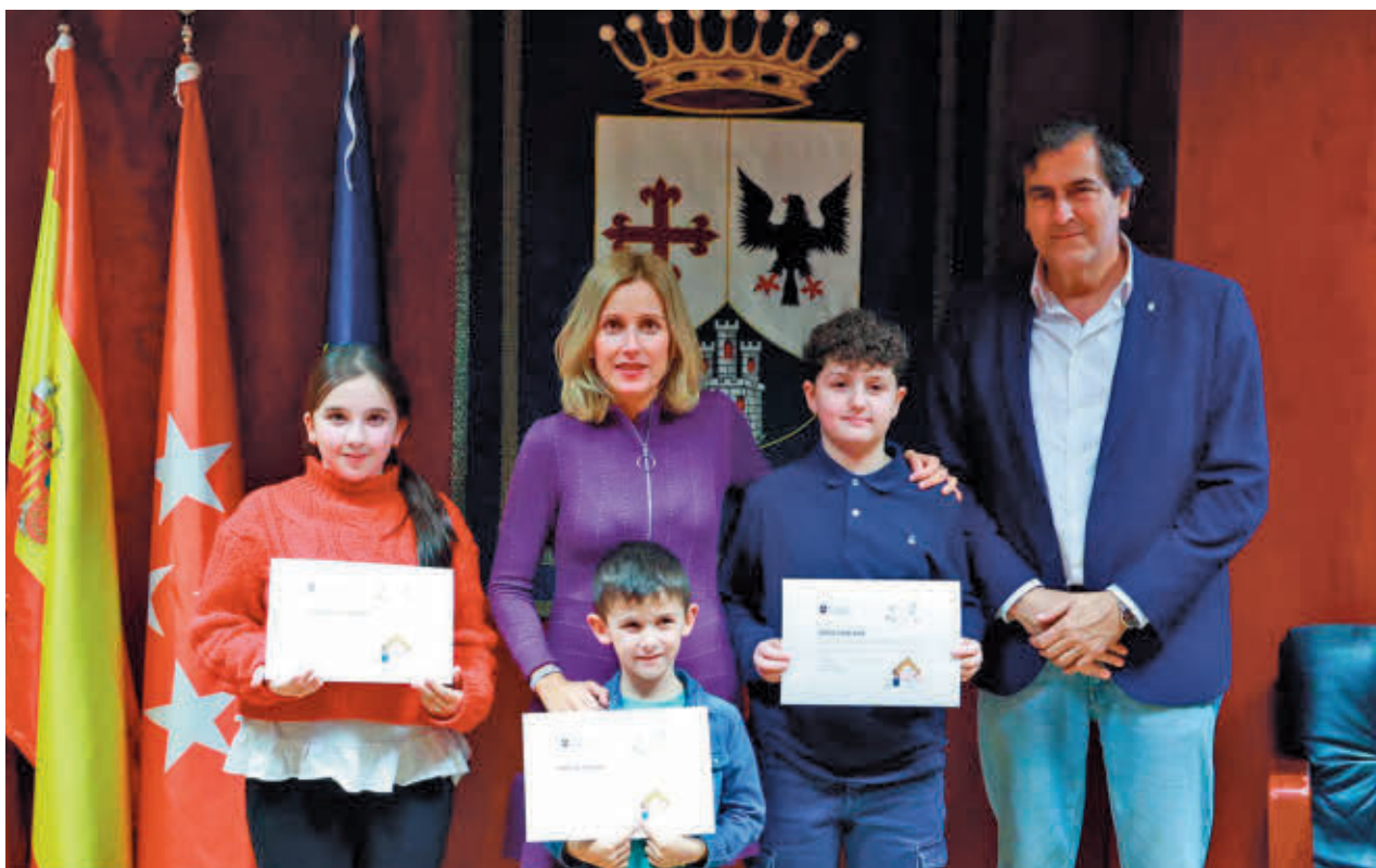
Los ganadores de Ilumina Alcobendas fueron recibidos por la alcaldesa y el concejal de Educación