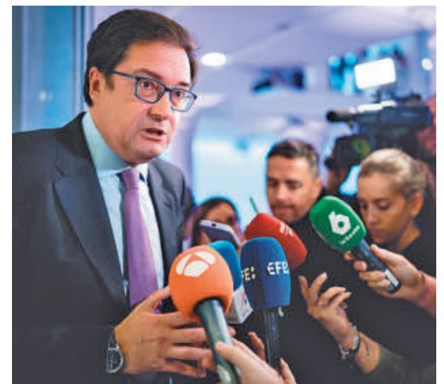
El ministro Óscar López

Aunque nació en Madrid hace 51 años, la única experiencia de Óscar López en la política regional la vivió en Castilla y León, la tierra de sus padres. Allí fue nombrado secretario general en 2008 y fue cabeza de lista en las autonómicas de 2011. Perdió con claridad ante el popular Juan Vicente Herrera y solo unos meses más tarde regresó a la política nacional.