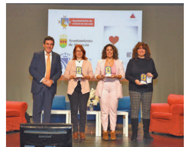
AYTO DE FUENLABRADA

El Ayuntamiento de Fuenlabrada ha sido premiado por la Asociación de Directoras y Gerentes de Servicios Sociales (ADYGSS) en la modalidad ‘Institución Pública’, por su trayectoria en la mejora permanente en esta área para la ciudadanía y por su colaboración con la Asociación.