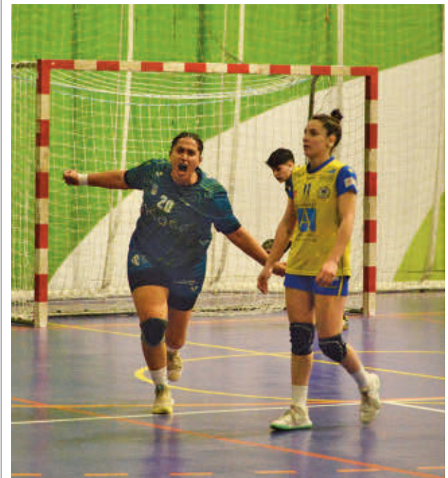
Gran arranque de curso del Ikasa FRANCIS IGUACEL

Los otros dos inquilinos de las primeras posiciones también se medirán a rivales de la zona baja. El Bolaños recibe a un Carballal que es penúltimo y el Lanzarote visitará al Mislata.