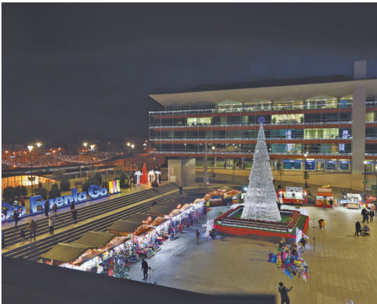
AYTO DE FUENLABRADA