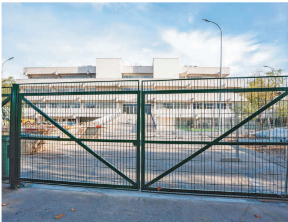
Fachada del centro habilitado para la acogida de menores extranjeros no acompañados