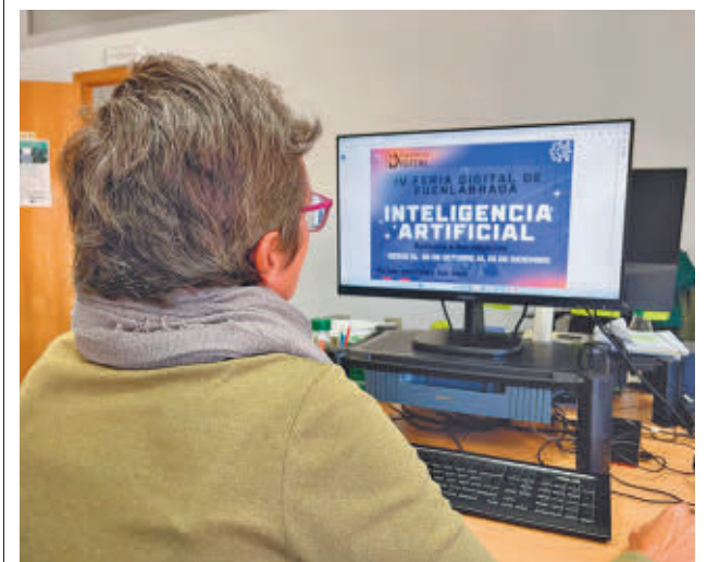
Habrán ponencias y talleres