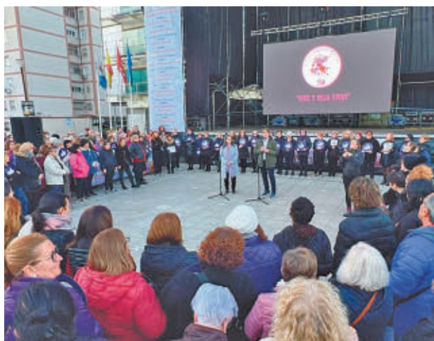
El acto finalizó con un mensaje positivo AYTO DE FUENLABRADA

La acción finalizó con un mensaje positivo en alusión al nacimiento de movimientos y organizaciones de mujeres unidas gracias a las redes sociales para luchar contra esta violencia.