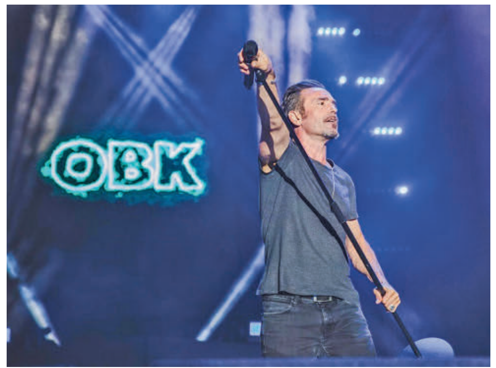
El cantante de OBK Jordi Sánchez y su grupo estarán en Fuenlabrada

En la misma jornada se iluminará el Paseo de la Navidad, “un brillante y mágico itinerario” que recorre calles y plazas del centro uniendo actividades, actuaciones y luces,